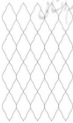
شکل ۱۳: (نگارندگان، ۱۳۹۸).