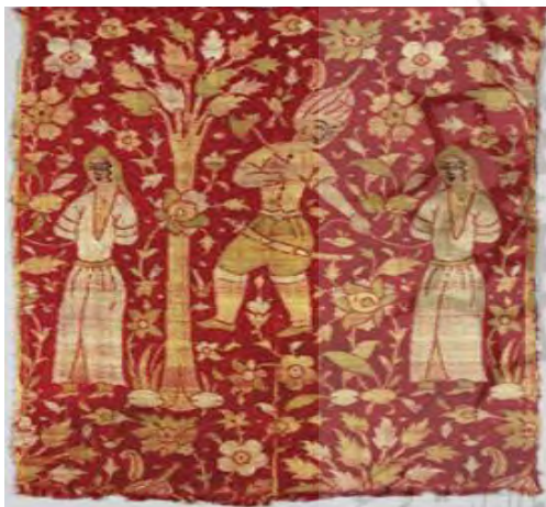
شکل ۴. ابریشم جناغی‌بافت روی زمینه ساتن، سده ۱۰ ه.ق.

مکتب اصفهان: مکتب دیگری که در امر پارچه‌بافی رایج شد، شیوه رضا عباسی، نقاش مشهور این دوره بود که در واقع همان مکتب اصفهان است که وی و شاگردانش آن را ابداع کردند و به اوج رساندند. در امر زری‌بافی نیز این شیوه بسیار رونق یافت و ویژگی آن استفاده از طرح‌ها و نقوش بزرگ و عمدتاً با موضوع نقش انسان و طبیعت بود که در نقش کردن آن بیشتر شیوه‌های ایرانی مدنظر بود (ابراهیمی ناغانی و جعفری دهکردی، ۱۳۹۷: ۲۹). (شکل ۴).