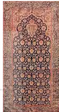
شکل ۲. پوشش قبر از پارچه زری دارایی، سده ۱۱ ه.ق (روح‌فر، ۱۳۸۰: ۳۱).

در نمونه‌های این سبک شاهد راه‌هایی هستیم که هر یک به قسمت‌های مستطیل‌شکل تقسیم شده‌اند. البته پارچه‌هایی با نقوش گل و گیاه صرف نیز در این دسته‌بندی قرار می‌گیرند؛ ولی نوع طراحی گل‌ها به شیوه‌ای است که در رده نقاشی گل و مرغ قرار می‌گیرد. در این نوع پارچه‌ها، طرح گل‌ها، پرندگان، حیوانات و حشرات به صورت پراکنده در سطح به همراه اسلیمی‌ها یا بدون آن‌ها تصویر شده‌اند (حسین‌زاده قشلاقی و مونس‌سرخه، ۱۳۹۵: ۹۹) (شکل‌های ۲ و ۳).