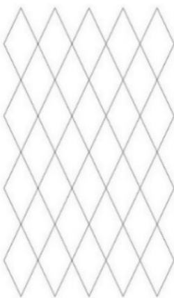
شکل ۱۴: (نگارندگان، ۱۳۹۸).

آن در قالی‌ها و جلد‌ها، کتاب‌آرایی، منسوجات و... این دوره یافت می‌شود؛ بنابراین این دوران در بررسی و تحلیل نقش ترنج در آثار اسلامی و در منسوجات دوره صفوی، نقش ترنج از کاربرد منفرد یک فرم بیضی شکل در وسط زمینه فراتر می‌رود و در فرم‌های متنوع دیده می‌شوند که به صورت تکرارشونده در کل زمینه پارچه قرار دارد. معمولاً این ترنج‌ها اندازه‌ای یکسان داشته و تناسب و تعادل بسیار مناسبی را در کل اثر ایجاد نموده است (شکل ۱۳ و ۱۴). ساختار تشکیل‌دهنده ترنج‌ها در تمامی نمونه‌ها یکسان و به صورتی است که بر اساس محور تقارن و به روش قرینه انعکاسی تشکیل می‌شوند. طرز قرارگیری ترنج‌ها نشان از پیروی از الگوی یکسانی دارد که نظمی را در متن اثر ایجاد کرده است.