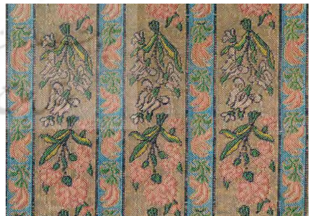
شکل ۳. ابریشم گل برجسته، بافته شده با طلا و نقره، سده ۱۲ هجری. www.textileasart.com, 1399

ویژگی این سبک استفاده از طرح‌های کوچکی بود که در یک طرح کلی با یکدیگر هماهنگی داشتند. غیاث با این‌که اهل یزد بود و کارگاه‌های زری‌بافی یزد را اداره می‌کرد، بنا به