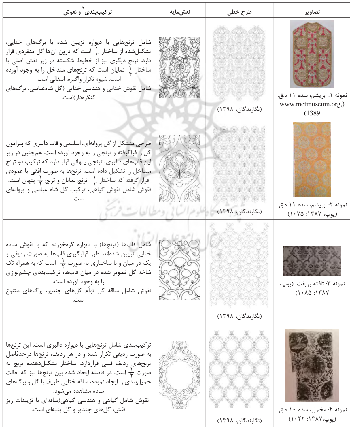
جدول ۲: پارچه‌های دوره صفوی با نقش/ فرم ترنج (نگارندگان، ۱۳۹۸).

ترنج‌ها به صورت یک در میان بر روی ردیف‌های عمودی یا افقی قرار گرفته که به دو صورت نمایان و الگوی هندسی پنهان کاربرد داشته است. ترنج‌ها گاه با دیواره یکسان با ترنج بعدی و گاه با فاصله از یکدیگر قرار گرفته و حمیل‌هایی را ایجاد کرده است. حمیل ایجادشده در هماهنگی کامل با ترنج‌ها، فضایی را برای تزیینات بیشتر در متن اثر به وجود