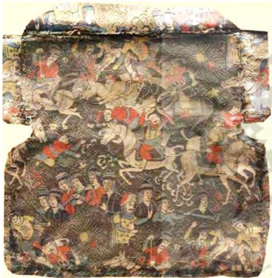
شکل ۱: نقشه بازی چوگان (ناغانی و دهکردی، ۱۳۹۷: ۵).

مکتب تبریز: اساس و خاستگاه این مکتب شیوه بهزاد و مکتب هرات است و بسیاری از هنرمندان نقاش این شیوه، طراح فرش و پارچه نیز بودند. اکثر پارچه‌هایی که شیوه تزئین آن‌ها تابع این مکتب است، در شهرهای یزد و کاشان بافته می‌شدند و بهترین پارچه‌های زربفت با نقوش تصویری انسان در مجالس بزم، رزم، شکار و به خصوص صحنه‌های زندان و زندانیان که از موضوع‌های مورد توجه این مکتب بود، در کارگاه‌های این مراکز بافته می‌شدند و به این ترتیب پارچه‌های این شیوه با عناوین مکاتب پارچه‌بافی تبریز - یزد و تبریز - کاشان طبقه‌بندی شده‌اند (ابراهیمی ناغانی و جعفری دهکردی، ۱۳۹۷: ۲۹) (شکل ۱).