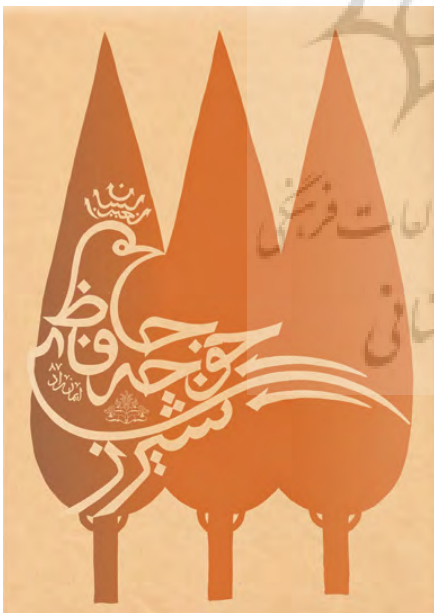
تصویر ۴: پوستر خواجه حافظ شیراز، اثر ایمان راد، نماد درخت سرو و پرنده (مجموعه نگارندگان، ۱۳۹۵).

در پوستر گنجینه هنرهای از یاد رفته، اثر فرزاد ادیبی، طاووس، پرنده بهشتی در هنر ایران، به عنوان نمادی که در کاشی‌کاری مسجد شیخ لطف ... به کار رفته در ترکیب با فضای کاشی‌کاری زیر گنبد مسجد ترسیم شده است. این نشانه علاوه بر معنای نمادین آن و ارجاع به هنر ایرانی نمونه‌ای از کاربرد مرغ یا پرنده نمادین را در آثار گرافیکی ایران نشان می‌دهد.