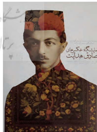
تصویر ۲: پوستر نمایشگاه صادق هدایت هم‌نشینی نشان تصویری و نقاشی گل و مرغ را نشان می‌دهد (مجموعه نگارندگان، ۱۳۹۵).

در آثار گرافیکی فارسی گل و مرغ به شکل‌های گوناگونی به کار رفته است. نمونه‌هایی از آن در نگاره‌های ایرانی به ویژه در دوره صفوی دیده شود (تصویر ۱). تداوم حیات گل و مرغ را می‌توان در پوسترهای فارسی نیز مشاهده کرد. در این پوسترها معمولاً نشان گل و مرغ یا نقاشی گل و مرغ به کار رفته است. در پوستر نمایشگاه عکس‌های صادق هدایت، نشان تصویری نیم تنه صادق هدایت، با نقاشی گل و مرغ پر شده‌است و نشان گل و مرغ حال و هوای نقاشی‌های دوره قاجار را تداعی می‌کند که نوعی ارجاع زمانی به تصویر داده است (تصویر ۲).