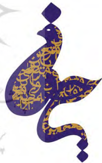
تصویر ۹: شکل‌گیری مرغ با استفاده از تایپوگرافی فارسی اثر احسان بشیر (مجموعه نگارندگان، ۱۳۹۵).