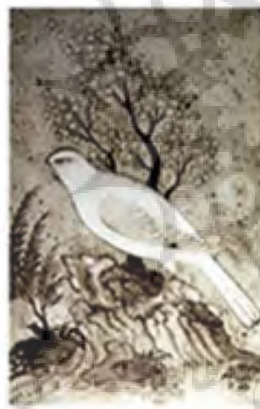
تصویر ۱: هم‌نشینی گیاه و پرنده در نگارگری ایرانی (مختاریان، ۱۳۸۹).

در بندهش گفته می‌شود: «چهارم نبرد را گیاه کرد. آن‌گاه که خشک بشد، امرداد امشاسپند که گیاه از آن اوست، آن گیاه را خرد نرم کرد. با آبی که تیشتر بستد، بیامیخت. تیشتر آن آب را به همه زمین ببارانید. بر همه [زمین] گیاه چنان برست که موی سر مردمان، از آن یک نوع اصلی، برای باز داشتن ده هزار بیماری که اهریمن بر ضد آفریدگان ساخت، ده هزار [نوع گیاه] فراز رست. از آن ده هزار، یکصد هزار نوع در نوع گیاه فراز رست (فرنبرگ دادگی، ۱۳۸۵: ۸۷). «ظهور نقش گل و مرغ در چین که از طلایه‌داران این