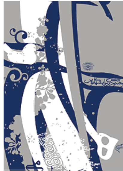
تصویر ۱۲: هم‌نشینی نشانه‌های نوشتاری با نشانه‌های گیاهی و پرنده در پوستر نمایشگاه هنر اسلامی اثر رسول کاظمی.