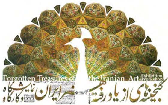
تصویر ۳: پوستر گنجینه هنرهای از یاد رفته، اثر فرزاد ادیبی (مجموعه نگارندگان، ۱۳۹۵).

در پوستر گنجینه هنرهای از یاد رفته، اثر فرزاد ادیبی، طاووس، پرنده بهشتی در هنر ایران، به عنوان نمادی که در کاشی‌کاری مسجد شیخ لطف ... به کار رفته در ترکیب با فضای کاشی‌کاری زیر گنبد مسجد ترسیم شده است. این نشانه علاوه بر معنای نمادین آن و ارجاع به هنر ایرانی نمونه‌ای از کاربرد مرغ یا پرنده نمادین را در آثار گرافیکی ایران نشان می‌دهد.