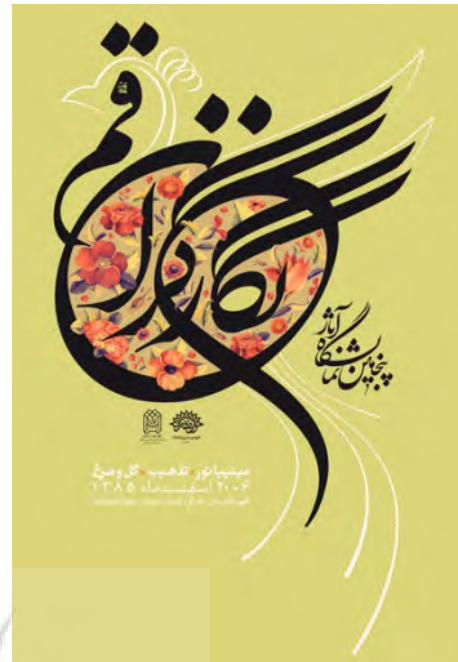
تصویر ۸: پوستر پنجمین نمایشگاه آثار نگارگران قم اثر نجابتی (مجموعه نگارندگان، ۱۳۹۵).

۹ الی ۱۲). در پوستر جشنواره موسیقی محلی بال‌های پرنده حرکتی دوار را تشکیل داده‌است؛ حرکتی اسپیرالی در کنار علائم موسیقایی و خطوط حامل، ریتم و ضرباهنگ ویژه‌ای را به اثر بخشیده است. شیوه نقش‌پردازی مرغ آمیزه‌ای از نگارگری ایرانی است که به سبب القای حس موسیقایی، شکل دوار گرفته است. «ترکیب‌های اسپیرالی در نگاره‌های ایرانی کاربرد فراوانی دارد. این نوع ترکیب‌بندی باعث ایجاد حرکت در تمام مجموعه یک نگاره می‌شود و سکون در نگاره را از بین می‌برد. گویی هر شی موجودیت خود را از منبع و مبداء اصلی وجود دریافته و همواره فیضان نور و جمال حق را تداعی ۳۱:۱۳۹.