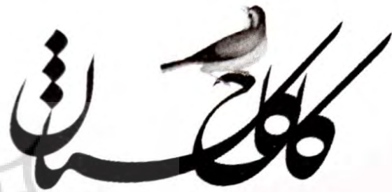
تصویر ۵: پوستری از قباد شیوا (مشکی، ۱۳۸۵: ۱۴).

(دادور و منصوری، ۱۳۸۵: ۱۰۲) که مرغ بسم‌الله از طریق ترکیب‌بندی نوشتار بر آن ایجاد شده است، این اثر بار دیگر کاربرد گیاه و مرغ را مصور می‌کند که به پیشینه هنری تاریخی آن در هنر ایران اشاره دارد. در هنر ایران نمونه‌هایی از درخت مصور شده که سیمرغ بر فراز آن است. با مطالعه متون زرتشتی به ویژه متن بندهش و زادسپرم می‌توان آن را نماد زندگی تفسیر کرد (James, 1966: 79). نماد سرو در پوستر دیگری از قباد شیوا هم دیده می‌شود (تصویر ۵).