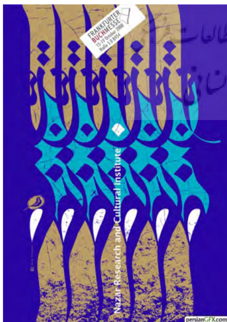
تصویر ۱۱: هم‌نشینی نماد پرنده و نوشتار در اثری از نجابتی (مجموعه نگارندگان، ۱۳۹۵).

همانند نقاشی خط بسیاری از پوسترها از ترکیب نشانه‌های نوشتاری، مرغ را به عنوان یک نشان تصویری به نمایش گذاشته‌اند. در نمونه‌های زیر پوسترها از هم‌نشینی پرنده و نوشتار و یا ترسیم پرنده با تکرار نوشتار شکل یافته‌اند (تصاویر