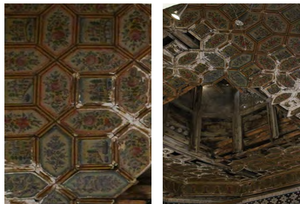
تصویر ۹: بخشی از نقاشی بر سقف چوبی به شیوه آلت و لقط حوضخانه

سقف حوضخانه هشت‌ضلعی است و از چوب به شیوه آلت و لقط به وجود آمده است و نورگیر گره‌چینی در مرکز آن وجود دارد. بر قاب‌های چوبی سقف نقاشی کار شده که قسمت‌های زیادی از آن تخریب شده است. نقاشی این سقف در قاب‌های مربع‌شکل، مناظر اروپایی و در قاب‌های اطراف آن‌ها گل و مرغ است. زمینه رنگی اثر به رنگ سبز روشن است و گل‌های سرخ و زنبق و بلبلان بر شاخه‌ها نقاشی شده‌اند. این نقاشی‌ها با سایه روشن دقیق به شیوه اروپایی که از شیوه‌های رایج در دوره قاجار بود اجرا شده است. در اطراف سقف حاشیه‌ای با قاب‌بندی هندسی است که با نقاشی به همان شیوه پوشیده شده است (تصویر ۹).