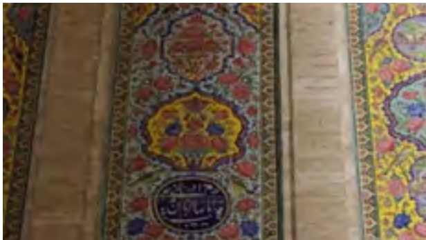
تصویر ۷: تزیینات کاشی‌کاری بر دیوار ضلع جنوبی حوضخانه دخانچی