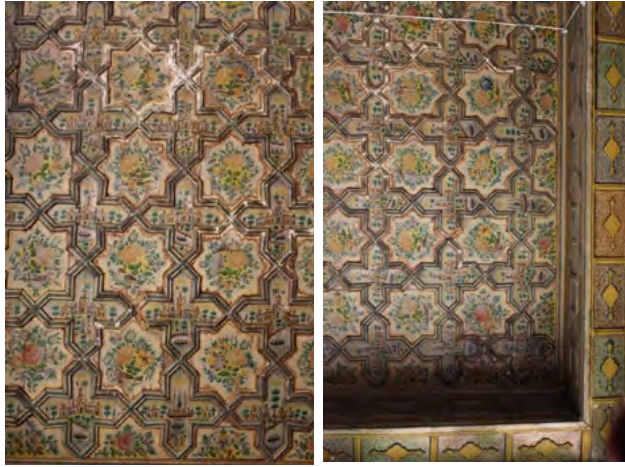
تصویر ۶: بخشی از نقاشی بر سقف چوبی به شیوه آلت و لفت در اتاق ضلع شرقی خانه دخانچی (نگارندگان، ۱۳۹۴).