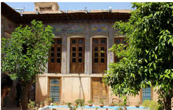
تصویر ۲: بخشی از نمای ضلع غربی خانه دخانچی. (نگارندگان، ۱۳۹۴).

می پردازد. کاشی کاری خانه دخانچی نیز اثر این هنرمند بوده است (۱۳۷۶:۱۷۸). همان طور که گفته شد از تزیینات دیگر در خانه های قاجاری شیراز، نقاشی بر سقف است. در منابع متعدد از نقاشی بر سقف خانه ها به عنوان یکی از شاخص ترین هنرهای قاجاری شیراز نام برده شده؛ اما اشاره ای به روند شکل گیری و عناصر به کار رفته در آن ها نشده است. تنها در دو اثر از ویلم فلور به نام های نقاشی و نقاشان دوره قاجار و دیوارنگاری در دوره قاجار به موضوع نقاشی دوره قاجار دقیق تر پرداخته شده است. به طوری که در اثر اول به معرفی سبک ها و مضامین نقاشی آن زمان و وضعیت جماعت نقاش پرداخته و در اثر دوم نیز تزیینات معماری و هنر دیوارنگاری بناهای سلطنتی، عمومی و خانه های شخصی در دوره قاجار را بررسی کرده است (فلور و دیگران، ۲۱:۱۳۸۱)، (فلور، ۱۳۹۵:۲۰۹). از آن جا که خانه های قاجاری شیراز از نمونه های ارزشمند معماری سنتی ایران محسوب می شوند، منابعی با این مضمون مورد مطالعه قرار گرفت که در آن ها به نقش عناصر مختلف معماری اشاره شده است.