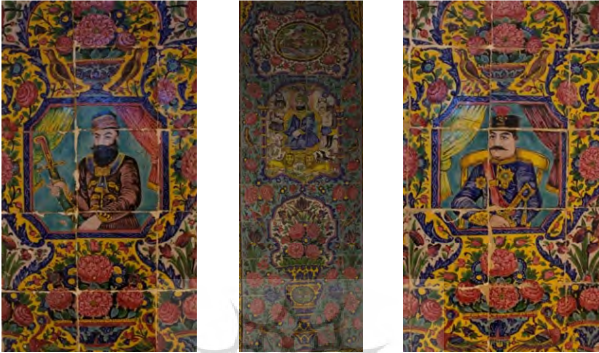
تصویر ۸: تزئینات کاشی کاری بر دیوارهای ضلع غربی، شرقی و شمالی حوضخانه دُخانچی (نگارندگان، ۱۳۹۴).