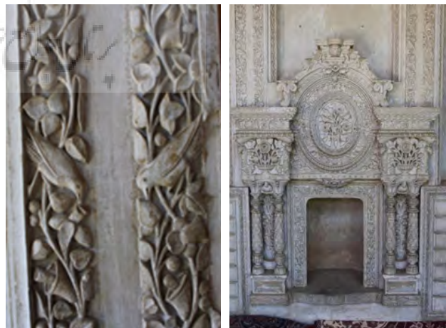
تصویر ۵: نمونه‌ای از گچ‌بری پیش بخاری و دیوار اتاق ضلع شرقی خانه دخانچی با نقوش گل و مرغ.