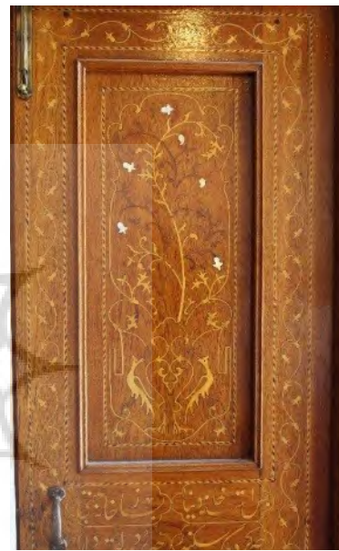
تصویر ۴: معرق چوب بر درهای خانه دخانچی همراه با نقوش گل و مرغ و خوشنویسی (نگارندگان، ۱۳۹۴).

دو قسمت است. بخش بیرونی تقسیم‌بندی مستطیلی دارد که با رنگ‌های قرمز و سبز رنگ‌آمیزی شده و نقش ترنجی برجسته روی آن قرار دارد. قسمت داخلی، قاب‌بندی‌های هندسی دارد که در قاب‌های مربع منظره و در قاب‌های دیگر دسته‌های گل کشیده شده‌است (تصویر ۶). اتاق‌های دیگر خانه نیز با تزیینات گچ‌بری و گره‌چینی سقف آرایش یافته‌اند، اما هنر نقاشی بر آن‌ها انجام نشده و تنها رنگ‌آمیزی تخت بر گره‌ها صورت گرفته است.