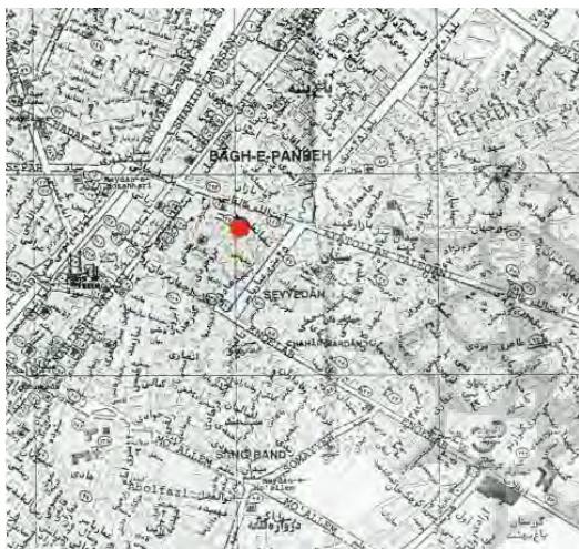
تصویر ۲: موقعیت خانه شاکری در شهر قم.

اصلی آن در نبش تقاطع است (تصویر ۳). بافت سنتی اطراف بنا تا حدود زیادی از ساخت و سازهای جدید محفوظ مانده و وجود تعدادی ساختمان با معماری اصیل هنوز در اطراف این خانه مشهود است. ورودی اصلی بنا به صورت دو طبقه بوده و توسط آجرکاری‌ها و ستون‌های سنگی تزیین شده است. هم چنین در آزاره دو طرف ورودی از سنگ‌های یک پارچه منقوش زیبایی استفاده شده است. پس از ورود، فضای مستطیل شکلی با گوشه‌های پخ خورده قرار دارد که در واقع هشتی ورودی و فضای تقسیم روابط بنا است. از این فضا وارد حیاط ساختمان می‌شویم (تصویر ۴).