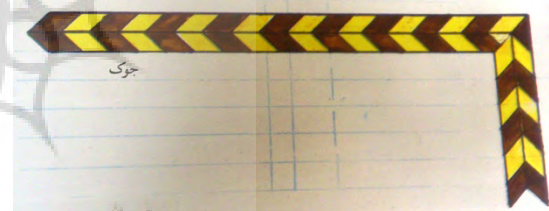
تصویر ۸: چوک.