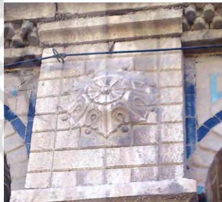
تصویر ۶: گچبری الصاق شده به نمای اصلی. منبع نگارندگان.