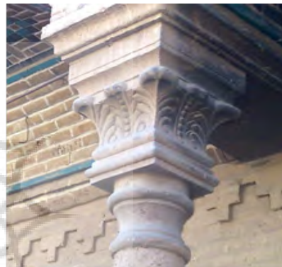
تصویر ۱۰: نقش برگ کنگر در سر ستون‌های ورودی.

پیش با سر مشق‌گیری از بناهای اروپایی ساخته می‌شد. در این میان ستون غالباً نقش مهمی داشت. شاید بتوان گفت استفاده از شیروانی که در این زمان متداول شد، خود اسباب حضور مجدد ستون در نمای بنا را فراهم آورد. ستون‌های عظیم تزئین شده و پر نقش و نگار در ویلاها و کاخ‌های اغنیا پدیدار شد. ستون‌هایی که مستقیماً از مغرب زمین اقتباس شده بودند، از گوشه و کنار شهرهای قاجاری سر برآوردند. اغلب این ستون‌ها، اگر نه در اساس ولی در پرداخت متعلق به سبک باروک بودند. ستون‌های نمایشی که تصنع ظاهری بر جوهره اصلی آن‌ها تقدم داشت.