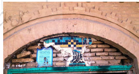
تصویر ۹: کتیبه تخریب شده بسم‌الله بالای سردر ورودی.

نوع دیگری از کاشی، در رخ بام و قسمت زیرین دندانه موشی‌ها، به رنگ زرد و مشکی وجود دارد (تصویر ۸) که استاد زمرشیدی از آن تحت عنوان «چوک» یاد می‌کند