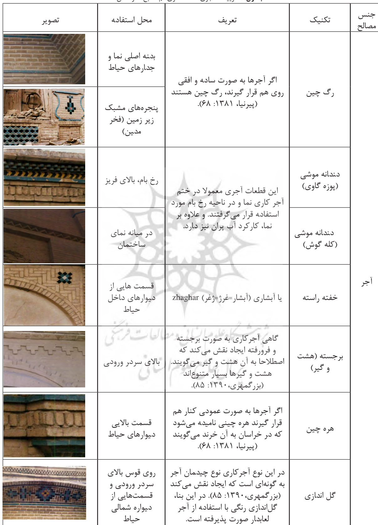
جدول ۲: تزیینات آجری خانه شاکری قم.