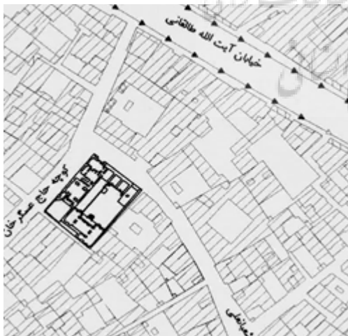
تصویر ۳: موقعیت خانه شاکری نسبت به خیابان‌های اطراف، منبع گزارش ثبتی سازمان میراث فرهنگی قم.

معماری مناسبی دارند و توسط اداره میراث فرهنگی، صنایع دستی و گردشگری شهرستان قم شناسایی و ثبت شده‌اند و با توجه به تزیینات شاخص خانه شاکری در زمینه تزیینات آجرکاری، حجاری، کاشی‌کاری و گچ‌کاری و نیز به دلیل سالم ماندن اکثر این تزیینات، این خانه به عنوان نمونه موردی انتخاب شده و مورد بررسی و ارزیابی قرار گرفت.