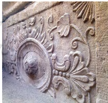
تصویر ۱۶: حجاری‌های سنگی ازاره در قسمت ورودی.