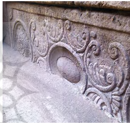
تصویر ۱۵: حجاری‌های سنگی ازاره در قسمت ورودی.