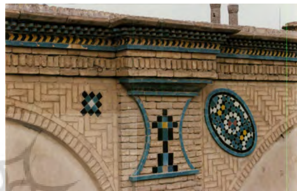
تصویر ۷: کاشی پیش‌بر در دیواره‌های حیاط به شکل بیضی.

اما با وجود این، در جداره شمال حیاط و در قسمت بالای آن، بیضی‌هایی مشاهده می‌شود که با کاشی پیش‌بر تزیین شده‌اند (تصویر ۷). در کاشی پیش‌بر، کاشی‌ها روی خود طرح ندارند. فقط رنگ دارند و به شکلی خاص بریده شده‌اند که کنار هم قرار می‌گیرند (پیرنیا، ۱۳۸۱: ۱۱۲).