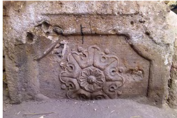
تصویر ۱۴: پاستون با نقش نیلوفر آبی.

حضور نقوش کهن باستانی مانند برگ کنگری در کنار نقش‌مایه‌های فرنگی متداول در دوره قاجاریه و پهلوی مانند گل سرخ، رز و زنبق عناصری هستند که در تزئینات سنگی ورودی، سر ستون‌ها و ازاره‌های سنگی به چشم می‌خورند. هرچند این نقوش به نقوش فرنگی مشهورند و در سبک باروک دیده می‌شوند، ولی ریشه آن‌ها به دوره ساسانی می‌رسد. در طاق بستان کرمانشاه و برخی آثار گچبری مکشوفه از کیش نمونه‌هایی از این نقوش چون برگ کنگری را می‌توان یافت (سخن پرداز و مراثی، ۱۳۸۸: ۶۴-۶). «نقوش گیاهی که در عهد ساسانی در اقسام متنوعی از جمله، آکانتوس (کنگر)، پالم (نخل)، لوتوس (نیلوفر)، انار، تاک و پیچک، میوه انگور،