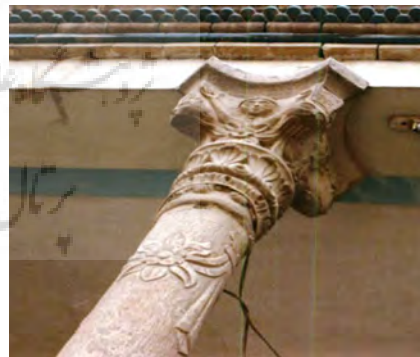
تصویر ۱۱: نقش فرشته در سر ستون‌های داخل حیاط.

همان‌گونه که در تصویر ۱۰ مشاهده می‌شود، سرستون‌های به کار رفته در سردر ورودی، دارای نقش برگ نخل و کنگر هستند. اما در سر ستون‌های به کار رفته در داخل ایوان‌ها