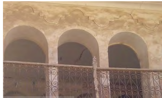
تصویر ۵: گچبری برجسته.

گیاهی (تصویر ۶) که در نمای اصلی بر روی دیوار الصاق شده، می‌باشد. این نقوش همان اشکال برسو شده دوران ساسانی هستند که با نام تازه اسلیمی قالبی تازه می‌یابند و در گچبری‌ها و آهکبری‌ها به وفور دیده می‌شوند.