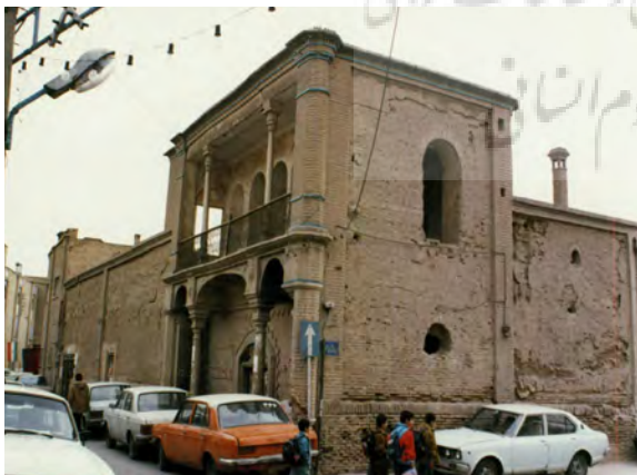
تصویر ۱: دید کلی به خانه شاکری.

معماری شهر قم و بافت تاریخی‌اش، با وجود ارزش‌های نهفته در آن، همچنان ناشناخته باقی‌مانده و با توجه به اسناد و مدارک موجود، تاکنون پژوهش جامع و منسجمی به خصوص درباره معماری خانه‌های تاریخی آن، صورت نگرفته است. تنها در برخی اسناد و مدارک، اشارات کوتاهی به بعضی از بناهای آن، از جمله بازار شهر قم شده است؛ و در مورد خانه‌های تاریخی آن از جمله خانه شاکری (تصویر ۱) فقط اشارات و جملات کوتاهی در حد معرفی ارائه شده است. با توجه به اهمیت و ضرورت الگو گرفتن از الگوهای معماری سنتی، پژوهش حاضر سعی در معرفی و بررسی ویژگی‌های تزیینات خانه شاکری قم به عنوان یکی از خانه‌های قدیمی و شاخص شهر قم، دارد. بدین منظور تزیینات این خانه از جنبه‌های مختلف مانند نوع مصالح، تکنیک، محل اجرا و نوع نقوش به کار رفته به صورت توأمان بررسی شده‌اند.