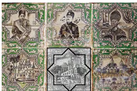
تصویر ۴: نقش هندسی ستاره هشت پر در کاشی‌های تکیه «معاون الملک».

در هنر، هندسه دارای اهمیت و مفهوم ویژه است و گسترش خود را در فلسفه و راه حیات می‌جوید. نقوش هندسی، تجلی‌گاه افکار عالی و عقلانی و ادراک جهان هستی است. قرینه سازی در ترسیم این نقوش اوج یک تفکر استوار است که با احکام و دستورالعمل‌های روشن و با آهنگی منظم جلو می‌رود (بورکهارت، ۱۳۶۹: ۸). اکثر کاشی‌های قاجاری با کادر ستاره هشت پر ایرانی محاط شده‌اند و چهار طرح لچکی با نقوش اسلیمی و گاه برجسته اطراف ستاره ترسیم می‌شود (شکاری نیری و همکاران، ۱۳۸۷: ۱۴۹). در کادربندی کاشی‌های تکیه «معاون الملک» سه نوع مشخصه وجود دارد: کادر تصاویر پادشاهان با طرح ستاره ایرانی، کادر بیضی شکل که معمولاً تصاویر رجال سیاسی دوره را دربردارد و به صورت تمام قد ترسیم شده‌اند، تصاویر رجال مذهبی و روحانیون نیز عمدتاً به صورت نشسته یا نیم تنه بر روی کاشی نقاشی شده است (شکاری نیری و همکاران، ۱۳۸۷: ۱۵۲). ستاره هشت پر به نوعی تکامل یافته نقش دایره و بعدها چلیپا و ستاره می‌باشد و نمادی از خورشید است، که در ادوار مکانی و زمانی مختلف در هنر