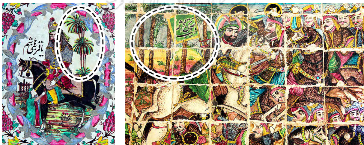
تصویر ۵: نقش درخت نخل در کاشی‌های تکیه «معاون الملک».

درخت از نمادهای مهم در ایران است و هر نوع از آن دارای سمبول و نمادهای مختلفی می‌باشد (سالمی‌فیه، ۱۳۸۷: ۴۷). درخت یکی از آفریده‌های شگفت‌انگیز خداوند است. در قرآن کریم وجود درختان به عنوان نشانه الهی مطرح می‌شود. از جمله درختانی که به طور خاص در قرآن به آن تاکید شده است درخت نخل خرما است، که بیست مرتبه در قرآن تکرار شده است (اخوت و همکاران، ۱۳۸۸: ۷۷). درخت نخل همیشه مستقیم و روبه بالا رشد می‌کند و برگ بی‌خزان و همیشه سبز آن باعث شده است تا در نظر بشر مظهر پیروزی باشد (کوپر، ۱۳۹۲: ۳۸۲). در کنار نقوش مذهبی کاشی‌های تکیه «معاون الملک» نیز درخت نخل ترسیم شده است. تصویر (۵) نمونه‌ای تصویر شده از درخت نخل را در