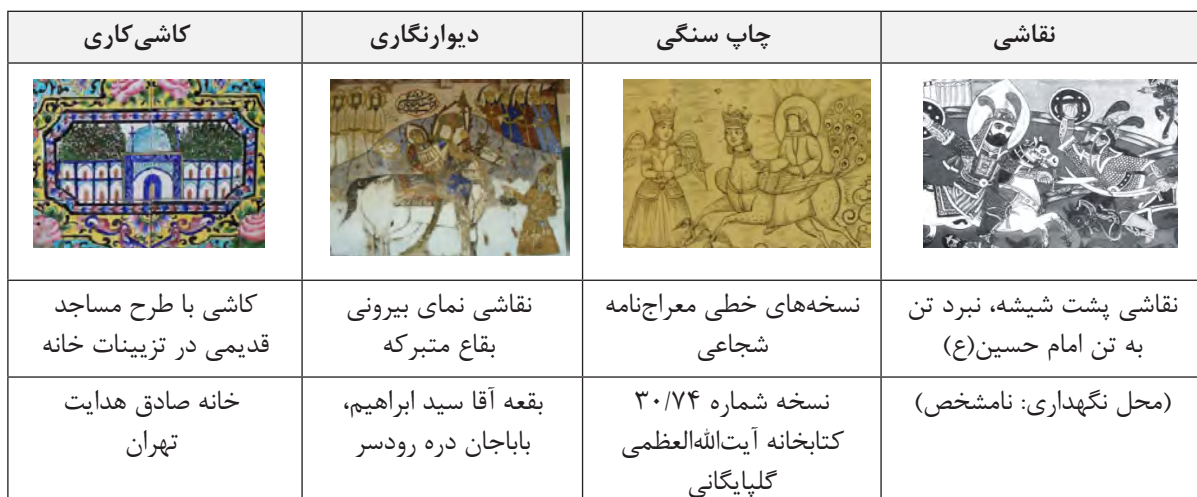
جدول ۱: استفاده از نقوش و مضامین مذهبی در هنرهای مختلف قاجاری.

نقوش تزیینی در فرهنگ و هنر ایرانی، اسلامی جایگاهی فراتر از زیبایی ظاهری دارند، اگر چه زیبا جلوه دادن آثار هنری خود یکی از شاخه‌های مهم هنر اسلامی است. این نقش‌ها از ارزش‌های والایی برخوردار است و در حقیقت ظاهر هر نقش در هنر اسلامی در آغاز، حکم دیدن یک معنای نادیدنی و باطنی است (خزائی، ۱۳۸۱: ۱۴۱). بی‌تردید، یکی از سنت‌های مهم شیعی، سوگواری برای امام حسین(ع) است. در دوره قاجار با توجه به این که «ناصرالدین‌شاه» سخت‌خود