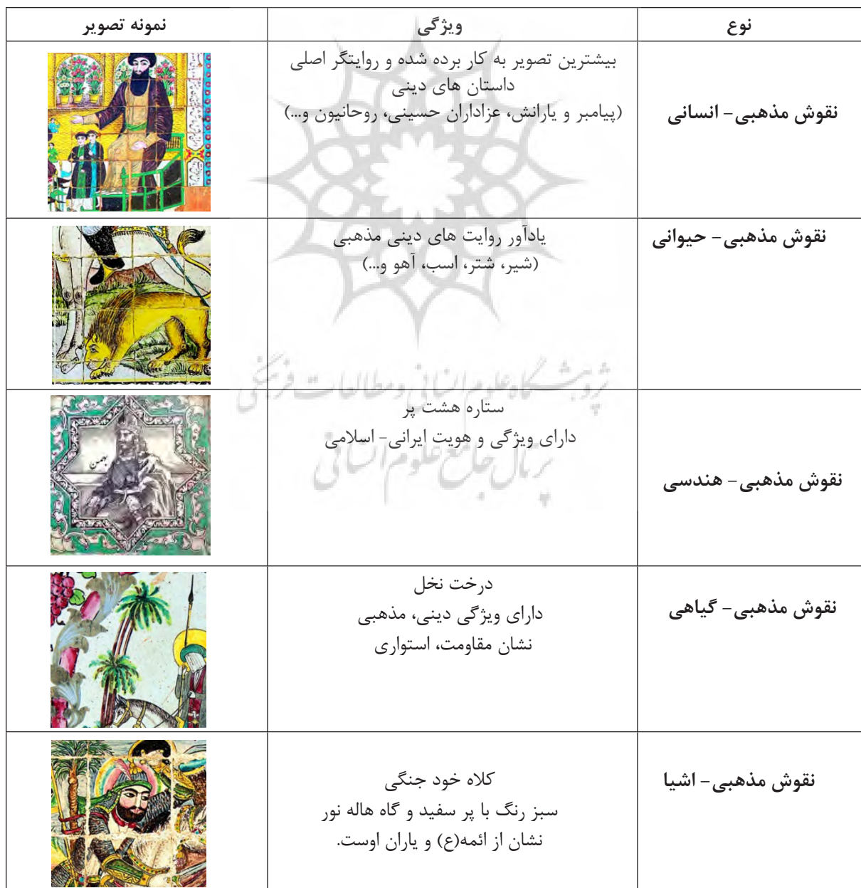
جدول ۳: انواع نقوش مذهبی در کاشی‌کاری تکیه «معاون الملک» (منبع: نگارندگان).

به طور کلی در دوره قاجار، دو صنعت، «چاپ» و «عکاسی» موجب تحوّل در هنر نقاشی ایران شده‌است که نقاشی به عنوان مادر تصویرسازی در دوره قاجار ویژگی و تاثیرات خود را در قالب‌های مختلف تصویری چون دیوارنگاری‌ها، کتب‌خطی، کاشی‌کاری و... به نمایش گذاشته‌است. در کاشی‌کاری تکیه «معاون الملک» نیز تمامی نقش‌های مذهبی به کار رفته به شیوه نقاشی قاجاری و هنرهای الهام گرفته از آن است. نقوش مذهبی در مضامین مختلف شکل گرفته‌است، که داستان‌های عاشورایی موضوع اصلی این نقش‌ها بوده‌است و در هر کدام