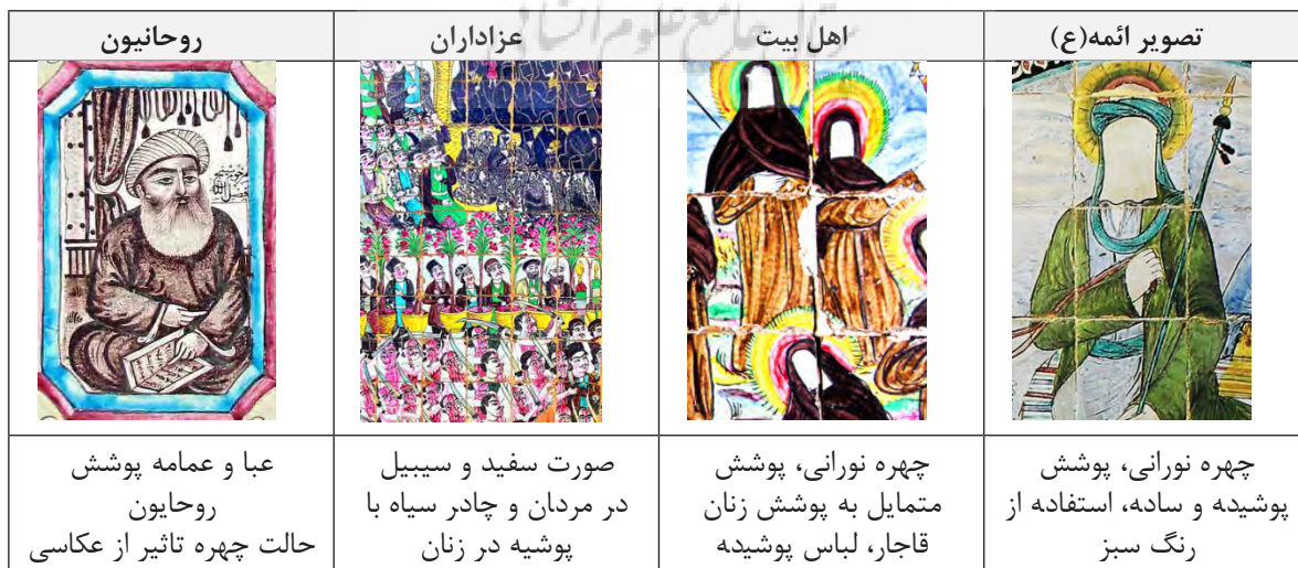
جدول ۴: انواع نقوش انسانی - مذهبی در کاشی کاری «تکیه معاون الملک».

در کاشی‌های تکیه «معاون الملک» بیشترین نقوش مذهبی را شخصیت‌های انسانی تشکیل می‌دهند، که شامل تصویر ائمه (ع)، یاران و خانواده امام، تصاویر مربوط به روحانیون و شخصیت‌های دینی و تصاویر عزاداران حسینی می‌باشد. انسان نماد کیهان، خرد و انعکاسی از کلان و جهان است. بدن او مظهر زمین و آتش است. خون او آب و نفس او هوا است. در اسلام انسان حاکی از موجودیت جهانی و پیوند میان خدا و طبیعت است (کوپر، ۱۳۹۲: ۴۴). رویکرد انسان مدارانه از گذشته‌های دور در نگارگری ایرانی همواره دیده شده‌است و رویکرد به زیباشناسی ناب هیچ‌گاه نقاشی ایرانی را از توجه به انسان و ارزش‌های بصری باز نداشته است (پاکباز، ۱۳۸۱: ۹). در دوره قاجار نیز رویکرد انسان مدارانه با نگرش جدید، بوی نویی می‌دهد، پیکره‌ها در عین حال که تداعی‌کننده فضاهای زندگی جدید و اشرافی هستند، نوعی بیان عاطفی و احساسات شاعرانه را نیز به همراه دارند (تهرانی، ۱۳۸۸: ۴).