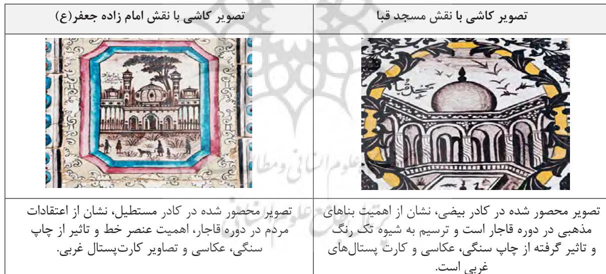
جدول ۶: نقش بناهای مذهبی در کاشی‌های تکیه «معاون الملک» (منبع: نگارندگان).

می‌رساند. بسیاری از این نقش‌ها به تنهایی می‌تواند روایتگر رویدادهای دینی، مذهبی باشد و یا با قرارگیری و ارتباط با دیگر نقوش تصویری، تکمیل کننده یک جریان مذهبی شود. پرچم‌ها، خیمه‌ها، قرآن و تسبیح، ردای سبز رنگ، عبا و عمامه روحانیون و دیگر نشان‌های تصویری که در تزیینات پوشش شخصیت‌های مذهبی نقش بسته است همگی دارای ویژگی