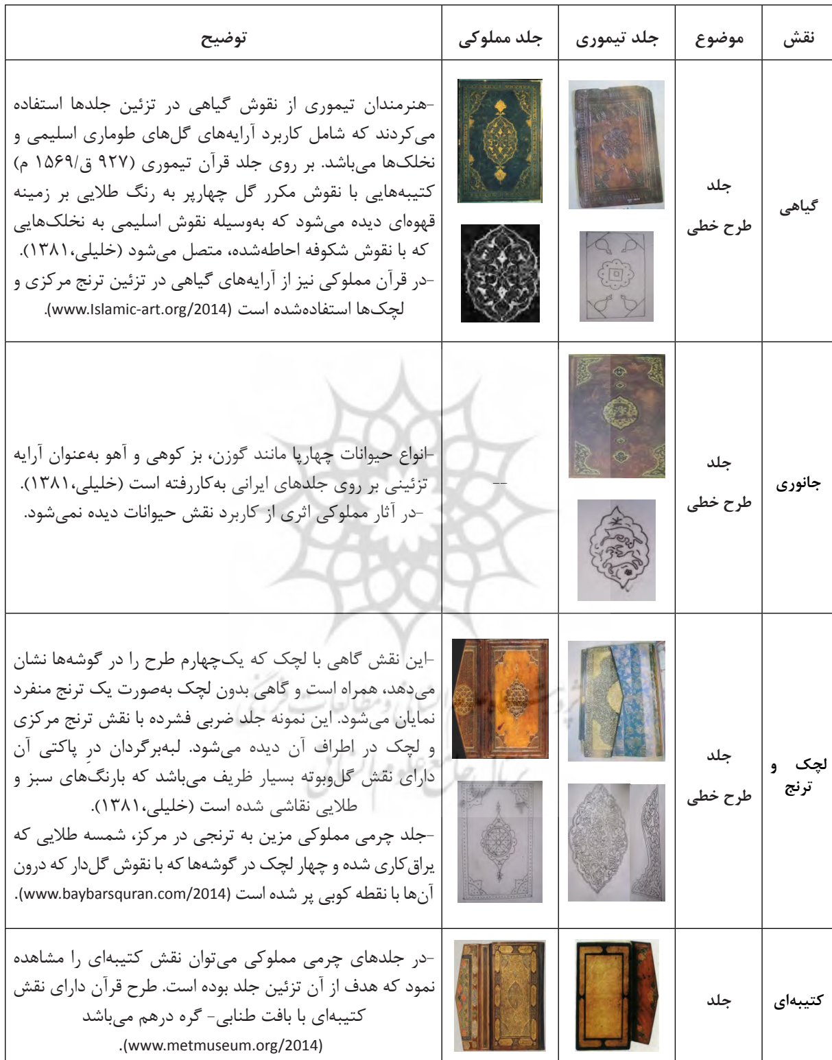
جدول ۲: نقوش تزئینی جلد‌های قرآن کریم دوره تیموری و مملوکی

در جدول ۳ نیز دسته‌بندی آرایه‌هایی که در تزئین قرآن‌های دوره تیموری و مملوکی به کاررفته است، دیده می‌شود.