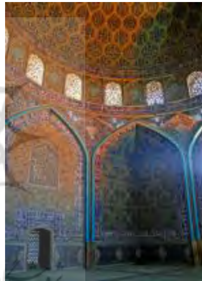
تصویر ۲: شبستان مسجد شیخ لطف الله.

فضا، که نخستین آن عقب نشستگی از میدان پیش از ورودی، دومی فضای داخلی دالان و سومی فضای خالی زیر گنبد یعنی همان شبستان است. در این سه فضا چرخش طواف ماندی در هر چهار جهت وجود دارد، در فضای خالی چهارگوش سر در ورودی وجود نقش و نگارها باعث توجه به جهات می‌شود. همچنین در فضای دوم یعنی دالان چرخش در چهار جهت باعث طواف به دور قبله می‌گردد و در فضای سوم یعنی فضای مکعب شبستان، نقش و نگارهایی در چهار جهت این جهات را یادآوری می‌کند که شاید فضای تهی در این مسجد همانند کعبه آدمی را به طواف در چهار جهت وامی‌دارد.