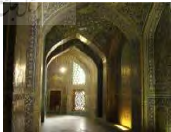
تصویر ۱: دالان مسجد شیخ لطف الله،

مدخل در معماری مبین حرکت، عبور و نخستین قدم برای سفر، و فضای دالان همان فضای انتقال، خلوت، حیرت، فضایی بی‌زمان است (توسلی، ۱۳۷۴: ۶۱). این دالان تاریک یا فضای انتقال، دنیای بیرون را از درون مسجد جدا و به این شکل زائر را آماده ورود به این مکان مقدس می‌نماید. تاریکی فضا سبب فراموشی شخص از دنیای بیرون و توجه به خداوند و احساس حضور او در این مکان است. این فضای مکث یا واسطه‌ای بین فضای بیرون و درون مسجد، همانند حجاب و یا پرده‌ای با ایجاد فاصله، دو فضا را از یکدیگر جدا می‌نماید. نور و تاریکی‌های منقطع فرصتی برای مکث، درنگ و اندیشه در اختیار زائران قرار می‌دهد (ستاری، ۱۳۸۷، ج. ۱: ۵۵۸).