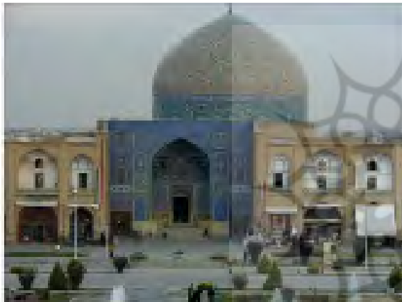
تصویر ۶: نمای بیرونی و گنبد مسجد شیخ لطف الله.

فرم هشت وجهی مساجد که سبب انتقال فضای چهارگوش به فضای کروی می‌شود، کنایه‌ای از عرش الهی است که هشت ملک حامل آن است. فقط به عنوان روشی برای استقرار گنبد نیست و گنبد نه تنها پوشش نبوده بلکه مظهر آسمان و نشانه عالم نامحدود و بی‌کرانه روح است (نصر، ۱۳۷۰: ۶۴). این هشت ضلعی که به صورت دو مربع متداخل است، بسط در گریو گنبد را نشان می‌دهد (معمارزاده، ۱۳۸۶: ۵۹).