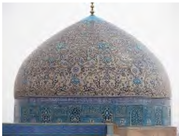
تصویر ۷: گنبد بیرون مسجد شیخ لطف الله.

در عرفان رهایی آدمی از مشغله‌های بیرونی، حسی و فراموشی خویشتن مقدمه‌ای است بر بسط و انشراح درون، که در نهایت، سبب از خود بیخودی و سرشاری او از خدا می‌گردد، این رهایی را تهی‌وارگی می‌گویند. تمامی بناهایی که در چنین فضای فکری ساخته شده، ناخودآگاه انعکاسی از آن را در خود دارند، به ویژه ساختمان بناهای مذهبی، یاری‌گر در دستیابی به چنین حسی هستند. براین اساس فضای تهی معنا می‌یابد؛ فضایی آرام، هماهنگ که سبب نشاط