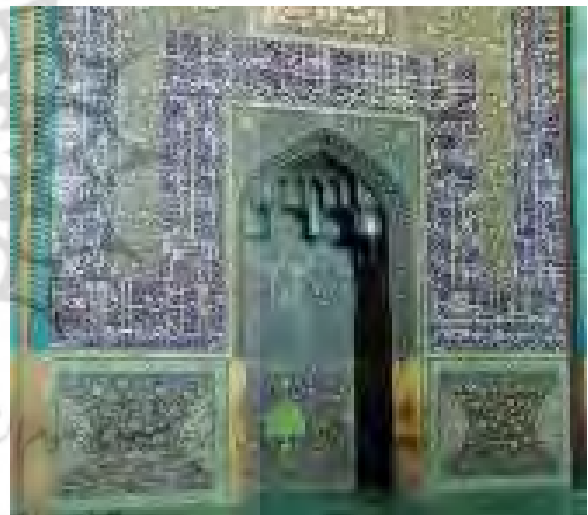
تصویر ۴: مقرنس‌های مسجد شیخ لطف‌الله.

موضوع علم کامل مقرنس ادغام مجدد کثرت در امر واحد و نشان وحدت زمان و مکان است (بورکهارت، ۱۳۸۶: ۱۱۳). در مسجد شیخ لطف‌الله تنها در دو محل یکی در ایوان ورودی و دیگری در درون محراب مقرنس وجود دارد. این مقرنس‌ها در محل پیوند دو قوس واقع در سقف، به یک نقطه مرکزی در زیر قوس می‌پیوندند. این نقش‌ها که به دور نقطه مرکزی تکرار می‌شوند، در سطح افقی و عمودی منتشر می‌شوند و بسط