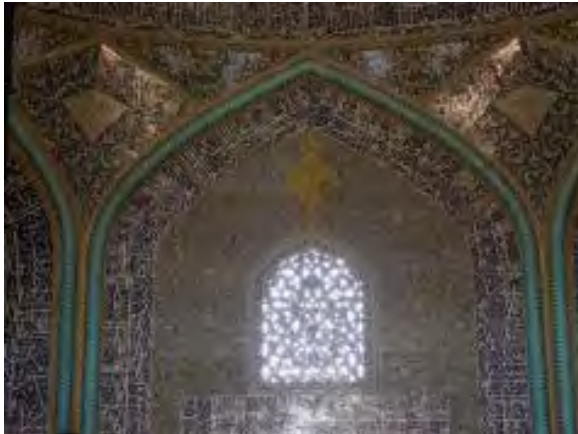
تصویر ۳: پنجره‌های شبستان .