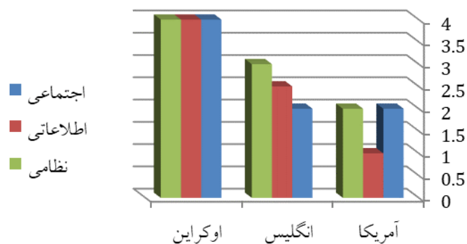
نمودار ۱: امکان مداخله روسیه در کشورهای هدف بر اساس آموزه‌های جنگ هیبریدی