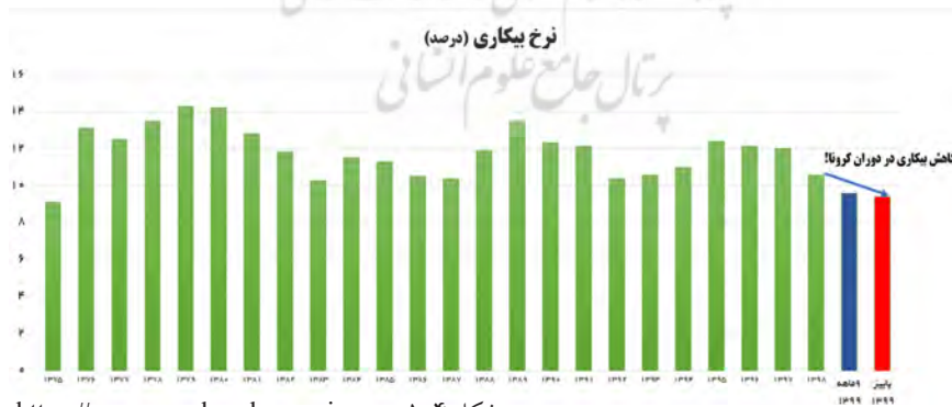
شکل ۴-۱: نمودار مربوط به نرخ بیکاری در دولت‌های پس از انقلاب

شکل ۴-۱: