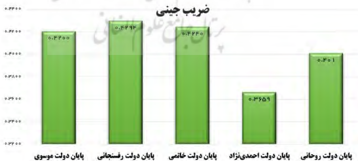
شکل ۱-۶: ضریب جینی در دولتهای پس از انقلاب

شکل ۱-۶: