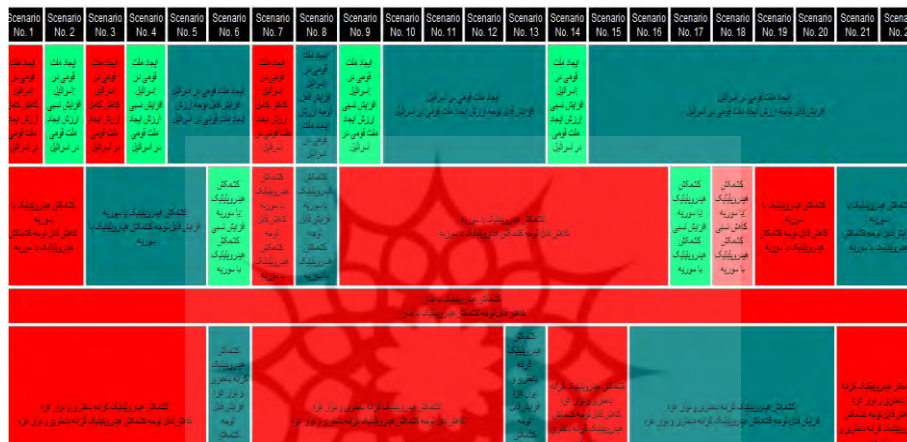
شکل ۳. تخته سناریوهای با سازگاری قوی قلمروگستری سیاست خارجی هیدروپلیتیک‌محور اسرائیل