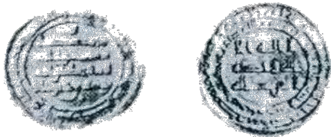
تصاویر سکه‌های ساجیان

(تاریخ ایران کمبریج - مایلز، ۴/ تصویر ۲۷، ش ۱)