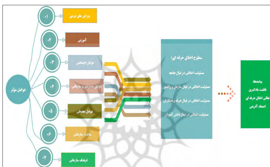
شکل ۱- مدل زمینه‌ای اخلاق حرفه‌ای دبیران تربیت‌بدنی

پژوهشگاه علوم انسانی و مطالعات فرهنگی پرتال جامع علوم انسانی