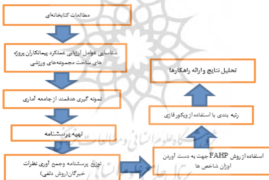
شکل ۱- گام‌های تحقیق (نگارنده، ۱۳۹۷)

در مرحله دوم شاخص‌های شناسایی شده با استفاده از روش دلفی و بر مبنای نظر خبرگان تأیید شدند. سپس وزن هر یک از معیارهای روش ویکور (ابعاد کارت امتیازی متوازن) با استفاده از روش ای‌اچ‌پی ۱ فازی و بر مبنای نظر مدیران و کارشناسان عمرانی و پیمانکاران پروژه‌های ساخت مجموعه‌های ورزشی تهران تعیین شد و به‌عنوان ورودی روش ویکور فازی در نظر گرفته شد. پس از آن پرسشنامه روش ویکور فازی متناظر با مؤلفه‌های شناسایی شده و ابعاد کارت امتیازی متوازن طراحی شد و توسط مدیران و کارشناسان و پیمانکاران پروژه‌های ساخت مجموعه‌های ورزشی تکمیل شد. داده‌های پرسشنامه پر شده توسط خبرگان وارد برنامه متلب شد. در نهایت با توجه به خروجی نرم‌افزار، وزن و رتبه هر یک از مؤلفه‌ها مشخص شد. با توجه به نتایج حاصل، معیارهای تجربه و عملکرد پیشین پیمانکار و همچنین آمادگی مدیران در روبه‌رویی با شرایط بحرانی پروژه، مهم‌ترین عوامل تعیین شدند.