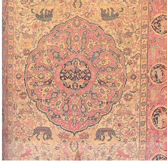
تصویر ۳: قالی سانگشکو، کرمان، دوره صفوی، موزه لوگانو، (ماخذ: آروین، ۱۳۶۱: ۱۳۶)