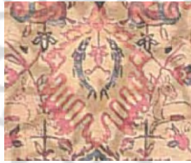
تصویر ۴: تصویر قالی درهم در فرش سانگشکو.

بنابراین باید گفت طرح ماهی درهم با تغییراتی ظاهری در دوره صفوی بسیار پر کاربرد گردید. در تصویر شماره ۵ نمونه‌ای از طرح ماهی درهم قابل مشاهده است و دقیقاً دو فرم برگ مانند همراه با گلی در میان آن قابل رؤیت است.