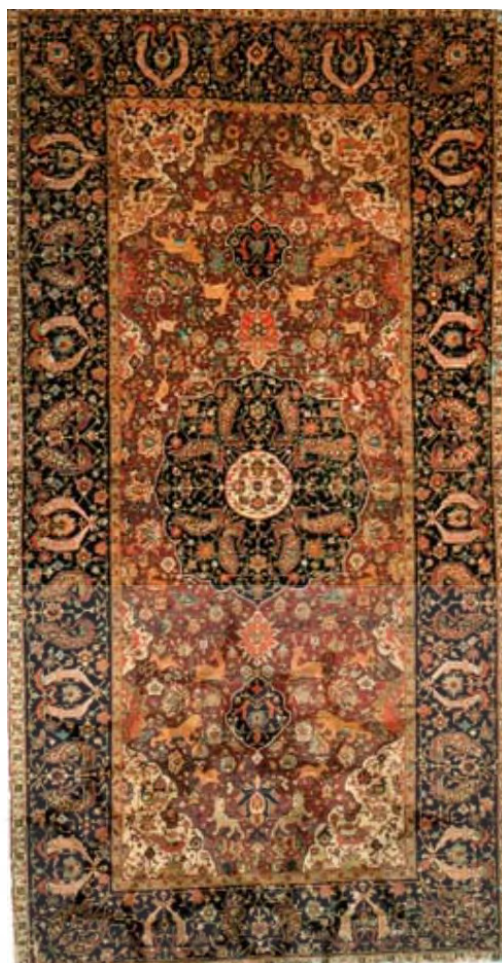
تصوی ۷: قالی با نقش حیوانات مربوط به دوره صفویه. قرن دهم از تبریز.

در این فرش نیز ماهی درهم در مرکز و حاشیه‌های فرش به صورت قرینه انعکاسی وجود دارد. نقش مایه اصلی طرح «ماهی درهم» در فرش، طرح لوزی منقش به گل و پره‌های چرخ و فلکی است که در چهار طرف قرار دارند و اساس این طرح از آیین میترائیسم سرچشمه گرفته است (حصوری، ۱۳۸۵: ۴۳). نقش ماهی درهم یا طرح هراتی یکی از رایج‌ترین نقشه‌های قالی‌بافی ایران است که از اواخر دوره صفوی رایج شده است و در مناطق جغرافیایی چون خراسان، آذربایجان و کردستان و فراهان به شیوه‌های گوناگون بافته می‌شد. نقش مایه اصلی این طرح سرتاسری چهارنگاره از برگ مانند شکل ماهی است که در چهار سمت یک نگاره لوزی منقوش به یک گل و پره‌های چرخ فلکی است. طرح ماهی سرتاسری ماهی درهم از تکرار نقش مایه اصلی و به هم پیوستن آن‌ها به وجود می‌آید و معمولاً در بالا و پایین هر چرخ فلک یک نگاره شیوه یافته‌ای که از خانواده نقش مایه‌های نیلوفر آبی یا نخل است قرار می‌گیرد. به احتمال زیاد این نقش را قشقایی‌ها پس از کوچیدن اجباری به خراسان به فرمان نادرشاه انجام داده‌اند و به فارس منتقل کرده‌اند. طرح ماهی درهم در نقاط مختلف ایرن به نام‌های مختلفی مشهور است و مهم‌ترین آن‌ها ماهی هراتی، ماهی فراهان، ماهی زنبوری، ماهی کردستان و ریزه ماهی است (ژوله، ۱۳۸۱: ۲۲).