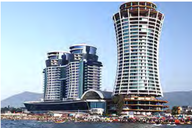
تصویر ۱. مرکز خرید الماس قو، متل قو، مازندران، تأثیرات الگوی جهانی بر معماری مراکز تجاری. مأخذ: https://mehavaransanat.com/wp-content/uploads/2021/04/ghoo2-450x450.jpg