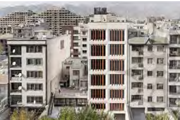
تصویر ۲. تصویری از تهران، تأثیر جهانی شدن بر معماری مسکن در ایران.