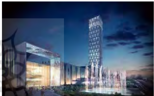
تصویر ۵. مرکز خرید ایران مال در تهران، تأثیرات الگوی جهانی بر معماری مراکز تجاری.

بیانگر طبقه جدیدی از مشکلات است که توانایی ما در دستیابی به توسعه پایدار را به شدت به چالش می‌کشد (Idemery, 2009). در اواخر قرن بیستم، موجی از سبک‌های معماری ظهور کرد که عصر جهانی‌شدن را منعکس می‌کند. طبق گفته لوئیس معماران اروپایی و آمریکایی علیه کلاسیسیسم قیام کردند و خواستار رژیم جدیدی برای تصویب طرح‌های بین‌المللی با نظم جدید صنعتی، فناوری، اجتماعی و سیاسی شدند. از این رو، سبک مدرنیستی ظهور کرد (Lewis, 2002). سبک معماری جهانی براساس سبک کلاسیک جهانی پیروز شد. معماران جهانی استدلال می‌کنند که ساختمان‌های سبک در دوران مدرن از نمونه‌های کلاسیک از سازنده، مدرنیست و استعمار خود پیشی می‌گیرند، زیرا بیان بومی را تسهیل می‌کند و به الهامات منطقه‌ای و زیبایی‌شناسی اجازه می‌دهد تا در طرح‌ها ادغام شوند (Umbach & Bernd, 2005). «آنتونی دی. کینگ» معتقد است شیوه‌های تولید و ایدئولوژی‌ها، یا سوسیالیسم، به عنوان تأثیر عمده‌ای بر هویت معماری، جایگزین دولت ملی شده‌اند. مجموعه‌ای از تحولات، ماهیت تولید معماری را جهانی کرده است (King, 2004, 40). نظراتی تأثیرات جهانی‌شدن بر معماری را مثبت می‌دانند. باید این