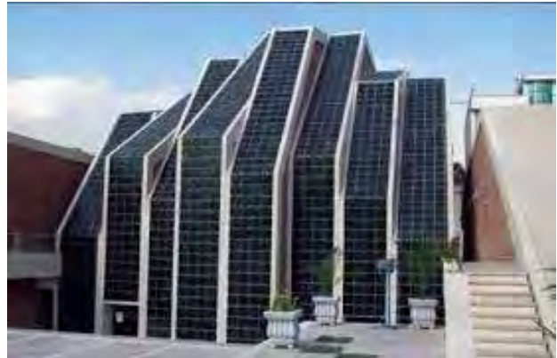
تصویر ۴. مسجدی در تهران، خیابان انقلاب، تأثیرات الگوی جهانی بر معماری مذهبی در ایران.