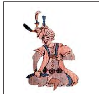
تصویر ۵. شاه در قالی بوستون، مربوط به تصویر ۲

جدول ۱. تحلیل نقوش بکار رفته در حاشیه قالی‌های وین و بوستون. مربوط به تصاویر ۲ و ۳، مأخذ: نگارندگان.