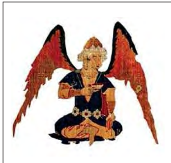
تصویر ۶. شاه در قالی وین، مربوط به تصویر ۴