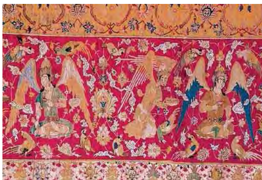
تصویر ۱۴. حاشیه قالی شکارگاه موجود در موزه وین (شاه) در بهشت و در حال پذیرایی توسط فرشتگان)

الحمد لله و المنة از آن تاریخ که سعادت میسر شده از کل مملکت من الفسق و فجور بر طرف شده تعالی فتوحات گوناگون روی نموده، به طریقی که هرگز در خاطر ما شمه‌ای از آن نمی‌رسید.»