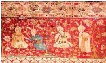
تصویر ۳: حاشیه قالی شکارگاه موزه بوستون