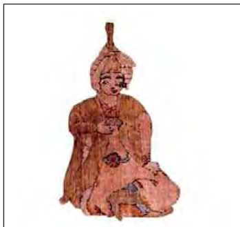
تصویر ۷. یکی از همراهان شاه در قالی بوستون، مربوط به تصویر ۳