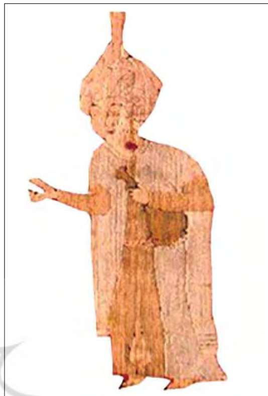
تصویر ۱۰. یکی از ملازمان شاه در قالی بوستون، مربوط به تصویر ۳