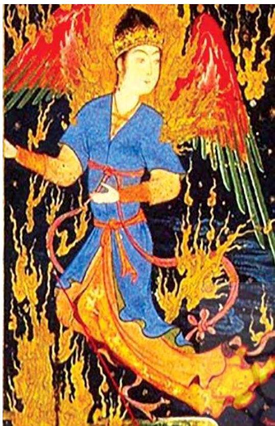
تصویر ۹. یکی از فرشتگان در تابلوی معراج حضرت محمد