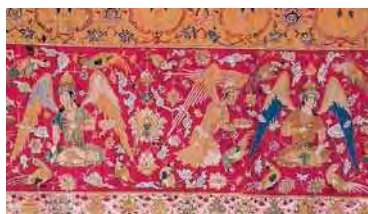
تصویر ۴: حاشیه قالی شکارگاه در موزه وین

حاشیه قالی شکارگاه موزه هنری بوستون که در زمان شاه طهماسب اول بافته شده است. و طراحان آن سلطان محمد و احتمالاً آقا میرک بوده‌اند. در تصویر مقابل حاشیه پهنی دیده می‌شود. که درون آن با نقوش خوانین و پادشاه در حال استراحت و خدمتکاران در حال پذیرایی از آن‌ها دیده می‌شوند. درختچه‌ها و بوته‌های گل، زمینه لاک‌ی حاشیه را تزیین کرده‌اند. حاشیه باریک درونی ترکیبی از نقوش اسلیمی ختایی دارد و حاشیه باریک بیرونی با نقش ختایی تزیین شده است. نقش پرندگان در این حاشیه در کنار چرخش ساقه‌های ختایی به چشم می‌خورد. (بصام، ۱۳۸۳: ۵۳) که در مجموع از لحاظ بصیری هارمونی و هماهنگی زیبایی ایجاد کرده است و برای بیننده بسیار لذت‌بخش است.