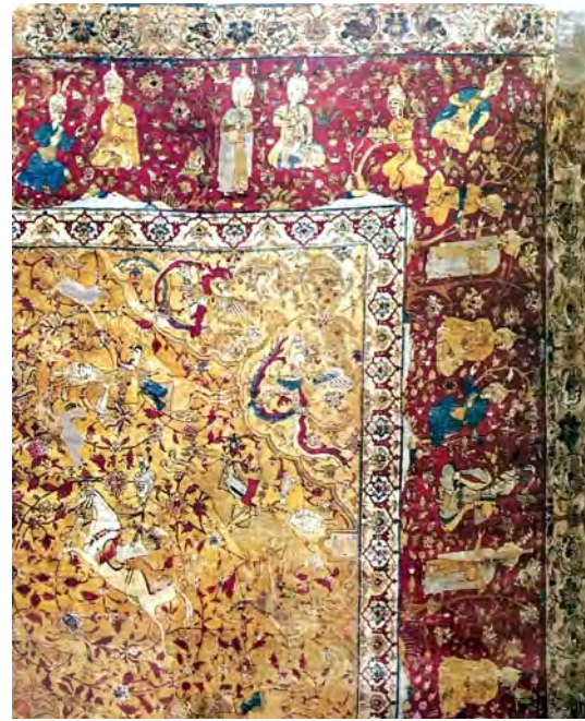
تصویر ۱. قالی موجود در موزه بوستون، مأخذ: بصام، ۱۳۸۳: ۵۱.