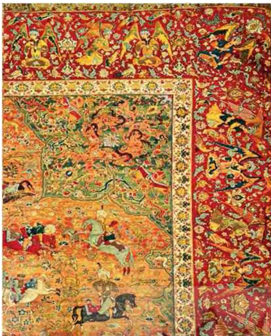
تصویر ۲. تصویر قالی موجود در موزه وین، مأخذ: ملول، ۱۳۸۴ : ۲۸۱.