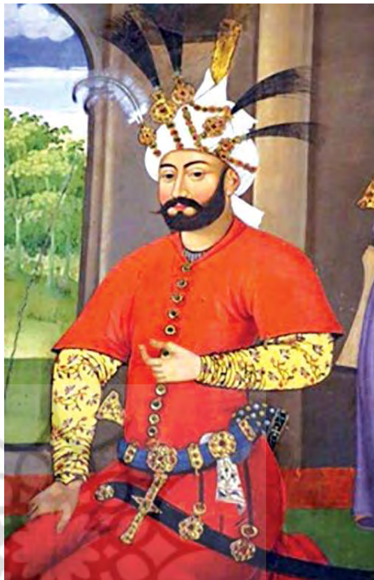
تصویر ۸. شاه طهماسب بر روی دیوار نگارهٔ چهل‌ستون