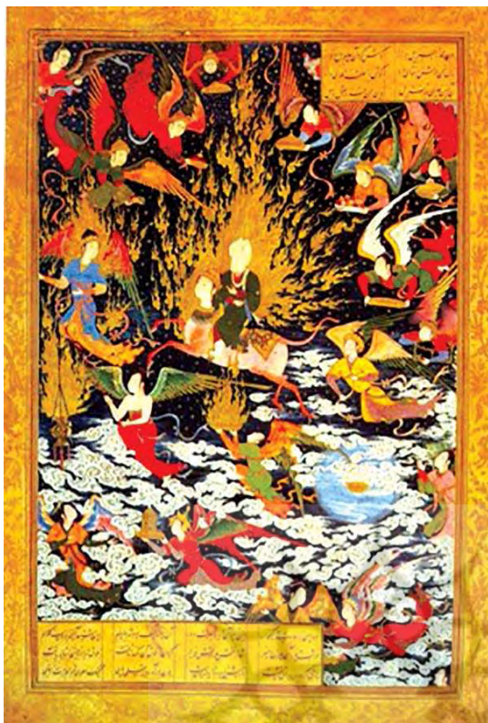
تصویر ۱۱. معراج حضرت محمد (ص)