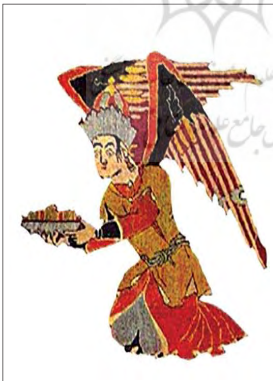
تصویر ۱۳. تصویر فرشته در قالی وین، مربوط به تصویر ۴