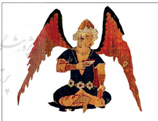
تصویر ۱۲. تصویر شاه در قالی وین، مربوط به تصویر ۴

طبق جدول فوق و تطبیق آیات حاوی ویژگی‌های بهشتی با تصویر ایجادشده توسط طراح قالی شکارگاه وین، می‌توان گفت طراح قالی با اشراف بر نشانه‌های ذکرشده در قرآن از بهشت، به طراحی این قالی پرداخته است و با پرداختن به جزئیات و تصویرسازی حاشیه قالی فضای بهشتی را ترسیم کرده است.