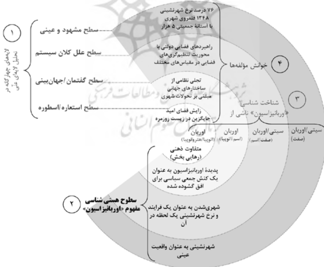
تصویر ۳. دورنمای نظری مفهوم «اوربانیزاسیون» در لایه‌های CLA در ایران.

در سطح چهارم استعاره‌های مربوط به «اوربانیزاسیون» در ایران مورد تأکید قرار گرفته است. هستی‌شناسی مورد تأکید در این سطح ماهیتی ذهنی دارد. شناخت‌شناسی آن نیز برگرفته از اوربان (اتوپیا و هتروتوپیا) است. در این