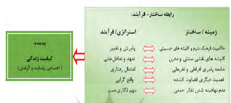
شکل ۱. مدل مفهومی کیفیت

متمرکز و کسب مقولات عمده انجام شد. این کدگذاری به صورتی است که در هر مرحله، داده‌ها بر حسب شباهت و تفاوت‌هایشان کنار یکدیگر قرار می‌گیرند؛ لذا در هر مرحله به سطح انتزاع داده‌ها اضافه و از حجم و تعداد آنها کاسته می‌شود. در مرحله کدگذاری محوری، پدیده اصلی پژوهش یعنی کیفیت زناشویی با توجه به دو محور اصلی یعنی زمینه (ساختار) و استراتژی (فرایند) مورد تحلیل قرار گرفت. مدل مفهومی پژوهش در شکل ۱ به تصویر کشیده شده است که در ادامه جزئیات آن تشریح می‌گردد.