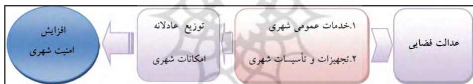
شکل ۱. امنیت شهری و توزیع عادلانه امکانات شهری (زیویار و درودی، ۱۳۹۴: ۵)

این عقیده‌اند که با دستکاری فضاها و تلطیف آن، می‌توان احساس امنیت را در افراد افزایش داد (صالحی، ۱۳۹۰: ۱۱۲-۱۱۳). یک فضای شهری مناسب تا حد زیادی تأمین‌کننده امنیت و فضای نامناسب، از بین برنده آن و زمینه‌ساز انواع آسیب‌ها و معضلات اجتماعی است. فضاهای نامناسب شهری، فضاهای بی‌دفاع و محلات ناامن، از عوامل تهدیدکننده امنیت شهری و اجتماعی هستند. (زیویار و درودی، ۱۳۹۴: ۴). بیشتر جرم‌ها وقتی اتفاق می‌افتد که مرتکب، فرصت را مناسب می‌بیند. این مهم به این دلیل است که معماری بعضی از شهرها، فرصت ارتکاب جرم را برای مرتکبان افزایش می‌دهد (مشهدی‌نفرشی، ۱۳۹۳: ۱۲۱). عدالت فضایی در سطح شهر نیز مبین چگونگی امنیت شهر و شهروندان است، خدمات عمومی شهر و تجهیزات و تأسیسات شهری متفاوت باعث افزایش یا کاهش امنیت شهری می‌شود. به‌طور کلی نحوه توزیع امکانات رفاهی در سطح فضای شهری و حس امنیت، ارتباط مستقیمی با فضا و کیفیت و کمیت محیط شهری دارد (زیویار و درودی، ۱۳۹۴: ۴).