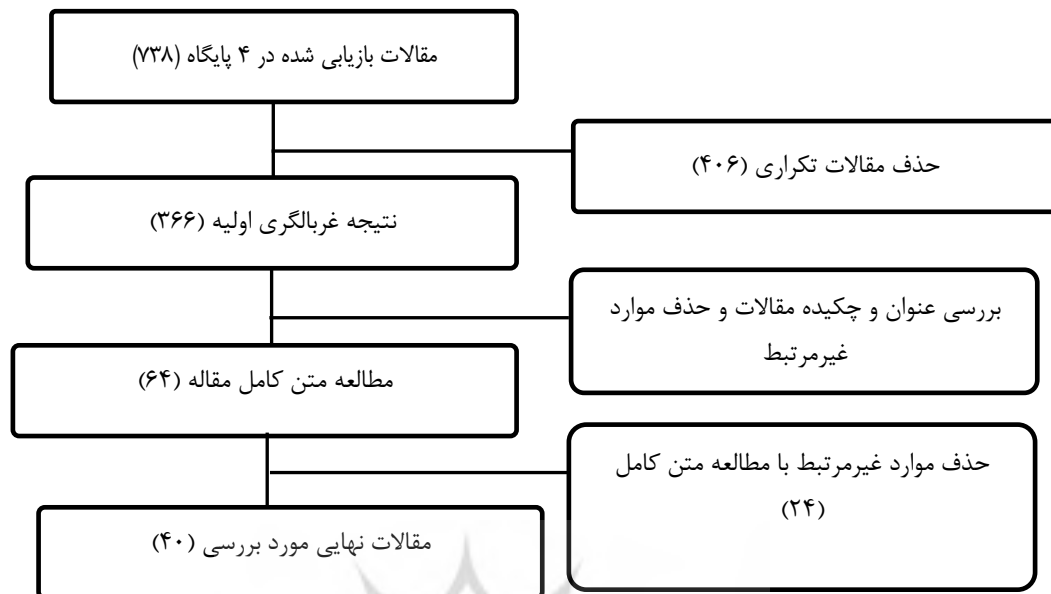
شکل ۱. فرایند انتخاب مقالات برای تحلیل محتوا

در پژوهش حاضر، ابتدا تمام شاخص‌ها/الزامات استخراج شده از مطالعات به عنوان کد (مؤلفه) در نظر گرفته شد. سپس بر اساس شباهت میان کدها، در یک مفهوم (بعد) دسته‌بندی گردید. در مجموع در ۴۰ مدرک مورد بررسی، ۱۹۷ شاخص شناسایی گردید که در هفت گروه شامل برنامه‌ریزی و بودجه (۲۱)، تبلیغ و توسعه خدمات (۸)، دسترس‌پذیری و ساختار فیزیکی (۵۹)، خدمات و برنامه‌ها (۵۸)، منابع انسانی (۱۷)، مجموعه (۱۱)، تجهیزات و فناوری اطلاعات (۲۳) دسته‌بندی گردید. با توجه به تعداد زیاد شاخص‌ها، در این مطالعه، تنها شاخص‌هایی که حداقل در دو منبع ذکر شده بودند، آورده شد.