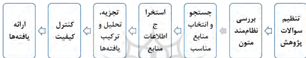
شکل ۱. الگوی هفت مرحله‌ای فراترکیب (اقتباس از سندلوسکی و باروسو، ۲۰۰۷)

در گام نخست با استفاده از روش فراترکیب مقوله‌های رقابت‌پذیری با تاکید بر آموزش سرمایه‌های انسانی در صنعت بانکداری کشور شناسایی شده است. فراترکیب یکی از روش‌های فرامطالعه است که به ارزیابی سایر پژوهش‌های انجام شده می‌پردازد و از این منظر با عنوان ارزشیابی ارزشیابی‌ها از آن یاد می‌شود. بطور کلی روش فراترکیب نوعی مطالعه کیفی است که از اطلاعات یافته‌های مستخرج از مطالعات دیگر در زمینه موضوع مرتبط، استفاده می‌کند. پژوهشگر در روش فراترکیب، داده‌های ثانویه نتایج حاصل از سایر مطالعه‌ها را برای پاسخگویی به نتایج مطالعه خود باهم ترکیب نموده و نتایج جدیدی بدست می‌آورد (Tulai, 2018, Jalali, Khaledi, 2019). برای دستیابی به هدف پژوهش از روش فراترکیب، مطابق از الگوی Sandelowski, Barroso (2006) استفاده شد.