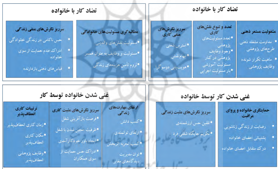
شکل ۱. الگوی ابعاد و مؤلفه‌های مفهوم مناسبات کار و خانواده (ابراهیمی، ۱۳۹۹)

احصای ابعاد و مؤلفه‌های مناسبات کار و خانواده از نمونه‌گیری قضاوتی سهمیه‌ای استفاده شد. منظور از نمونه‌گیری سهمیه‌ای این بود که از هر پژوهشکده متناسب با تعداد اعضای آن، نمونه برای مصاحبه انتخاب شد و نمونه‌گیری تا حد اشباع داده‌ها ادامه یافت. منظور از نمونه‌گیری قضاوتی این بود که تلاش شد در نمونه انتخاب شده اعضای دارای ویژگی‌های جمعیت‌شناختی مختلف گنجانده شوند. چارچوب کلی سؤالات با توجه به مرور ادبیات تحقیق تعیین شده و سپس اقدام به برگزاری مصاحبه با افراد نمونه شد. از میان ۱۸ نفر از اعضای هیئت علمی که مورد مصاحبه قرار گرفتند، ۱۰ نفر زن و ۸ نفر مرد بودند. ۱۷ نفر متأهل و از این تعداد، ۷ نفر دارای فرزند بودند. ۱۳ نفر استادیار و مابقی دانشیار بودند. به علاوه، از این میان، ۵ نفر پست‌های اجرایی نیز داشتند. تحلیل داده‌ها در این مرحله با استفاده از روش کیفی تحلیل تم انجام شد و ابعاد و مؤلفه‌های این مفهوم به شرح الگوی شکل (۱) استخراج شدند. ۱