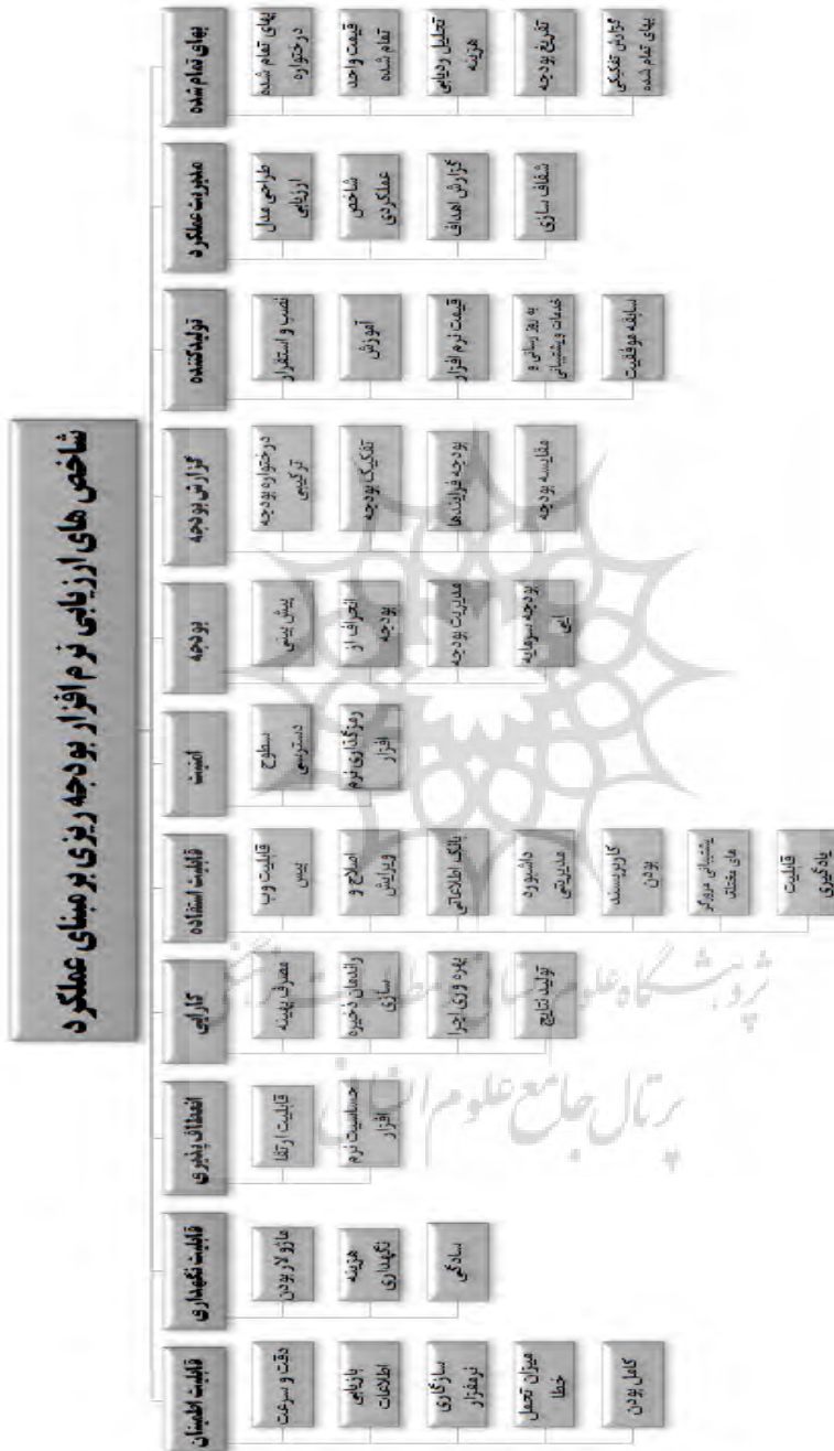
شکل : مدل مفهومی پژوهش