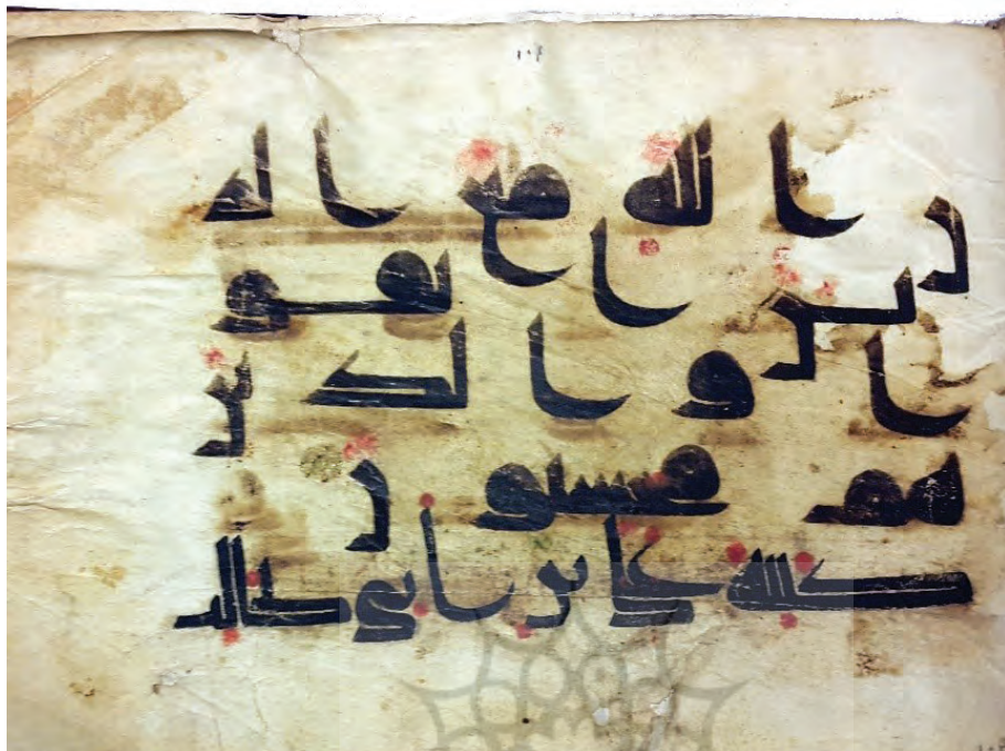
تصویر ۳: انجامه افزوده شده در انتهای نسخه ۴۳۱۷ موزه ملی ایران: «کتبه علی بن ابی طالب»