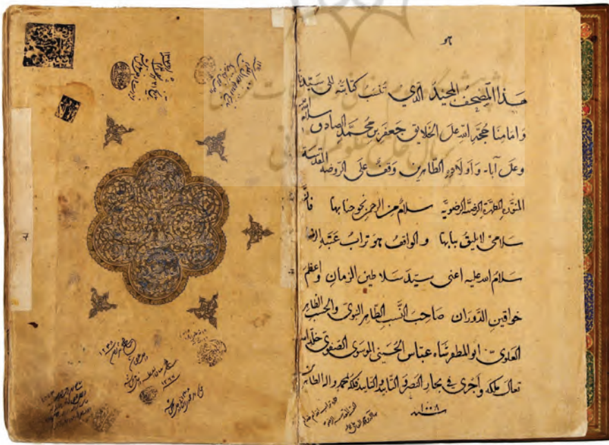
تصویر ۲۳: متن وقف نامه شاه عباس صفوی در آغاز قرآن ش ۱۷ آستان قدس رضوی به خط شیخ بهایی در سال ۱۰۰۸ قمری، وانتساب نسخه به امام صادق علیه السلام