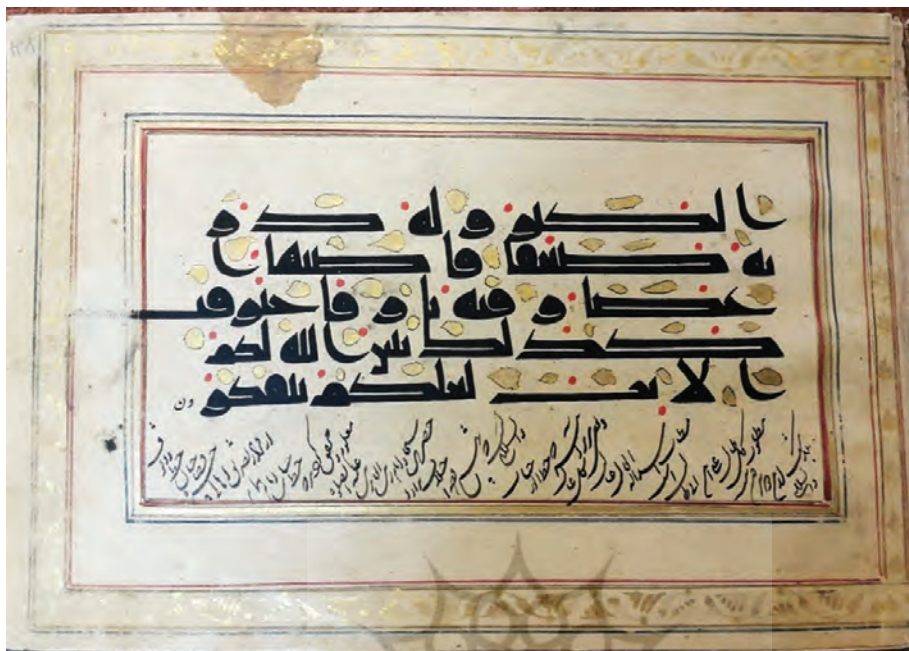
تصویر ۷: نسخه ش ۱۰۴۵ در موزه کاخ گلستان؛ «از قرار تصدیق اهالی خیره و صاحبان خط و وقوف معلوم گردید که خط جناب امام همام حضرت سجاد امام زین العابدین علیه الصلوة والسلام است که بهیچوجه اختلاف ندارد. بعضی نیز بر آنند که خط انور جناب مستطاب اسدالله غالب مطلوب کل طالب علی بن ابيطالب است. بلاشک از این دو بیرون نیست.»