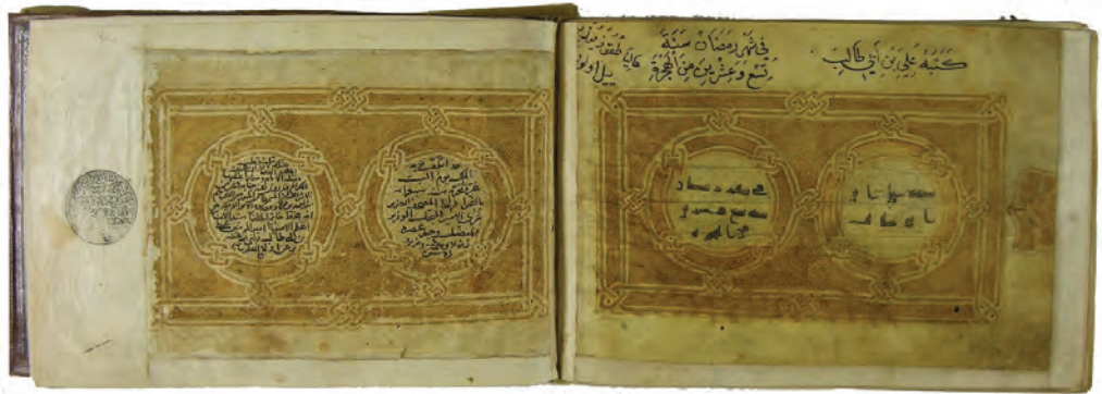
تصویر ۱۳: نسخه ش A2 در موزه تویقایی؛ «کتبه علی بن ابی طالب فی شهر رمضان سنة تسع و عشرين من الهجرة»