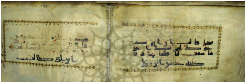
تصویر ۱۴: «کتبه حسن ابن علی بن ابی طالب» اضافه شده در انتهای نسخه قرآن ش ۴۲۴۷، موزه ملی ایران