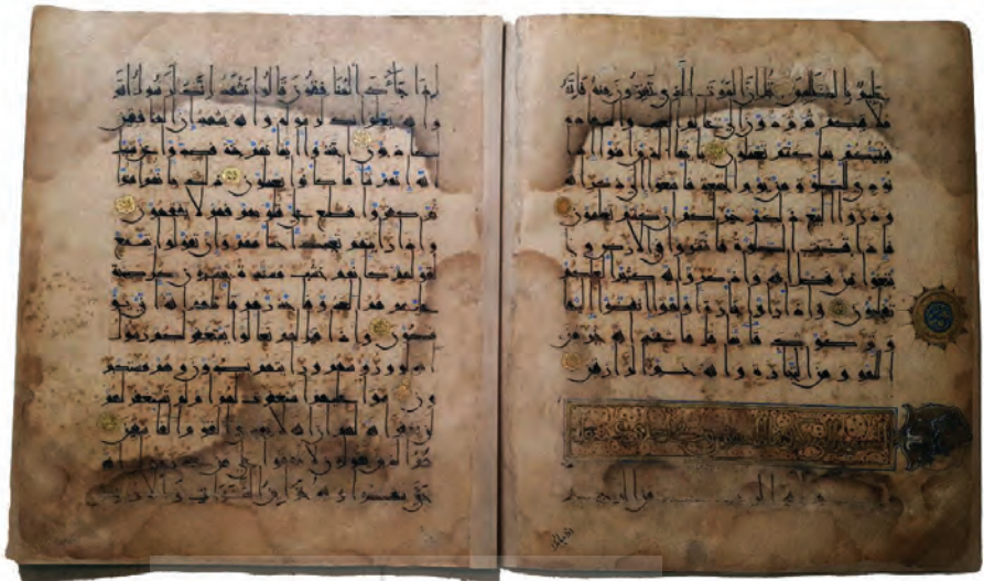
تصویر ۳۰: قرآن به خط کوفی مشرقی از قرن پنجم هجری، منسوب به دستخط خلیفه سوم، عثمان بن عفان در روستای نیگل (کردستان، ایران)