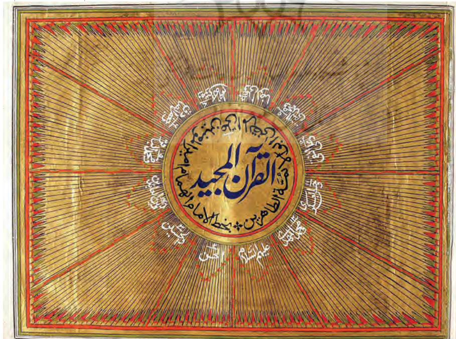
تصویر ۸: نسخه ش ۱ در کتابخانه رضا (رامپور، هند)؛ برگ نخست از قرآن منسوب به خط امام علی علیه السلام