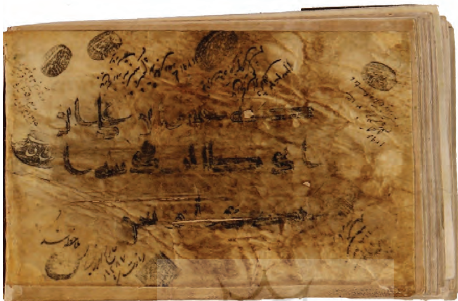
تصویر ۳۲: اضافه شدن نام «علی بن ابی طالب» به صورت عمودی در انتهای آیه ۱۷۰ سوره اعراف در نسخه قرآن ش ۱۰ کتابخانه آستان قدس رضوی