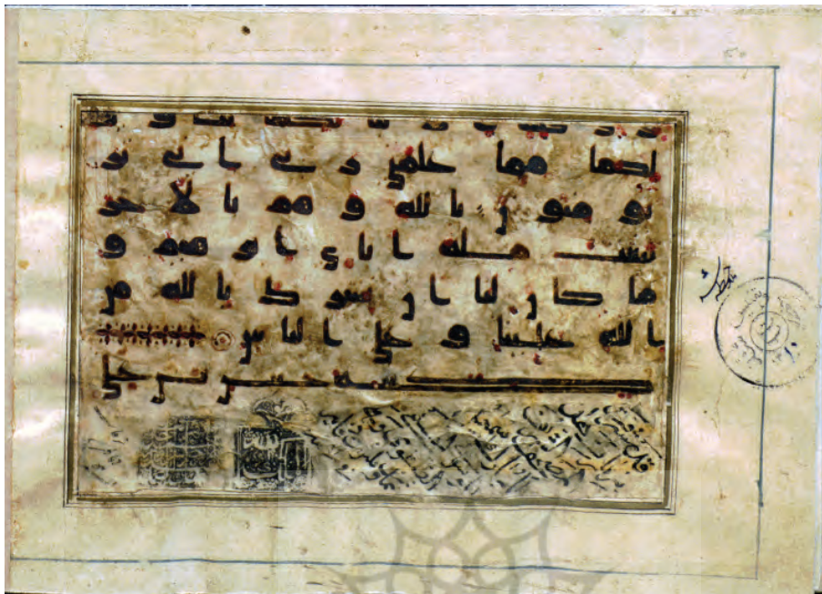
تصویر ۱۱: امضای منسوب به امام حسن مجتبی علیه السلام در میانه آیه ۳۸ سوره یوسف، همراه با تشرف منسوب به شاه اسماعیل؛ نسخه ش ۱۰ در کتابخانه و موزه ملک