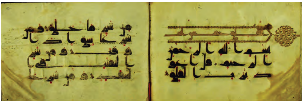
تصویر ۱۷: نمونه‌ای از خط کوفی در نسخه ش ۷۵۵ در موزه توپقاپی منسوب به خط امام علی علیه السلام

پژوهشگاه علوم انسانی و مطالعات فرهنگی پرتال جامع علوم انسانی