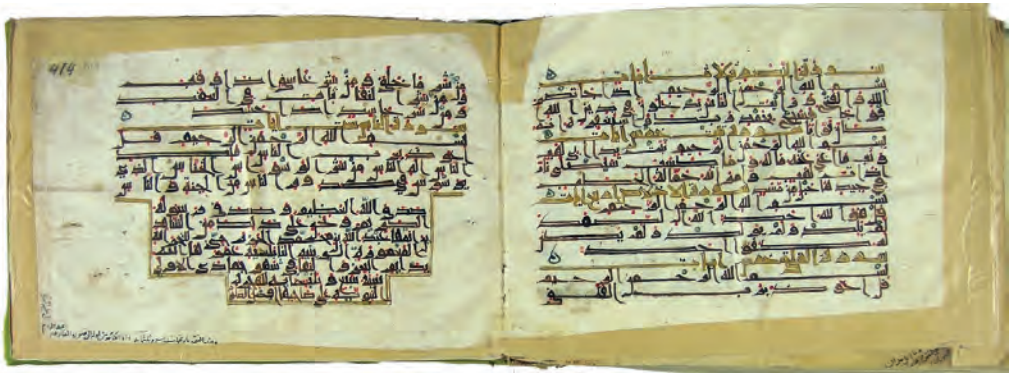
تصویر ۲۰: انجامه پایانی نسخه EH2 در موزه تویقایی به خط عبداللہ بن محمد الخزرجی؛ «وهذه التتمة تاریخها سبع وثلثمائة وأما الكتابة من أوله إلى سورة القارعة بخط الامام علی علیه السلام»