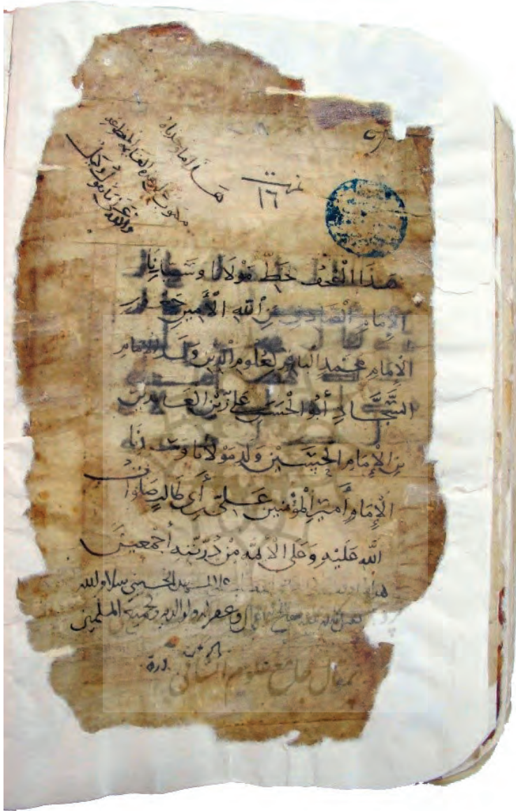
تصویر ۲۶: وقف نامه و انجامه قرآن کوفی به شماره «مصاحف ۱» در دارالکتب المصریة منسوب به خط امام صادق علیه السلام: «هذا ما وجدناه | مكتوب على هذه القايمه المقطوعة | والله على ما نقول وكيل | هذا المصحف خط مولانا وسيدنا | الإمام الصادق عن الله الأمين جعفر بن | الإمام محمد الباقر لعلوم الدين ولد الإمام | السجاد أبو الحسن على زين العابدين | بن الإمام الحسين ولد مولانا وسيدنا | الإمام أمير المؤمنين على بن أبي طالب صلوات | الله عليه وعلى الأئمة من ذريته أجمعين»