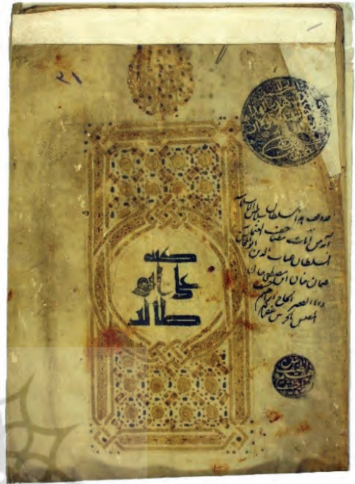
تصویر ۱۸: «کتابه علی ابی طالب»؛ انتساب خط کوفی در نسخه Y755 در موزه تویقایی به خط امام علی علیه السلام تصویر ۱۹: «خط امیرالمؤمنین علی ابن ابی طالب کرم الله وجهه ورضی الله تعالی عنه لا شبهة فيه أبدا صحیح»؛ نسخه ش Y755 در موزه تویقایی