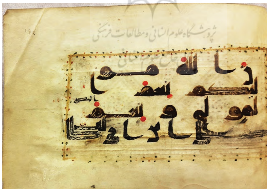
تصویر ۴: انجامه افزوده شده در انتهای نسخه ۴۲۴۸ موزه ملی ایران: «کتبه علی بن ابی طالب»