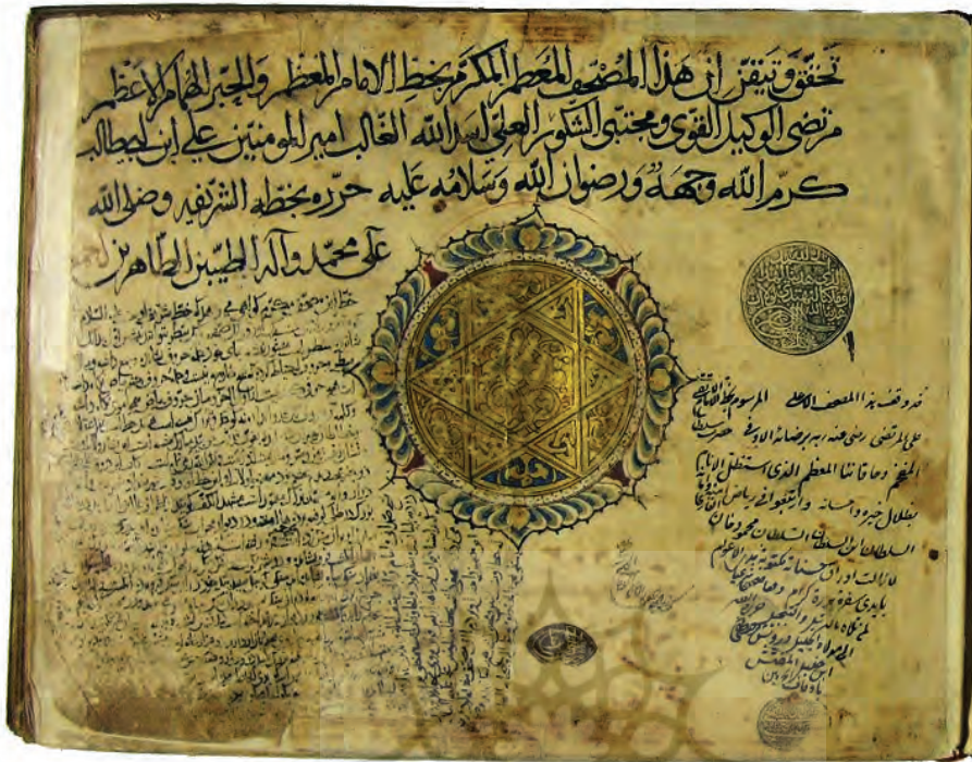
تصویر ۱۶: شهادت بر کتابت قرآنی کوفی به دست امام علیه علیه السلام؛ نسخه ش ۷۵۴ در موزه توپقاپی

پژوهشگاه علوم انسانی و مطالعات فرهنگی پرتال جامع علوم انسانی