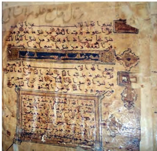
تصویر ۲۹: قرآن کوفی مشرقی منسوب به امام موسی کاظم علیه السلام در کشمیر؛ «فرغ من كتبه يوم الثلاثاء الخامس والعشرين من محرم سنت ثلث واربعين وخمسائة» [تاریخ مخدوش شده تا ۱۷۳ خوانده شود]