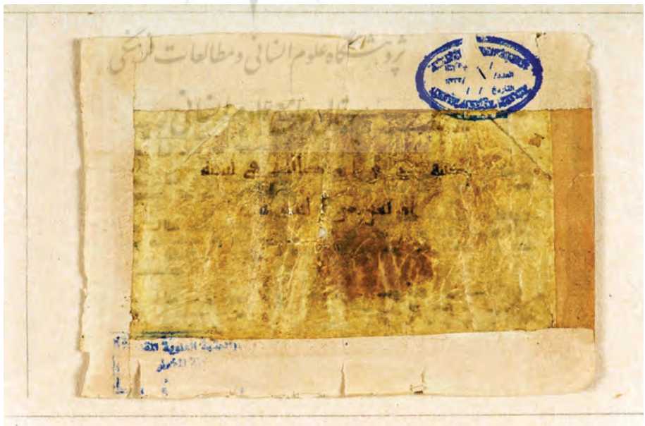
تصویر ۶: «کتبه علی بن ابی طالب فی سنة اربعین من الهجرة»؛ رقم الحاقی به صفحه پایانی مصحف قرآنی ش ۱ در حرم امام علی علیه السلام