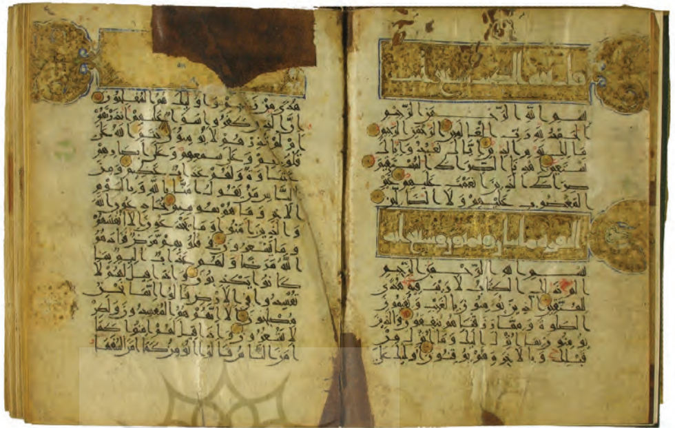
تصویر ۲۳: قرآن به خط کوفی مشرقی از قرن ۵ تا ۶ هجری منسوب به خط امام حسین علیه السلام در موزه تویقایی، به شماره R38