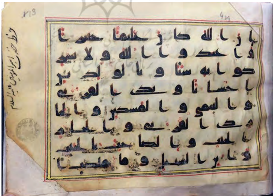
تصویر ۱۰: برگ ۱۳ از نسخه Arab.f.3 در کتابخانه بادلیان (آکسفورد)؛ «خط حضرت امیرالمؤمنین علیه السلام»