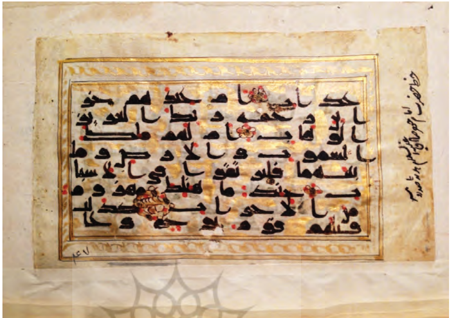
تصویر ۹: برگ ۴۷ از نسخه Fraser48 در کتابخانه بادلیان (آکسفورد)؛ «خط حضرت امام جعفر صادق علیه السلام هدیه صد روپیه»