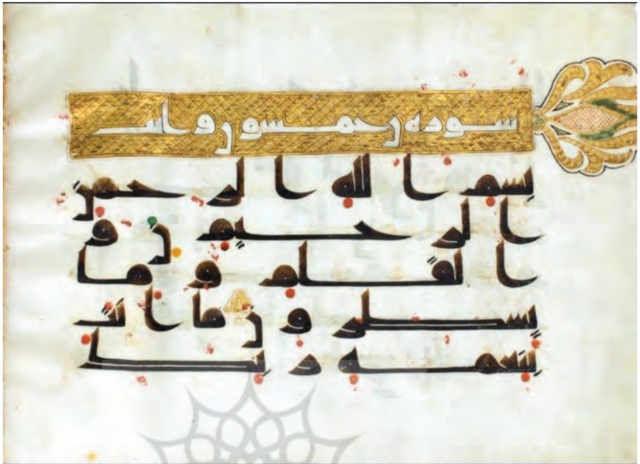
تصویر ۱: قرآن کوفی شماره ۴۲۹۳ در موزه ملی ایران منسوب به خط و تذهیب امام علی علیه السلام

تصویر ۲: «کتبه و ذهبه علی بن ابی طالب سبع هجرية»؛ انجامة الحاقی در انتهای نسخه ش ۴۲۹۳ در موزه ملی ایران