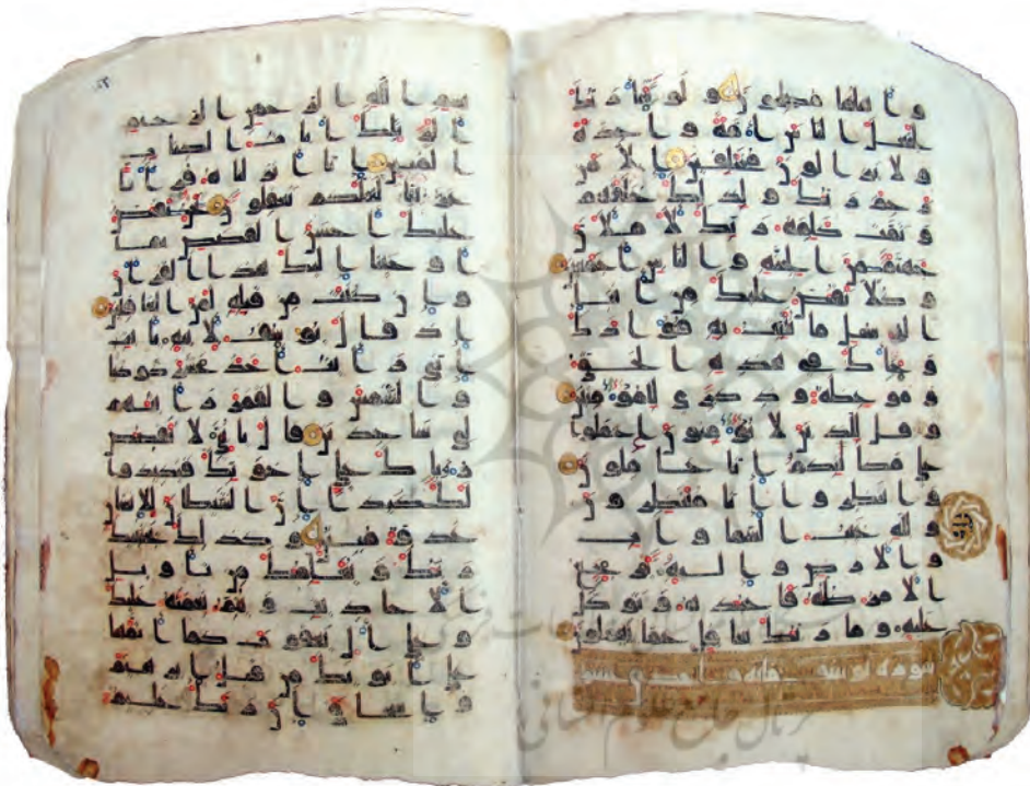
تصویر ۲۵: قرآنی کوفی به شماره «مصاحف ۱» در دارالکتب المصرية، کتابت شده احتمالاً در خراسان قرن ۴ یا ۳ هجری، منسوب به خط امام جعفر صادق علیه السلام