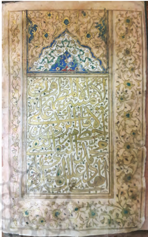
تصویر ۲۸: نسخه‌ش ۱۰۴۴ در موزه کاخ گلستان؛ «الشبع الخامس من الاحزاب؟ من العنكبوت الي زمير يخط والدى على بن محمد عليهما السلام»