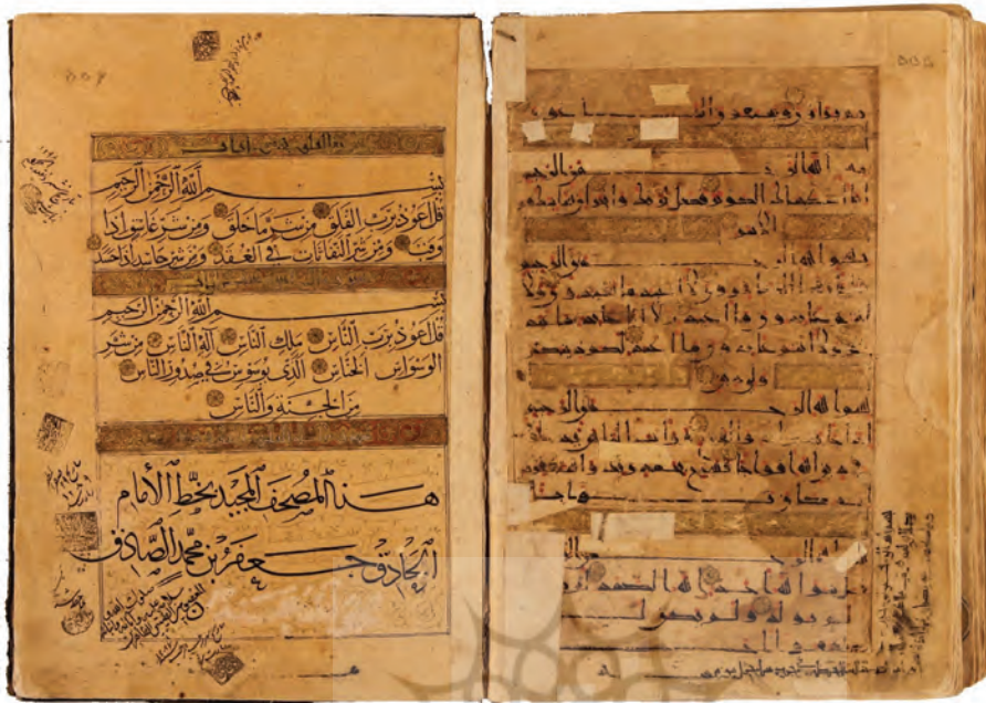
تصویر ۲۱: برگ آخر قرآن ش ۱۷ به خط کوفی مشرقی از قرن پنجم هجری، وانتساب آن به امام صادق علیه السلام در هنگام کسرتنویسی به خط ابراهیم سلطان تیموری