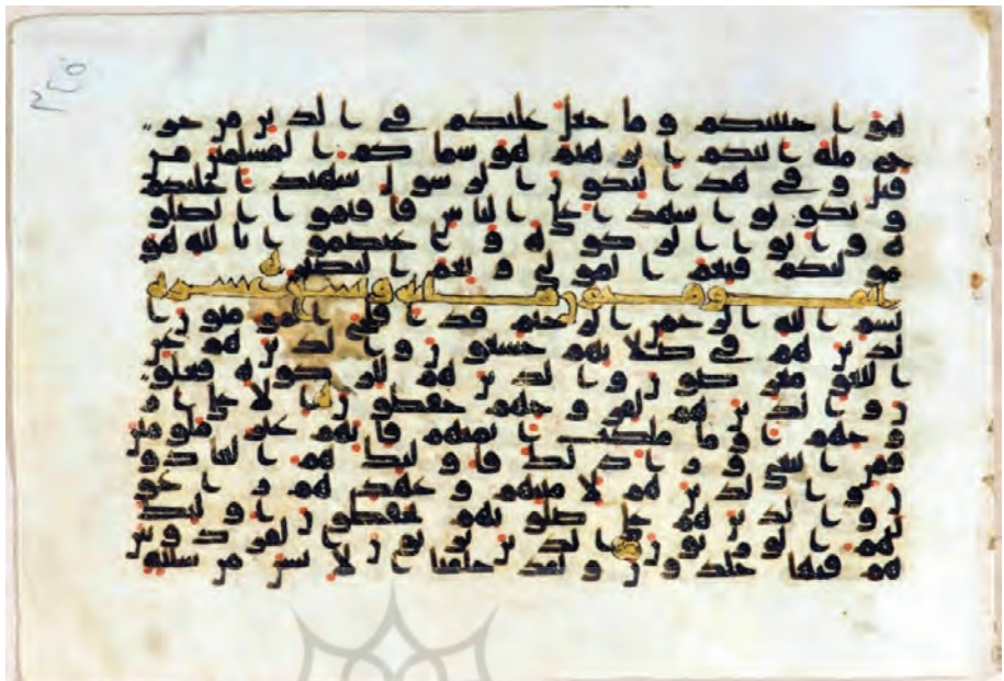
تصویر ۵: نمونه‌ای از خط مصحف قرآنی ش ۱ در حرم امام علیه السلام (حاوی بیش از ۳۰ اشتباه و سهو کاتب)