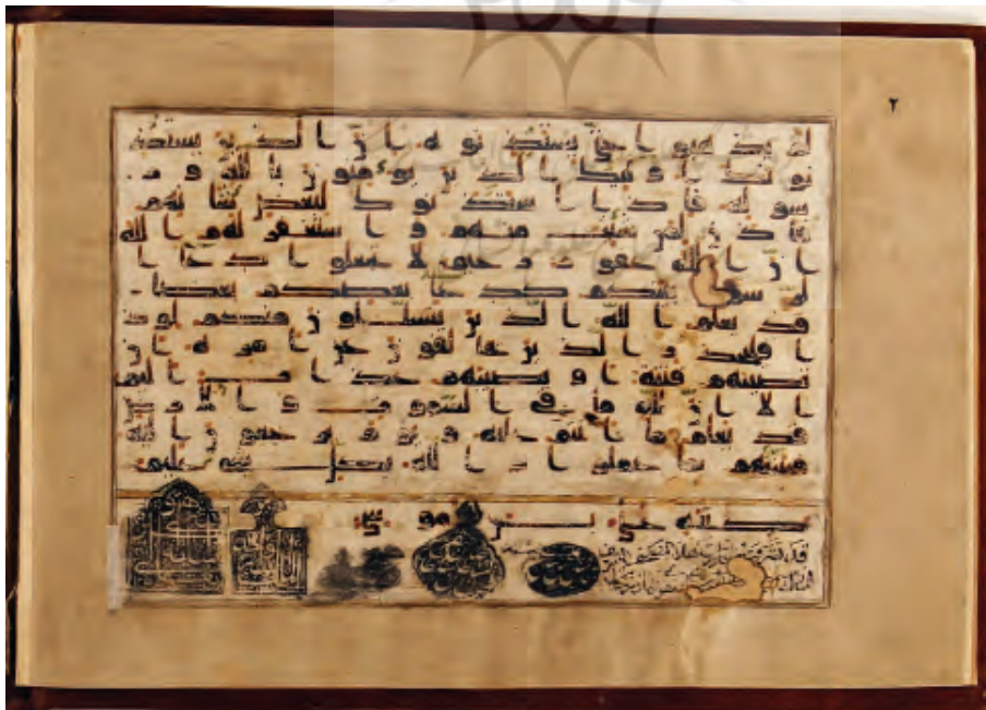
تصویر ۱۲: امضای منسوب به امام رضا علیه السلام در انتهای سوره نور، همراه با تشرف منسوب به شاه اسماعیل؛ نسخه ش ۱۵۸۶ در کتابخانه آستان قدس رضوی