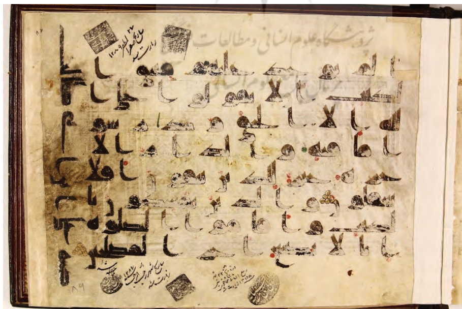
تصویر ۳۳: «کتابه علی بن ابی طالب فی سنة احدى واربعین» اضافه شده در انتهای نسخه قرآن ش ۱۲ کتابخانه آستان قدس رضوی