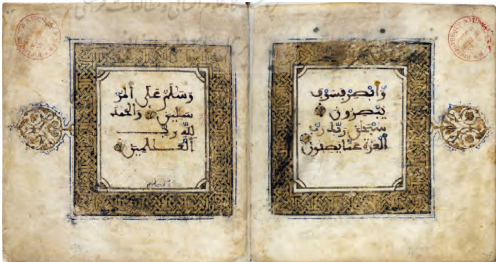
تصویر ۲۴: قرآن به خط مغربی از قرن ۵ تا ۶ هجری منسوب به خط امام رضا علیه السلام در کتابخانه ملی فرانسه، به شماره Smith-Lesouëf 194