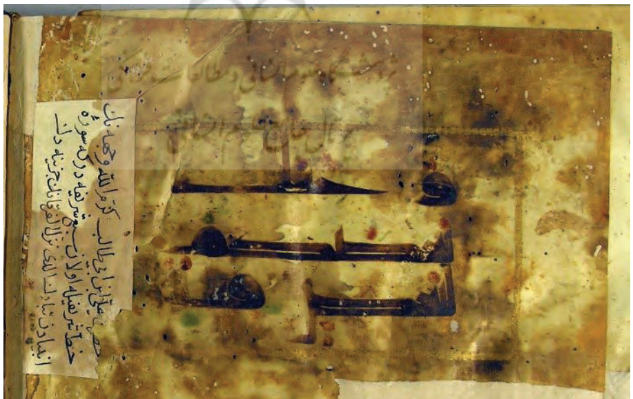
تصویر ۱۵: انتساب خط قرآن کوفی به شماره R11 در موزه تویقایی به خط امام علی علیه السلام