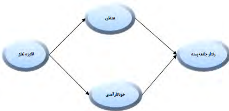
شکل ۱: مدل پیشنهادی ارتباطی بین انگیزه تعلق با رفتار جامعه‌پسند با میانجی‌گری همدلی و خودکارآمدی