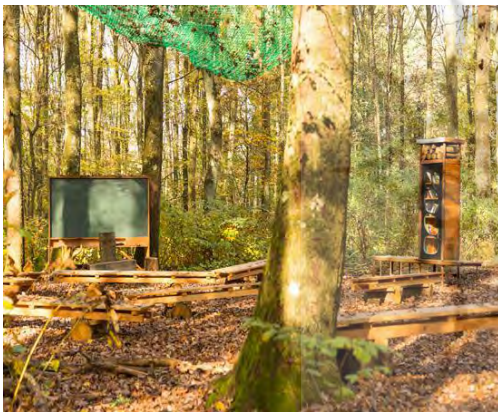
شکل شماره ۵: مدرسه جنگل در انگلستان

چمن‌زارها، کوه‌ها و مراتع داشته باشند. مدرسه‌ی جنگل، یک رویکرد نوین آموزشی است که از اواخر سال‌های ۱۹۵۰، با آغاز شکل‌گیری این مدارس در دانمارک و سوئد، و سپس توسعه‌ی آن در اسکانیدیناوی، اروپا، چین، استرالیا، نیوزلند، ایالات‌متحدہ آمریکا و در حال حاضر در کانادا در جهان گسترش یافته است. در مدارس جنگل، کودکان نیمی از روز تا یک روز کامل را در خارج از منزل و در پارک‌های مختلف شهری، فضاهای طبیعی مجاور یا نزدیک به مدرسه، زمین‌های بازی طبیعی و کلاس‌های بیرون از فضای مدرسه سپری می‌کنند. کودکان مدارس جنگل، در تمام اوقاتی که در بیرون از فضای مدرسه هستند، فرصتی برای یادگیری منظم را در اختیار دارند؛ به‌عنوان مثال برخی از برنامه‌ها برای دانش‌آموزان در نیم روز و برخی دیگر برای یک روز کامل ارائه می‌گردد. مدرسه‌ی جنگل با نام‌های مختلفی مانند کودکستان طبیعت، مدرسه در فضای باز، مدرسه‌ی بارش و تابش، ... شناخته شده است؛ اما دو نام برجسته برای این نوع مدرسه وجود دارد: «مدرسه‌ی جنگل» یا «مدرسه‌ی طبیعت» [۶].