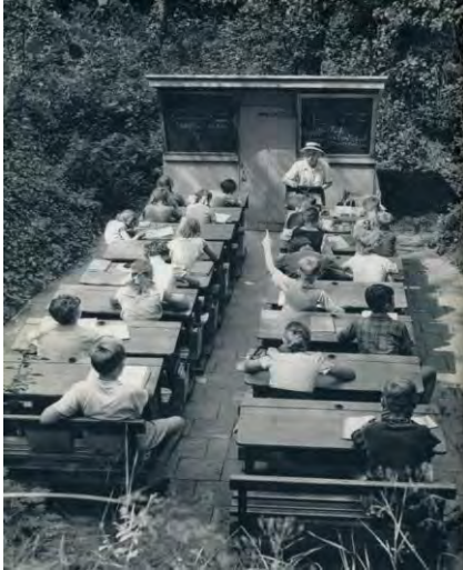
شکل شماره ۲: دانش آموزان مدرسه در فضای آزاد