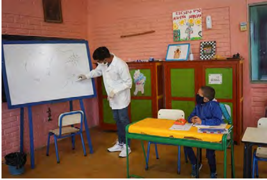
شکل شماره ۷: مدرسه روستایی در سن خوزه ، اروگوئه