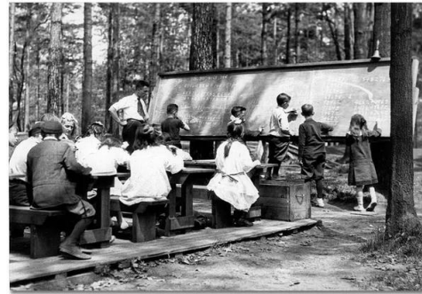
شکل شماره ۱: دانش آموزان در پارک جنگلی سال ۱۹۱۳

فضاهای باز می توانند معلمان را ترغیب کنند که فعالیت های بدنی را با محتوای آموزشی ترکیب کنند. چرا که افزایش فعالیت های بدنی با احتمال افزایش پیشرفت تحصیلی مرتبط است. تحقیق شبه آزمایشی (۲۰۲۰) با عنوان " آموزش در فضای باز " توسط دانشگاه شبروک انجام شد. نتایج تحقیق نشان داد که با وجود محرک های مزاحم همچون سر و صدای محیطی، عابران... فضای باز به فراگیران اجازه داد که تمرکز بیشتری روی یادگیری داشته باشند. این مشاهدات مقدماتی نشان می دهد که محیط یادگیری در فضای باز می تواند مفید باشد [۱]. افزایش زمان استفاده از فضای بیرون از منزل برای کودکان ایده جدیدی نیست؛ تحقیقات نشان می دهد یادگیری و بازی در فضای باز باعث بهبود سلامت جسمی و روانی، شناخت، توجه و بهبود در یادگیری می شود. چالش های کنونی مانند الزامات فوق العاده بهداشتی، فاصله فیزیکی و اجتماعی، استفاده از ماسک، انتقال ویروس، استفاده بیش از حد از فضای مجازی و صفحه نمایش، استرس کلی جامعه به سادگی کانون توجهات را جلب می کند. در طول COVID-19، آنچه بسیار مناسب به نظر می رسد این است که کلاسهای درس در فضای باز می توانند به فراگیران و معلمان فضای جایگزینی برای رعایت کردن فاصله، نفس کشیدن، خواندن، نوشتن، گفتگو و تفکر با هم بدهد. البته هنوز به این روش خیلی جا نیفتاده است؛ اما می تواند یک راه حل مقدماتی باشد. در نظر گرفتن این ایده نیز نوعی تغییر فرهنگ است، اما کلاسهای فضای باز را می توان برای هر نوع یادگیری که در ساختمان مدرسه اتفاق می افتد استفاده کرد. یک تخته سفید نصب شده روی ستون ها ، سطل های گالنی برای نشستن ... و مازیک برای نوشتن سطوح می تواند کافی باشد [۲].