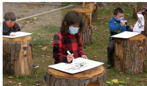
شکل شماره ۴: مدرسه دولتی لانسداون در ماه سپتامبر یک کلاس کاملاً جدید در فضای باز

پروژه کلاس درس در فضای باز (OCP)؛ جهت افزایش کمیت؛ کیفیت و بهره‌مندی از کسب تجربه در فضای باز برای کودکان و ارائه برنامه‌های آموزشی در نظر گرفته شده است. امروزه سلامت و خوشی، آموزش، توسعه کودکان به خطر افتاده است. مشارکت جوانان در فضای باز به دلیل پیشرفت تکنولوژی کاهش یافته است و دلیل دیگر آن که دانش‌آموزان، بیش از شش ساعت را در فضای بسته می‌باشند. پروژه کلاس درس در فضای باز، بر اساس این باور تاسیس شد که توانایی مقابله با این چالش‌ها را از طریق ارائه تجارب غنی و جذاب یادگیری در فضای باز دارد. یادگیری مطلوب و محیط رشد به ویژه برای خردسالان، نیازمند ترکیبی از فضاهای درون و بیرون از کلاس درس می‌باشد. کلاس درس در فضای باز محدودیت‌های موجود در کلاس درس را از طریق امکان فعالیت‌های دست‌ورزی، فعالیت‌های بدنی، رشد عاطفی اجتماعی از طریق روابط متقابل، رویکردهای چندوجهی رشد شناختی و به کمک ارتباط با طبیعت بر طرف می‌نماید و پیامدهای یادگیری را به حداکثر می‌رساند [۷].