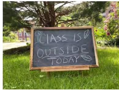
شکل شماره ۳: کلاس فضای باز راهکار امروز

تقریباً همه کشورهای جهان در اوایل بیماری همه گیر COVID-19 مدارس خود را تعطیل کردند. از آن زمان بسیاری از دانش‌آموزان به کلاس برگردانده شده اند. برخی از کشورها از جمله تایوان، نیکاراگوئه و سوئد هرگز مدارس خود را تعطیل نکردند. سوئد، رویکرد "دست نزنید!" را برگزید؛ همچنین دانش‌آموزان ۱۶ ساله و بالاتر در خانه ماندند و یادگیری از راه دور را انجام دادند [۸]. استان کبک کانادا، که در ماه مه (اردیبهشت) ۲۰۲۰ مدارس ابتدایی را با فاصله بسیار زیاد بازگشایی کرد، برنامه‌های را اعلام کرد که به کودکان اجازه می‌دهد در گروه‌های شش نفره آزادانه معاشرت کنند. هر گروه باید ۱ متر از گروه‌های دیگر دانش‌آموزان و ۲ متر با معلمان فاصله داشته باشد [۴]. ژاپن تا اینجا خیلی خوب عمل کرد؛