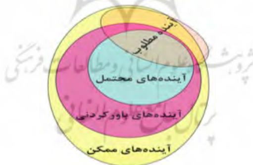
شکل ۱. انواع آینده از منظر آینده‌پژوهی (حیدری ۱۳۹۲)

آینده‌پژوهی در وهله نخست می‌کوشد تا براساس رویکردهای اکتشافی آینده‌های بدیل را کشف و شناسایی کند، در این رویکرد هنجارها و ارزش‌ها جایی ندارند و انسان به‌صورت منفعل برخی از آینده‌های محتمل را پیش‌بینی می‌کند. آینده‌پژوهی آینده را متعین، محتوم و قطعی نمی‌داند، بلکه آن را بدیل تصور می‌کند. آینده‌های بدیل حالت‌هایی از آینده است که با توجه به شدت و ضعف عوامل سازنده آنها، می‌توانند به‌صورت جایگزین هم پدید آیند. آینده‌پژوهی با رویکرد هنجاری و ارزشی از بین آینده‌های بدیل به آینده‌های مطلوب و مرجح می‌اندیشد و در واقع ساخت و معماری آینده‌های دلخواه و مطلوب را مدنظر دارد (شکل ۱).