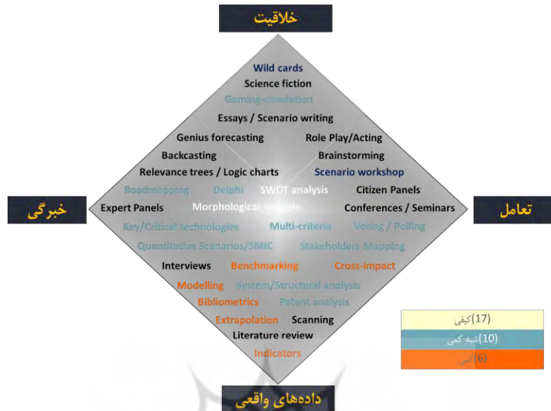
شکل الماس (لوزی) پاپر (پاپر، ۲۰۰۸)