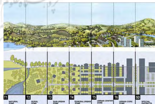
شکل ۱: مدل منطقه‌بندی استاندارد برش عرضی کدهای فرم-مبنا؛ مأخذ: (Parolek, 2008; Plater-Zyberk, 2009)

در کل می‌توان گفت، کدهای فرم-مبنا تمایل به در نظرگیری چشم‌انداز جامعه و ایجاد کدی که در ارتباط با شرایط محلی باشد، دارند. همچنین موضوعاتی چون کیفیت زندگی، کیفیت عرصه عمومی، و شهرسازی قوی در کدهای فرم‌مبنا رایج است. از موارد دیگر، می‌توان به ضرورت ایجاد دستورالعمل توسعه یکپارچه و استانداردهای وظایف عمومی، ایجاد پیش‌بینی پذیری در کدها، ساده‌سازی فرآیندهای واقعی و ایجاد کدهای مختصر و سهولت در درک آنها، اشاره کرد (Evan, 2014). بدین ترتیب این کدها با کنترل صریح فرم و به کمک تفکر برنامه‌ریز، مبنی بر آن که چه هنگام چه نوع فرم؛ ساختمان، زمین، یا شاید پوشش گیاهی مورد نیاز است، اجرا می‌شوند و سپس فرم‌ها و چیدمان آنها را در بهترین شکل ممکن تجلی می‌بخشند؛ تا نیازهای انسانی را برآورده نمایند (Hubbard, 1937:1).