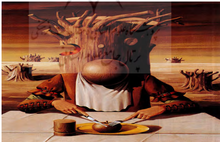
تصویر شماره ۲: رادیکال، ۱۳۶۰، ۹۱×۶۱ سانتی‌متر (مجبایی و زرین کلک، ۱۳۷۷: ۶۸)

انسان‌ها است. همان پاره‌های نور در آمیخته با تاریکی در وجود انسان که سبب می‌شود آدمی در جست‌وجوی خود، با زشتی‌ها و هم با زیبایی‌ها روبه‌رو شود. گل‌های زرد رنگ در این اثر، همان نقش زیبایی‌هایی را دارد که روح آدمی برای ادامه راهش به آن نیازمند است. همچنین گل جلوه‌ای قدسی و نمودی از دوستی است که ناخودآگاه آن را به انسان نشان می‌دهد. اما سنگ و نیزه‌هایی که در اطراف وجود دارد، زشتی‌ها و موانعی هستند که فرد در این مسیر مشاهده می‌کند (یونگ، ۱۳۷۳: ۱۲۵). علاوه بر این، صادقی با قرار دادن سنگی بر روی این صفحه، قصد دارد تا اشاره‌ای به داستان هابیل و قابیل کند و اولین برادرکشی نسل بشر را به‌عنوان کهن‌الگویی در ناخودآگاه انسان بیان کند. حادثه‌ای که در طول تاریخ بشریت بارها و بارها تکرار شده است (مجبایی و زرین کلک، ۱۳۷۷: ۱۵). سایه‌ای که در حال فریاد زدن است، ندای درون آدمی است که از سردرگمی و سختی این مسیر بی‌پایان خسته شده است، اما سایه فرشته در این تصویر، بخش نیک وجود آدمی یا همان کیفیت عالی است و یا با توجه به آموزه‌های ایران باستان بخش اهورایی وجود آدمی که به یاری انسان می‌آید تا او را از این سردرگمی نجات دهد.