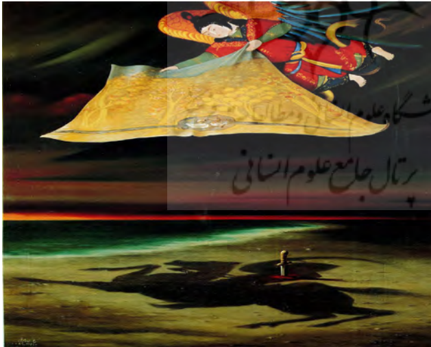
تصویر شماره ۴: فصل سرخ، ۱۳۷۰، ۷۵،۵×۶۰ سانتیمتر

که یونگ مطرح می‌کند، پرسونا یا نقاب است. پرسونا یا نقاب صورتی است که فرد با آن وارد اجتماع می‌شود. در واقع، به باور یونگ، این اجتماع است که چنین نقابی را برای انسان انتخاب می‌کند (یونگ، ۱۳۷۱: ۴۰۵). پرسونا در واقع، شخصیت اجتماعی فرد به حساب می‌آید و خود واقعی او در زیر این نقاب پنهان است. این نقاشی تأکیدی بر این امر است که بسیاری از انسان‌ها، خود واقعی‌شان را نشان نمی‌دهند. به‌طور واضح، می‌توان دید که انسان در این نقاشی، حتی برای حفظ ظاهر خود به کتابی که نمادی از زندگی، روح و خرد است، پشت کرده و در پی آن است تا فردیت خویش را جعل کرده و سایرین را به این باور برساند که انسان نقاب‌دار برای خود شخصیت مستقلی دارد. انسان تصویر شده در این اثر، بدون سر است، اما از سوی دیگر، شاهد هستیم که در کمد خود چهار سر با چهره‌های مختلف دارد که هر کدام در سنین متفاوتی هستند. به‌وضوح می‌توان مشاهده کرد که فرد هر بار که یکی از این چهره‌ها را برای ورود به جامعه انتخاب می‌کند، دنیای درونش را تسلیم دنیای بیرون خود می‌کند. در این جا، نوعی از خودبیگانگی وجود دارد که انسان درون تصویر را به راه یکی شدن با نقاب