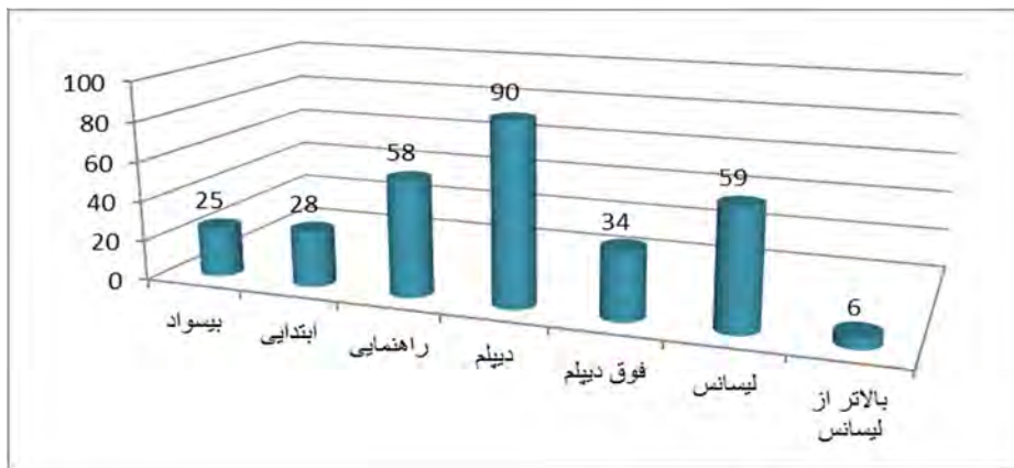
نمودار ۱. توزیع فراوانی نخل داران بر اساس سطح سواد (مأخذ: یافته‌های پژوهش)