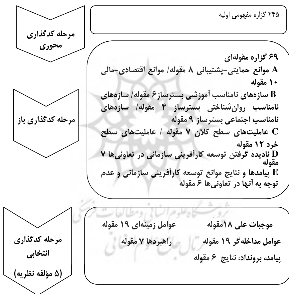
شکل ۱. جریان تقلیل داده‌ها در سه مرحله کدگذاری

دسته عنوان مناسب داده می‌شود و سپس از دل آنها مفاهیم ۱ و مقولات ۲ استخراج و از این رهگذر خوشه‌های مفهومی تشکیل می‌گردد که هر یک به مقولاتی تعلق دارند و سرانجام از ارتباط این مقولات است که شالوده‌ای سامان می‌یابد و مدل مورد نظر برای توضیح یک پدیده خلق می‌شود (رستمی و همکاران، ۱۳۹۳). به طور کلی، روند تحلیل در قالب شکل ۱ نشان داده شده است.