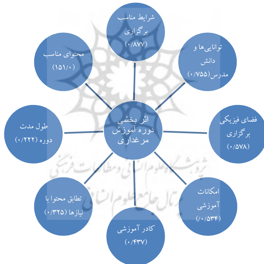
شکل ۲. سهم هر یک از متغیرها بر اساس ضریب بتا

اما قضاوت در مورد سهم و نقش هر یک از ۸ متغیر مذکور در تبیین متغیر وابسته را باید به مقادیر بتا (ضریب استاندارد شده) واگذار کرد، زیرا این مقادیر امکان مقایسه و تعیین سهم نسبی هر یک از متغیرها را فراهم می‌سازد. بر این اساس، سهم شرایط مناسب برگزاری دوره بیشتر از سایر متغیرهای وارد شده به معادله رگرسیونی می‌باشد، زیرا بر پایه بتای به دست آمده (۰/۸۷۷) برای شرایط مناسب برگزاری، به ازای یک واحد تغییر در انحراف معیار به اندازه ۰/۸۷۷ در انحراف معیار متغیر وابسته تغییر ایجاد می‌گردد. میزان بتای هر یک از متغیرهای مورد بررسی در شکل ۲ نشان داده شده است.