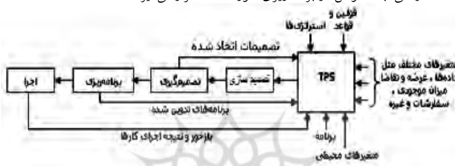
شکل ۱. مدل کلاسیک TPS (محمودی، ۱۳۹۴)

سیستم پردازش تراکنش (تبادلات و دادوستد) مطابق شکل ۱، به سیستم‌های هوشمند و خودکاری گفته می‌شود که به صورت تعاملی، پویا و بی‌درنگ، داده‌ها و متغیرهای اطلاعاتی را از منابع مختلف دریافت کرده و طبق برنامه‌ای خاص آنها را در برخورد و پردازش قرار می‌دهند. حاصل تمامی این رویدادها، تولید یک سری نتایج و اطلاعات بسیار ارزشمندی است که در تحقق اهداف سازمانی، به خصوص در برنامه‌ریزی، مورد استفاده قرار می‌گیرند.