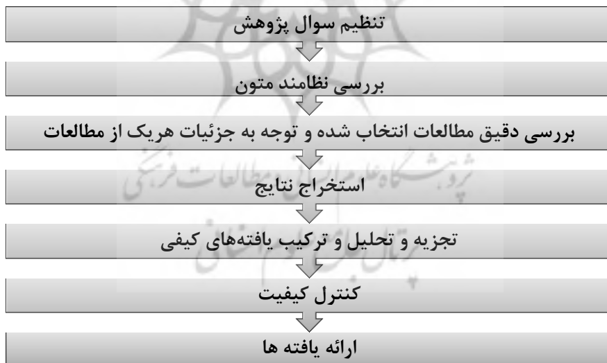
شکل ۱- گام‌های روش فراترکیب

این پژوهش با روش کیفی فراترکیب ۱ انجام شد. این روش برای ترکیب مطالعات کیفی مرتبط با یک پدیده و توصیف و تفسیر آن‌ها به کار می‌رود (Whittemore, 2005). فراترکیب، پژوهشی است که به ارزشیابی پژوهش‌های دیگر می‌پردازد. به عبارتی، مرور یکپارچه منابع یا مرور سامانمند نیست؛ هدف اصلی فراترکیب ساخت نظریه، حمایت از تئوری‌های موجود و تفسیر و روشن‌سازی و تکمیل آن‌ها است (Sandelowski & Barsoo, 2007). در حقیقت دیدگاه تفسیری فراترکیب عامل افتراق آن با فراتحلیل است. این رویکرد، روشی نوین برای گردهم آوردن، مقایسه و ترجمه مطالعات کیفی با یکدیگر است. در پژوهش‌های سازمانی از روش فراترکیب کمتر استفاده شده است. نمونه موردنظر در این پژوهش، از مطالعات کیفی منتخب و بر اساس ارتباط آن‌ها با سؤال پژوهش ساخته می‌شود. این پژوهش در دو مرحله انجام شد. درنهایت با توجه به انجام مراحل روش فراترکیب و همچنین تحلیل اسناد مرتبط و اخذ نظر خبرگان جهت بهینه‌سازی آموزش‌های سازمانی صنعت پتروشیمی، الگوی انطباقی ارائه گردید. در ادامه گام‌های روش فراترکیب با ابتناء بر روش ساندلوسکی و بارسو ۲ (۲۰۰۷) مطابق شکل شماره ۱ تشریح شده است.