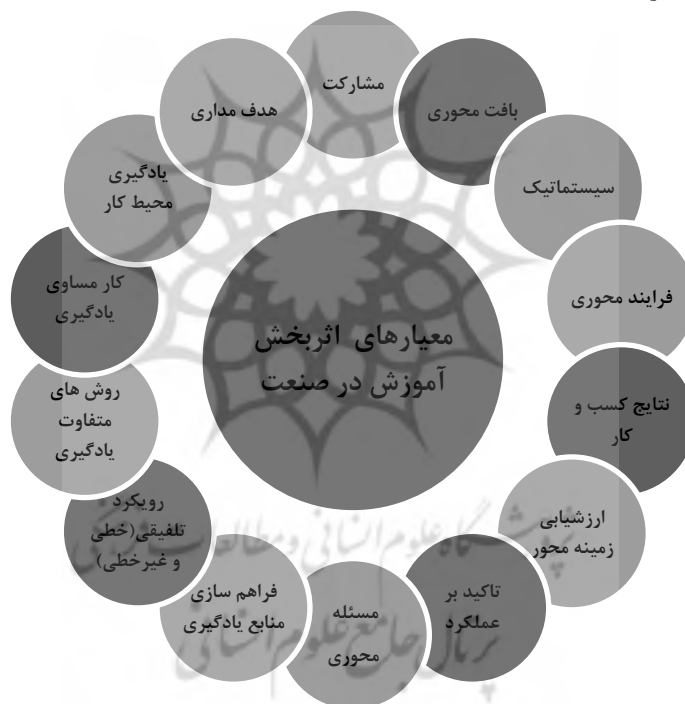
شکل ۲- معیارهای اثربخش جهت طراحی آموزش در صنعت

از بین ۲۵۰ مقاله ۳۰ مقاله مرتبط با موضوع تحقیق که الگوهای طراحی آموزشی و یادگیری محیط کار در آن توضیح داده بودند انتخاب شدند. معیار پذیرش شامل زبان فارسی و انگلیسی، زمان انجام مطالعه از سال ۱۹۸۰ به بعد، مقالات چاپ شده در مجلات و کتابها و داشتن حداقل سه معیار از چهارده معیار اثربخش جهت طراحی آموزش در صنعت بود (شکل شماره ۲ ببینید). این معیارها توسط تیم تحقیق دسته‌بندی گردیده‌اند.