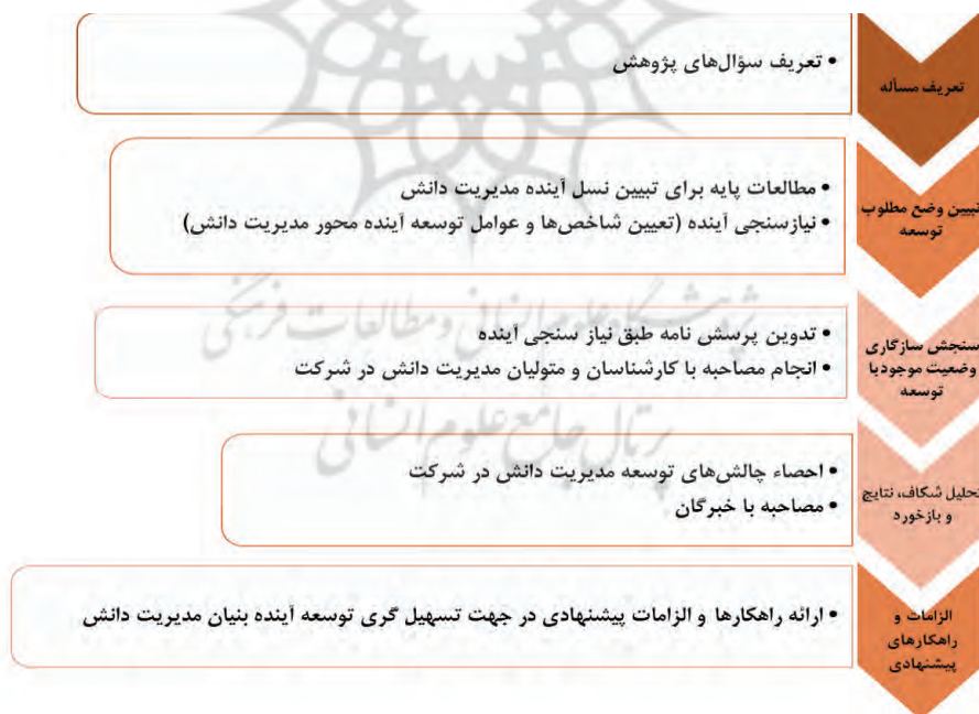
شکل ۲. گام‌های پژوهشی پیموده شده توسط محققین