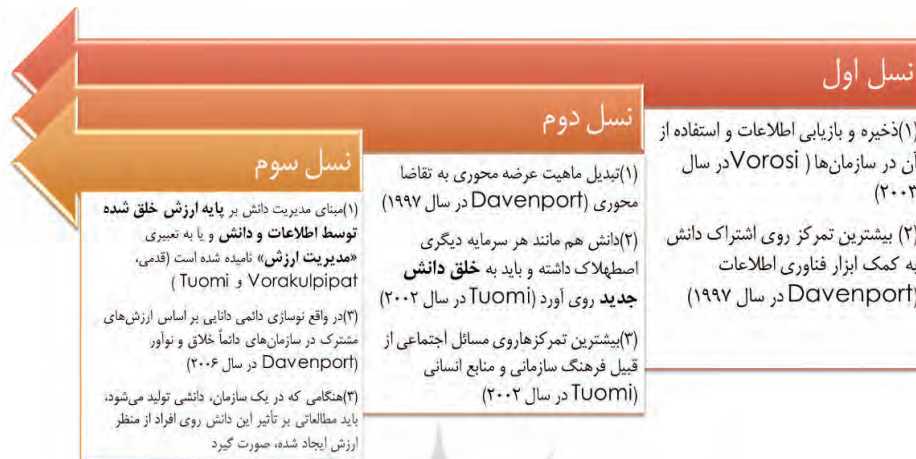
شکل ۱. سیر تکامل نسل‌های مدیریت دانش و شیوه تمرکز آنان روی مسائل دانشی

سه نسل موجود در شکل ۱، بصورت ممتد و موازی تصویر شده است؛ زیرا که در بعضی از سازمان‌های امروزی، همچنان رویکردها و توجهات سنتی در پیاده سازی مدیریت دانش (نسل اول و دوم) وجود دارد. همانطور که مشاهده می‌شود، آینده مدیریت دانش با نسل سوم آن گره خورده و رویکردهای مشابهی را همسان "مدیریت ارزش" (یا مدیریت فرایندهای «ایجاد ارزش از دانش ذخیره و به اشتراک گذاری شده» با منابع موجود) به خود گرفته است. جالب اینجاست که در سال ۱۹۹۸ محققى به نام تیس ۱ نیز به این موضوع واقف بوده و انتهای فرایند مدیریت دانش خود را با اندازه‌گیری ارزش سرمایه دانشی (تأثیر مدیریت دانش) به پایان می‌رساند (Teece, 1998). با هدف اکتساب مهم‌ترین نقاط متمایز آینده مدیریت دانش (مدیریت ارزش)، مشخصه‌هایی شامل توسعه مشارکت‌های اجتماعی فعال به جای انفعال در سازمان، آموزش سازمانی، جنبه‌های اجتماعی - فرهنگی سازمانی با تأکید بر شبکه‌های انسانی، ساختار نوآوری، مدیریت تغییر، سرمایه‌های فناوری و سرمایه فکری تفوق یافته‌اند که از مقالات پایه تحقیق استخراج شده و نهایتاً منجر به طراحی سؤالات پرسش‌نامه شده است.