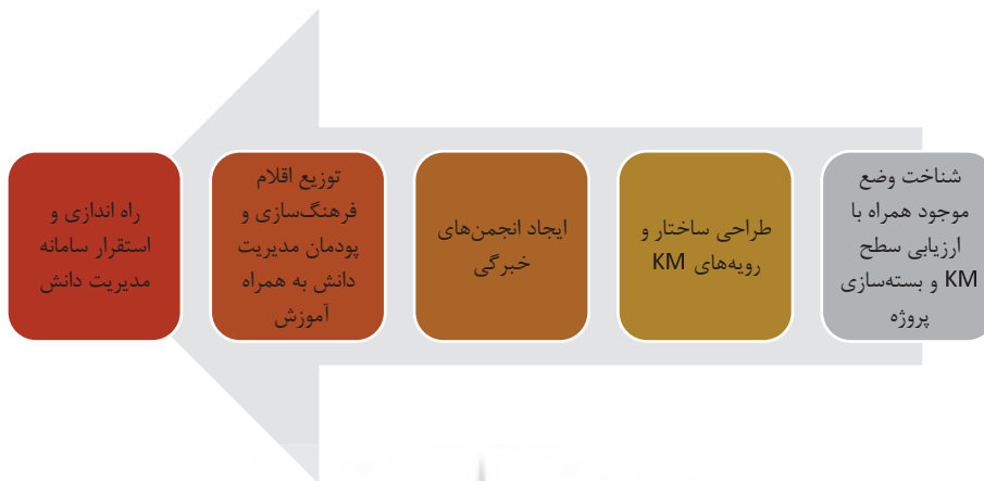
شکل ۳. مسیر پیموده شده در پیاده سازی مدیریت دانش در شرکت ملی صنایع پتروشیمی ۱