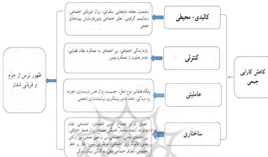
شکل شماره ۲: مکانیسم ترس از جرم به مثابه کاهش اثربخشی جمعی

نظریه مدل اثربخشی جمعی، ترس از جرم را به امری تاریخی، گذار توسعه‌ای و حرکت انتقالی از یک نظام اجتماعی سنتی به یک نظام اجتماعی نو که هیچ سازگاری ارزشی و نهادی در آن وجود ندارد، نسبت می‌دهد. در مرکز این نظریه، ریشه ظهور و شکل‌گیری ترس از جرم، در مرحله انتقالی که با جایجایی ارزشی همراه است، از طریق عوامل شش‌گانه مدل اشتراوس و کوربین، محقق می‌شود. بر این اساس ترس از جرم در شهروندان، امری کنونی، لحظه‌ای و تابع شرایط فعلی به مفهوم محض نیست. این مسئله، بار تاریخی و شرح داستانی است که اجتماع موردنظر آن را سپری و تجربه کرده و هنوز در گلوگاه انتقالی قرار گرفته و نوعی از بی‌سازمانی و نظم آشفته را حمل می‌کند. ترس از جرم شهروندان، انعکاسی از وقایع محیط اطراف است که در درک و تصور شهروندان تأثیر می‌گذارد، این امر ممکن است به صورت مستقیم تجربه شود یا غیرمستقیم درک و تفسیر شود. ریشه ترس از جرم، به یک عامل مهم برمی‌گردد، آن از دست رفت نظام اثربخشی جمعی است.