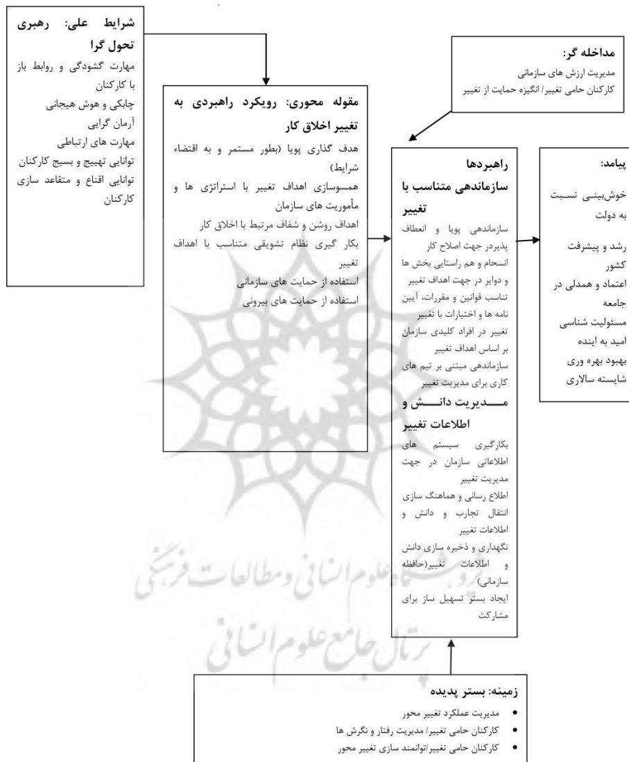
شکل ۲: کدگذاری محوری بر اساس الگوی پارادایم

شکل (۲)، ایجاد ارتباط بین مقوله های مختلف شناسایی شده را در قالب الگوی پارادایم نمایش می دهد.