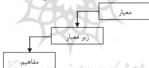
شکل ۵- الگوی تغییر فرهنگ سازمانی با رویکرد اصلاح اخلاق کار

الگوی تغییر فرهنگ سازمانی با رویکرد اصلاح اخلاق کار دارای دو بخش مولفه های اصلی و مولفه های فرعی می باشد. این دسته از مدلها از شاخص هایی تشکیل شده است که هسته و قلب این مدلها می باشند و مبنای ارزیابی تغییر فرهنگ سازمانی قرار می گیرند که به آنها معیارهای مدل می گویند. الگوی الگوی تغییر فرهنگ سازمانی با رویکرد اصلاح اخلاق کار دارای ۸ مقوله است که شامل ۷۳ مفاهیم تشکیل دهنده آنها می باشد. برای بسط و توسعه هر یک از مولفه ها تعدادی از مفاهیم آنها را پشتیبانی می کنند. مفاهیم در واقع تبیین کننده معنا و مفهوم هر مولفه بوده که می بایست در طول ارزیابی تغییر فرهنگ سازمانی مورد توجه قرار گیرند. شکل (۵) ساختار الگوی تغییر فرهنگ سازمانی با رویکرد اصلاح اخلاق کار و نحوه پیوند میان بخش، مولفه اصلی، مولفه فرعی در الگوی تغییر فرهنگ سازمانی با رویکرد اصلاح اخلاق کار را نشان می دهد.