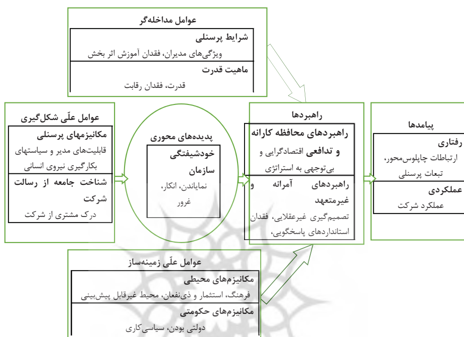
شکل ۲ مدل مفهومی تحقیق

سازمان بسیار مفید و یا شدیداً مخرب باشد. در یک سو، سازمان توانایی تعیین و تبیین یک چشم‌انداز قانع‌کننده و انرژی‌بخش را دارد و در سوی دیگر، به طرز خودخواهانه‌ای اعتماد به نفس دارد. به شدت حساس بوده و وقتی مورد نقد قرار می‌گیرد، شدیداً حالت تدافعی می‌گیرد. گرچه در این حالت هم شرکت قابلیت شکوفایی دارد، اما در کوتاه‌مدت، تنها کاری که می‌کند تحمل است. بنابراین، دوز سالم خودشیفتگی سازمانی نه تنها بد نیست بلکه اگر با ویژگی‌های مثبتی مثل دوراندیشی و الهام‌بخشی همراه شود، می‌تواند یک ویژگی سازمانی ارزشمند باشد؛ احساسی که به شرکت عزت نفس می‌دهد و موجب سرزندگی و خلاقیت می‌شود و سازمان را دوست‌داشتنی می‌سازد. این خودشیفتگی مثبت سازمانی نسبت به پذیرش تصورات مثبت درباره شرکت و به حداقل رساندن اطلاعات نامتناقض متمایل است. میزان مناسب از خودشیفتگی می‌تواند شرکت را به یک سازمان موفق تبدیل کند و نتایج شگفت‌انگیزی را برای شرکت و ذی‌نفعان آن به‌دنبال داشته باشد. لذا باید رفتارهای سازنده در شرکت مورد تشویق قرار گرفته و آموزش داده شود. البته، آموزش در وضعیتی که شرکت حالت تدافعی دارد و به کم و کاستی‌هایش اعتراف نمی‌کند، خیلی سخت به نظر می‌رسد، اما یک برنامه‌ریزی لازم است تا شرکت به مرور رویه‌اش را تغییر دهد و یک رویه سالم‌تر را در پیش بگیرد و گرفته، از