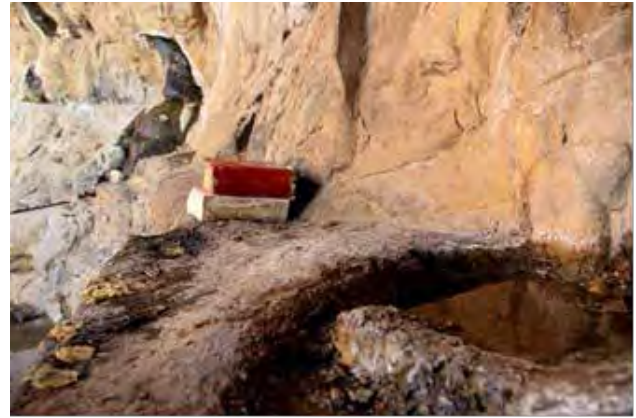
تصویر ۳. کنارهم قرار گرفتن قرآن و آب در مهرابه باستانی روستای کهنوج قدیم که امروزه با نام اسلامی چشمه مرتضی علی شناخته می‌شود. عکس: نرگس قدیانی، ۱۳۹۶.

نمادین و اجتماعی آیین‌ها سبب ارتباط و تعامل افراد با اماکن مختلف شده و بخشی از کالبد، معنا و هویت فضاهای مختلف را در ذهن افراد بازتولید می‌کند. این مسئله می‌تواند متوجه ابعاد فرهنگی یا مذهبی یک جامعه باشد که در بسیاری موارد از یکدیگر قایل تفکیک نیستند.