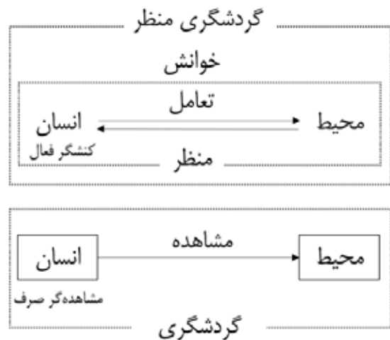
تصویر ۱. مدل مفهومی گردشگری منظر، مأخذ: نگارنده، ۱۳۹۹.

تجربیات گردشگری ذاتاً چندوجهی و اکتشافی بوده و گردشگران از طریق ارتباط با دیگران انتظارات خود را برآورده می‌کنند. این جنبه فعال و تعاملی از رفتار توریستی هنگامی که با گردشگران به‌عنوان گیرنده‌های منفعل فرآورده‌های مقصد رفتار می‌شود به‌راحتی نادیده گرفته می‌شود (Selstad, 2007). در حالی که معناداری یک مکان نتیجه روابط اجتماعی بین افراد و گروه‌های مختلف است. این مسئله در مکان‌های مذهبی به‌دلیل ماهیت مقدس سایت به‌شکلی پررنگ دیده می‌شود (Bremer, 2006, 26). بعد از آیین‌ها و مراسم جمعی، افراد با ساختار اجتماعی جدید یا ترکیب جدیدی از روابط اجتماعی یکی می‌شوند (Gluckman, 1962, 1) و آیین‌ها موجب تغییر جایگاه، نقش و موقعیت فرد می‌شوند (Fortes, 1962, 55-57). در بسیاری از اماکن آیینی، فضا به‌عنوان ظرفی برای ظهور و رسمیت یافتن باورهای مشترک افراد عمل کرده و برگزاری جمعی آیین‌ها نیز بر این مسئله تأثیری دوچندان می‌گذارد. تجربه جمعی ناشی از حضور در فضایی معنوی، بسیار