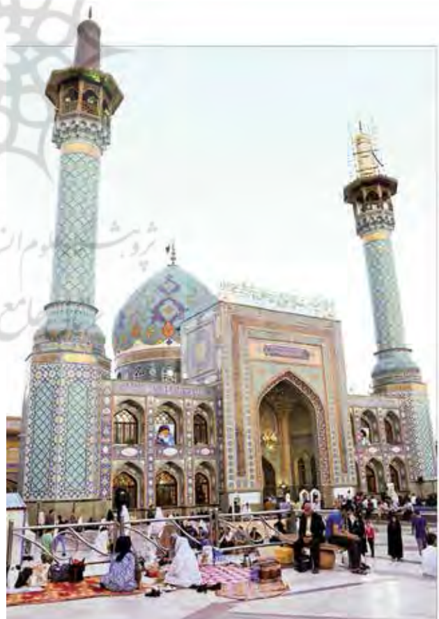
تصویر ۲. زیارت و تفریح توأمان به عنوان یک محرک گردشگری و پدیده‌ای فرهنگی در منظر آیینی زیارتگاه امامزاده صالح در تهران.

قوی‌تر از فضاهایی است که از فردیت بیشتری برخوردارند. ویژگی اجتماعی آیین‌ها منجر به بهبود ماهیت مشارکتی و اجتماعی تجربیات گردشگری شده و امکان تجربه اثرگذار اصالت و تفاوت فرهنگی را برای شرکت‌کنندگان و گردشگران فراهم می‌آورد. در نتیجه ویژگی‌های اجتماعی، در بسیاری از جوامع از جمله ایران، اماکن آیینی با برخورداری از ویژگی‌های اجتماعی پیوند نزدیکی با تفریح و گردش داشته‌اند. در هم آمیختگی مفهوم زیارت به‌عنوان عملی آیینی با مفهوم تفریح از نمودهای بارز وجه جمعی آیین‌ها نزد ایرانیان است. این مسئله سبب شکل‌گیری سنت زیارت-تفریح و سفرهای زیارتی در میان ایرانیان شده که در آن تفریح و زیارت به‌شکلی همسو صورت می‌پذیرد تا به‌حدی که ردپای آن در نوشته‌های سفرنامه‌نویسان و حتی اشعار فولکلور و مردمی نیز مستند شده است (تصویر ۲). چنین سفرهایی گردش و استراحت را با حال و هوای روحانی و معنوی در هم می‌آمیزد. به‌گونه‌ای که زائرین در گذشته در سفرهای زیارتی تا یک ماه در مشهد مقدس و گاه شش ماه در کربلا و در جوار حرم امام حسین (ع) و حضرت علی (ع) به‌سر می‌بردند (جوادی، ۱۳۹۷).