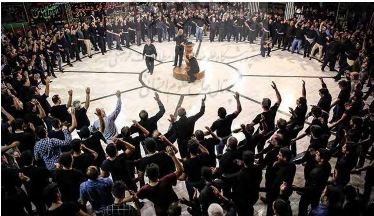
تصویر ۵. مراسم عزاداری سیدالشهدا در بوشهر یکی از رویدادهای آیینی سالانه در ایران.

سه عامل طبیعت، انسان و محیط انسان‌ساخت سه وجه اصلی سازنده مناظر آیینی هستند که هر یک شاخصه‌های منحصر به فردی را برای این مناظر رقم زده‌اند. شناخت مؤلفه‌های هویتی و فرهنگی، استمرار باورها و معانی، بهبود ماهیت مشارکتی تجربیات گردشگری از جمله نتایج نگاه گردشگری منظر به مقوله آیین‌هاست. بازخوانی محتوای اجتماعی، معنایی و کالبدی مناظر آیینی در قالب اماکن و رویدادهای آیینی، زمینه را برای شناخت فرهنگ جوامع و مقاصد گردشگری فراهم آورده و کیفیت سفر را از کسب داده‌ها و اطلاعات به درک زمینه‌های فکری و معنایی نهفته در آیین‌ها به‌عنوان پدیده‌هایی فرهنگی افزایش می‌دهد (تصویر ۶).