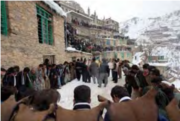
تصویر ۴. مراسم آیینی پیر شالیار در روستای اورامانات از جمله آیین‌های طبیعت‌گرا در فرهنگ ایرانی و یک جاذبه گردشگری در استان کردستان، عکس: محمد بارکار، ۱۳۹۵.