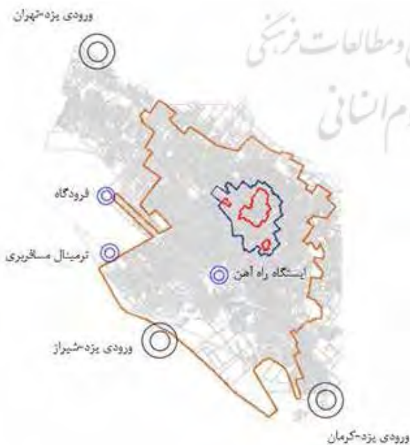
تصویر ۲. موقعیت ورودی اصلی شهر یزد و عرصه و حریم میراث جهانی یزد.

شهر یزد دارای یک فرودگاه بین‌المللی، یک ایستگاه قطار و دو ترمینال اتوبوس (درون‌استانی و بیرون‌استانی) و سه ورودی اصلی خود را از سمت تهران، کرمان و شیراز است (عالم‌زاده، کریمی، قاندي و غالبي، ۱۳۸۶). تصویر ۲ موقعیت این ورودی‌ها را نشان می‌دهد.