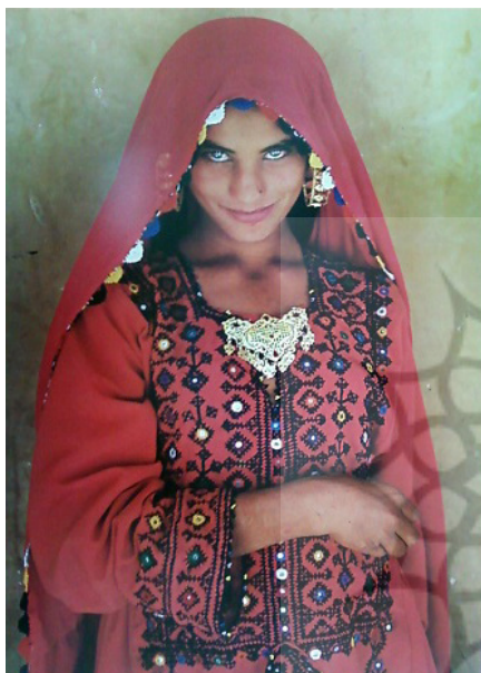
تصویر ۵: نمونه‌ای از زیورآلات بلوچ (ذوالفقاری ۱۳۸۹، ۱۵۲).

بنا بر عقیده برخی باستان‌شناسان، جنوب شرق ایران به ویژه بلوچستان یکی از نقاطی است که بر سر راه مهاجرت نخستین گروه‌های انسانی از آفریقا به سوی جنوب شرق آسیا قرار داشته است. از اینرو از مناطق مهم و کلیدی به شمار می‌رود. منظور از زیورآلات سنتی در بلوچستان، زینت‌آلات سنتی شهری، روستایی و مردم چادرنشین بلوچستان می‌باشد که به عنوان یک منطقه فرهنگی در نظر گرفته شده است. «از سابقه تاریخی ساخت زیورآلات در سیستان اطلاع چندانی در دست نیست و مسلم است زیورآلات را دوره‌گردها که وطن خاصی نداشتند و از یک منطقه به منطقه دیگری می‌رفته‌اند که معمولاً به آنها کولی گفته می‌شود می‌ساخته‌اند» (یعقوبی ۱۳۹۲، ۷۵). زیورآلات این منطقه، عمدتاً از نقره بوده و استفاده از فلزات دیگر صرفاً جهت ساخت زینت‌های بدلی بوده است. ابزار و وسایل ساخت زیورآلات در بلوچستان، شامل ابرک، ریجه، برمه، بوته سوز، پرس مکانیکی، جوت انبر، چکش، چمود و دریل برقی، سنگاتی، سرایی، سندان، سنگ سباده، سوهان، سیم چین و ... می‌باشد.