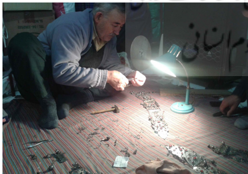
تصویر ۳: ساخت جواهرات در یک کارگاه جواهرسازی، بندر ترکمن (نگارندگان).

ساخت زیورآلات ترکمن، «در کارگاه‌های استادکاران نقره‌کار با وسایل ابتدایی و روش‌های خاص صورت می‌گیرد» (کلته و پوری ۱۳۸۲، ۷). مواد اولیه تولید این زیورآلات، شامل نقره، طلا، ورشو، برنج، قلع، تنه‌کار، کاتمنیوم، عقیق، سرب و انواع سنگ‌های رنگی می‌باشد. البته از میان مواد اولیه مذکور، نقره بیش‌ترین کاربرد را دارد و دیگر فلزات، به عنوان فلزات تکمیلی یا جهت ساخت زیورهای بدلی مورد استفاده قرار می‌گیرند. زیورسازان ترکمن، از ابزارآلات مختلفی استفاده می‌کنند که شامل کوره ذوب، بوته، آتشگیر، انواع چکش، سندان، دم‌باریک زرگری، حدیده، دستگاه ورق‌کن، انواع قیچی، سوهان و سمباده، شابلون‌های نقوش، انواع انبر، اره، برس و گیره، لوله دم، دستگاه نورد برقی، ترازو، مشعل گازی، چراغ پریموس و انواع دریل می‌باشند (تصویر ۳).