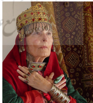
تصویر ۲: نمونه‌ای از کاربرد زیورآلات ترکمن (همان).