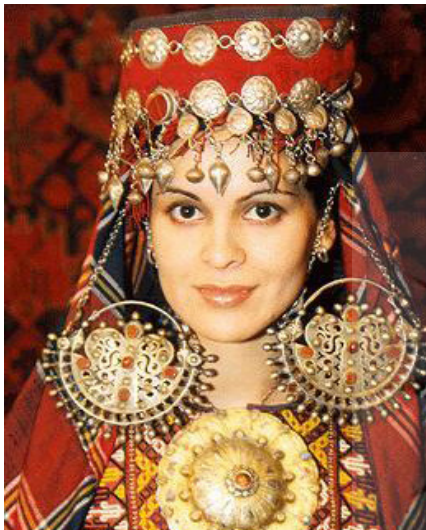
تصویر ۴: نمایی از زیورآلات زن ترکمن

زرگرها سعی می‌کنند تا جایی که محدودیت‌های هنری اجازه می‌دهد ذهنیت خود از زیبایی را روی اثر پیاده کنند. هرچه بیش‌تر بتوانند این زیبایی را از درون خود به بیرون انتقال دهند، اثر هنری آنها دارای اصالت بیش‌تری خواهد بود. «زیورآلات ترکمن اغلب به صورت قطعاتی درشت از نقره‌اند که بر سطح آن‌ها طرح‌هایی ساده شده از گل و گیاه و نقش‌هایی جادویی حک شده و با نگین‌هایی از عقیق یا شیشه‌های رنگین تزیین شده‌اند. این زیورآلات اغلب فاقد جزییات و دارای وقار و سنگینی ویژه‌ای هستند که به آن‌ها اصالت خاصی می‌بخشد. این جواهرات که وزن خیلی زیادی دارند در ابتدا برای هدف خاصی ساخته شده‌اند. گویی صدای جیرینگ جیرینگ آن‌ها طلسم محافظی است که ارواح شرور را دور می‌کند و باور ترکمن‌ها در مورد باطل السحر بودن فلزات ما را وادار به قبول این نظریه کرده و عظمت و بزرگی آن‌ها محافظی است که همیشه همراه صاحبانشان می‌باشد» (محمدی ۱۳۸۸، ۹۴).