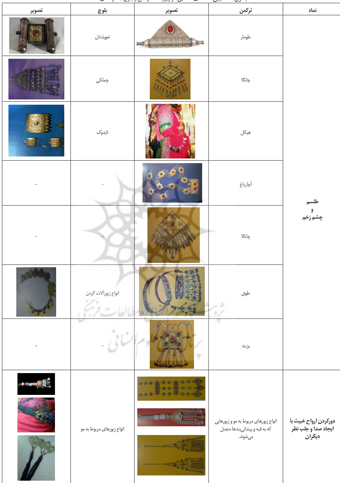
جدول ۲. تطبیق نمادهای مذهبی در زیورآلات ترکمن و بلوچ (نگارندگان).