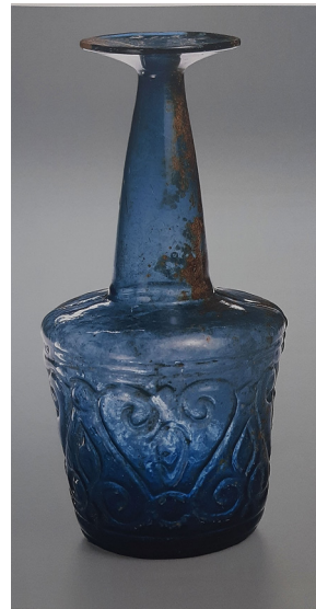
تصویر ۷: تنگ گوشت‌کوبی، تزئین به شیوه دمیده در قالب دوتکه، سده ۴ و ۵ ه.ق، احتمالاً ایران، مجموعه الصباح، موزه ملی کویت (Carboni and Whitehouse 2001, 91).