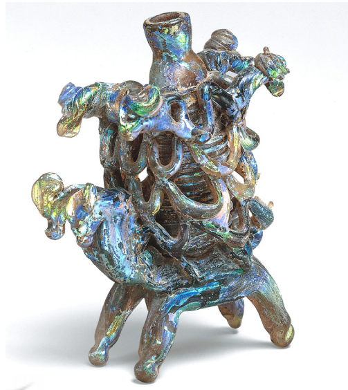
تصویر ۴: فلاسک حیوانی، سوریه، شماره ثبتی: ۶۹/۱۵۳ (www.metmuseum.org)