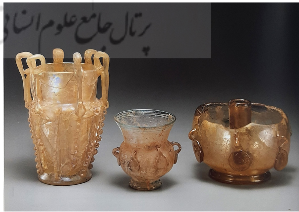
تصویر ۹: قندیل‌های شیشه‌ای، به ترتیب از راست) سوریه، سوریه یا ایران و ایران (Carboni 2001, 165-167, Cats. 38a-c).