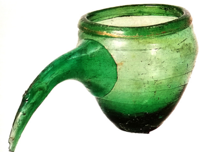
تصویر ۱۱: ظرف شیشه‌ای حجامت، محل نامشخص (مادیسون و ساواژ اسمیت ۱۳۸۷، ۴۰).