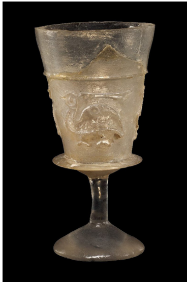
تصویر ۸: جام شیشه‌ای پایه‌دار، مصر یا ایران (Whitehouse 2010, 210).