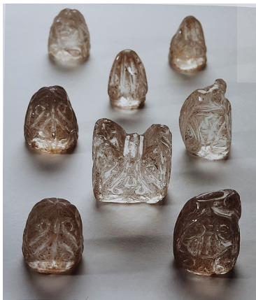
تصویر ۱۰: مهره‌های شطرنج ساخته‌شده از سنگ بلور، مصر (Alkhemir 2014, 123).