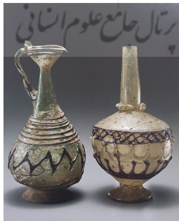
تصویر ۱۲: تنگ شیشه‌ای با تزئین نوار افزوده، ایران (Carboni 2001, 176-177, Cats.43a-b).