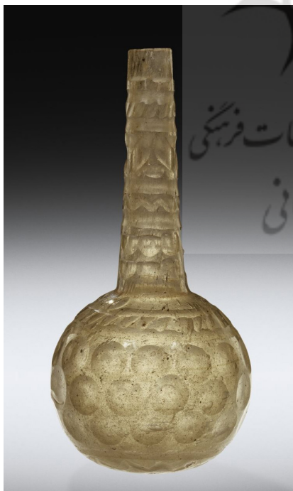
تصویر ۶: صراحی شیشه، ایران، شماره ثبتی: ۵۵/۱/۱۲۹

لیوان‌ها و جام‌های پایه‌دار از جمله فرم‌های متداول در این دوران است که به نظر می‌رسد استفاده از این فرم در شیشه‌گری اسلامی مورد توجه قرار می‌گیرد. «لیوان‌هایی برای نوشیدن مایعات از فرم‌های معمول در سده‌های چهارم تا پنجم ه. ق محسوب می‌شوند. اغلب این فرم‌ها با استفاده از نقوش قالبی حاوی نقوش حیوانی و نوشتاری است» (Carboni 2001, 87). بر روی این آثار، اغلب از تزئینات قالبی حاوی نقوش حیوانی و خط استفاده می‌گردید (تصویر ۸).