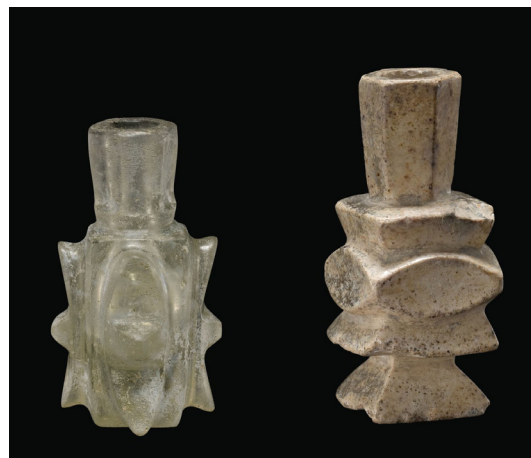
تصویر ۱۴: عطردان‌های شیشه‌ای، با کاربرد تراش، ایران یا عراق (Whitehouse 2010, 62)