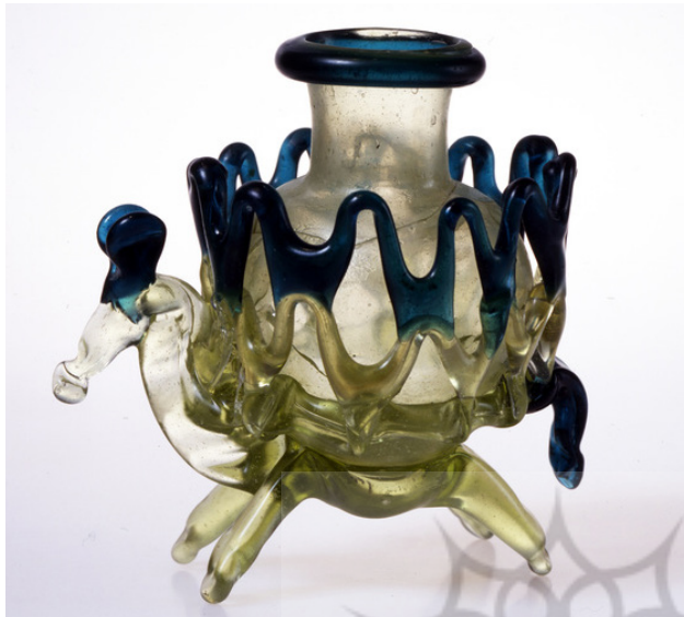
تصویر ۵: فلاسک حیوانی، سوریه، شماره ثبتی: ۱۹۷۹/۴۹ (www.davidmus.dk)

(Carboni et. al 2006, 56) «فلاسک‌های حیوانی ۷ با استفاده از نوارهای شیشه‌ای تزئینی ساخته می‌شدند. در این آثار، ظرف شیشه‌ای روی پیکره حیوانی قرار می‌گرفت که با نوارهای شیشه‌ای در قالب قفس‌های محافظ ظرف مشاهده می‌شد. این ظروف برای نگهداری مایعات معطر مورد استفاده بوده است» (Ibid, 56) (تصاویر ۴ و ۵).