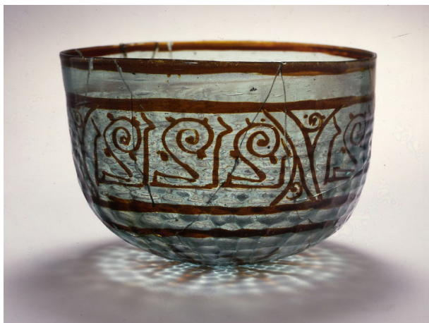
تصویر ۱۵: کاسه شیشه‌ای با تزیین مینیایی نوع قرمز رنگ، مصر