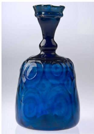
تصویر ۱۳: تنگ زنگوله‌ای با تزئین قالبی و نقوش مدور، ایران، شماره ثبتی: GL.521 (www.Islamicartsmagazine.com)

به کارگیری قالب برای ایجاد نقوش و تزئینات روی بدنه تولیدات شیشه‌گری اسلامی در حالت گرم مشاهده می‌شود. آثار ارزشمند و بی‌بدیلی که با این شیوه ساخته شده‌اند از بیش‌ترین تنوع و فراوانی در بین شیشه‌های اسلامی برخوردار هستند. «استفاده از قالب برای ایجاد نقش روی بدنه ظرف در حالتی که گوی شیشه هنوز فرم نهایی را به خود نگرفته است، از ابداعات شیشه‌گری اسلامی در ایران و عراق و سوریه محسوب می‌شود. در این روش، به دلیل گرم‌نمودن مجدد شیشه پس از فشردن در قالب، نقوش روی آثار بزرگ‌تر شده و در مواردی از قرینگی و نظم خارج می‌شوند. متداول‌ترین نقوش در قالب‌ها اشکال هندسی متحدالمرکز با یک دایره در مرکز (اصطلاحاً اومفالوس ۴ )، نقوش گیاهی و گل‌های بزرگ متشکل از چند گلبرگ و ایجاد خطوط موج‌دار است. در مواردی نیز نقش طاووس و الگوی لانه‌زنبوری در تولیدات شیشه مشاهده می‌شود» (Ibid, 64) (تصویر ۱۳).