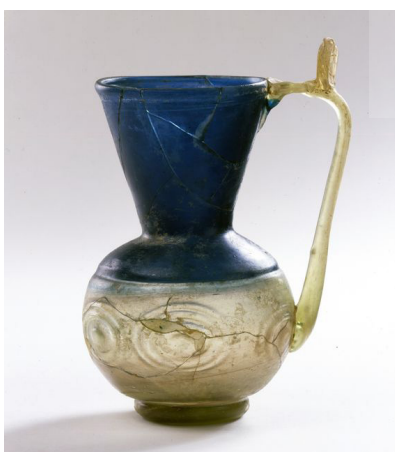
تصویر ۳: پارچ شیشه‌ای، شیوه ساخت اینکالمو، ایران شماره ثبتی: 9/1966 (www.davidmus.dk)

استفاده از شیوه اینکالمو که به نظر می‌رسد توأمان از شیوه‌های ساخت و تزئین شیشه محسوب می‌گردد، برای اولین بار در شیشه‌گری اسلامی مشاهده می‌شود. «شیشه‌گران اسلامی از نظر فنی مهارت بسیاری در پوشش کامل یا جزئی و همچنین فرایندهای پیچیده هم‌جوشی قطعات شیشه با رنگ‌های متضاد داشتند. این شیوه از ساخت شیشه، در دوره‌های بعد در شیشه‌گری روم متداول می‌شود» (Ricke 2002, 39). در سده‌های بعدی با انتقال این شیوه از شیشه‌گری اسلامی به شیشه‌گری غرب، اینکالمو به عنوان یکی از شیوه‌های رمزآلود شیشه‌گری مورانو مطرح می‌شود.