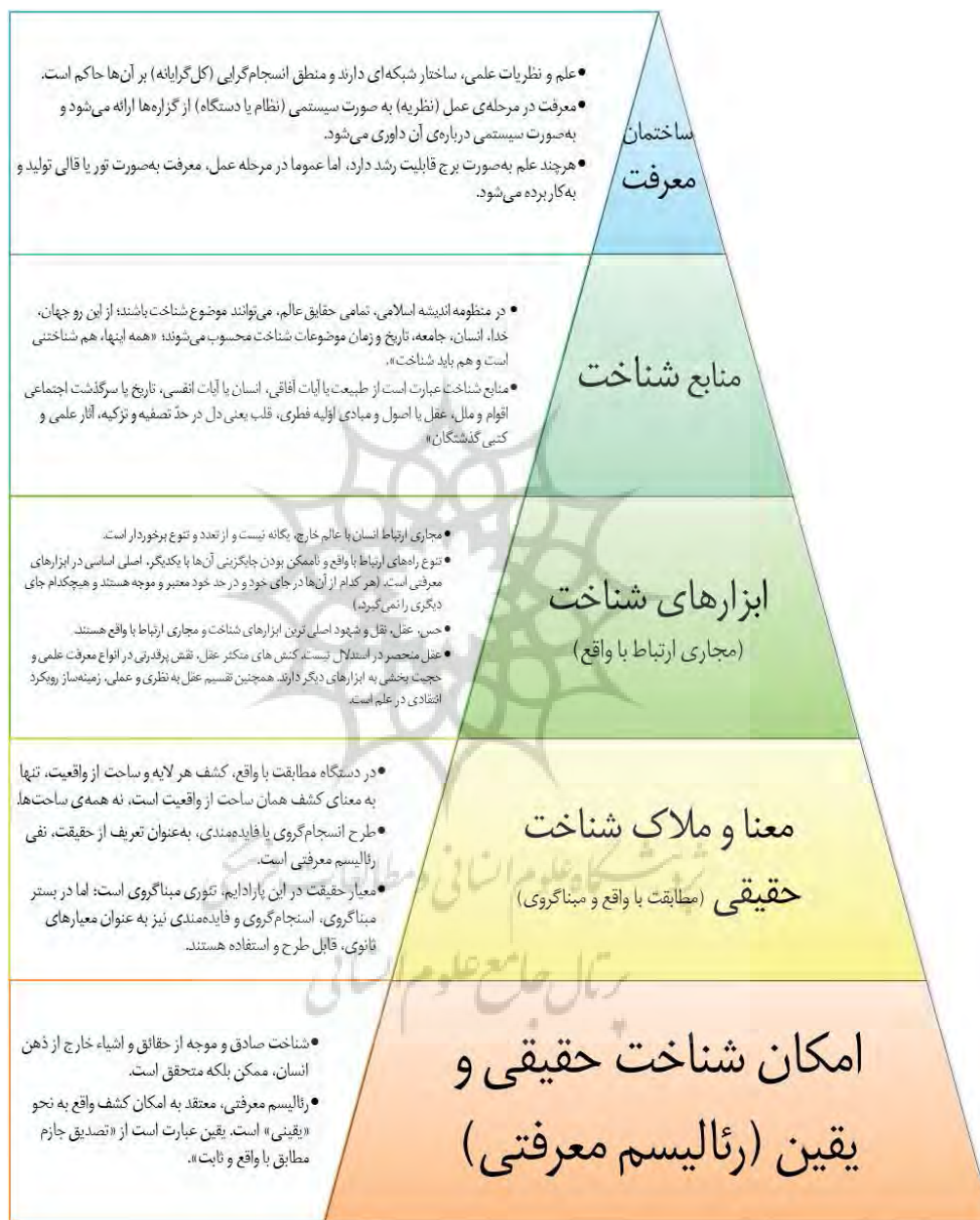
نمودار ۲. هرم میانی معرفت‌شناسانه پارادایم اسلامی علم

و اجتماعی به ارمغان آورد. انقلاب اسلامی نیز برای تثبیت، ارتقا و دستیابی به اهداف خود، نیازمند علمی است که در بستر این پارادایم تولید می‌شوند؛ پارادایمی که ذاتاً از جوهره حکمت اسلامی مایه می‌گیرد.