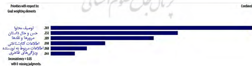
نمودار ۱. اولویت‌بندی و وزن نهایی معیارهای اصلی

بر اساس ماتریس مقایسه زوجی معیارهای اصلی، نتایج به دست آمده برای اولویت‌بندی معیارهای اصلی در نمودار ۱ نشان داده شده است.