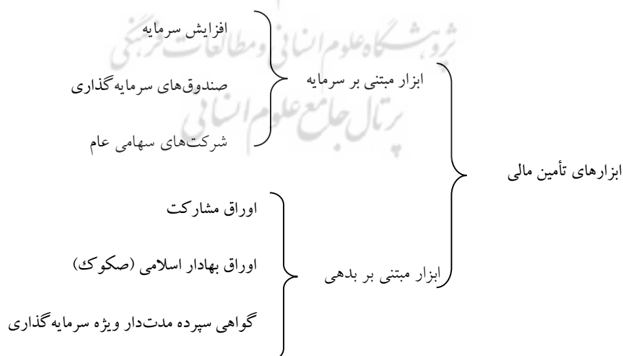
شکل ۲. ابزارهای تأمین مالی در ایران

ابزارهای مالی اسلامی از جمله اوراق صکوک و مشارکت، ابزارهای مبتنی بر بدهی هستند که شرکت‌های تأمین سرمایه در رسالت خود می‌بینند که از این ابزارهای مالی اسلامی به طور گسترده در جهت تأمین مالی مشتریان خود استفاده نمایند و تلاش آن‌ها در راستای کمک به نهادهای قانونی ذی‌ربط در جهت تسهیل و تسریع تصویب دستورالعمل این ابزارها به منظور رفع نیازهای مالی مشتریان خود خواهد بود. و در مورد ابزار تأمین مالی مبتنی بر سرمایه که این روش مستلزم واگذاری قسمتی از سود پروژه در مقابل دریافت سرمایه است. در واقع در این روش با استفاده از آورده نقدی و غیر نقدی سهامداران و افزودن بر حجم حقوق صاحبان سهام در شرکت و یا پروژه، سرمایه مورد نیاز تأمین می‌شود. در شکل ۲ تقسیم‌بندی کلی از ابزارهای تأمین مالی شرکت‌های تأمین سرمایه در ایران را مشاهده می‌کنید (شرکت تأمین سرمایه آرمان):