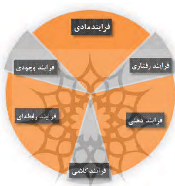
شکل ۱: انواع فرایندهای فرانش تجربی

همچنین، مقایسه دو اثر در یک ژانر خاص نیز به مدد این تحلیل‌های زبانی میسر خواهد شد. در این پژوهش بر مبنای دستور نظام‌مند - نقش‌گرای هلیدی به بررسی دو اثر ادب حماسی پرداخته می‌شود تا بتوان به میزان بهره‌مندی آن دو از زبان حماسی دست یافت. در بخش بعدی به صورت عملی به شرح این مباحث پرداخته خواهد شد.