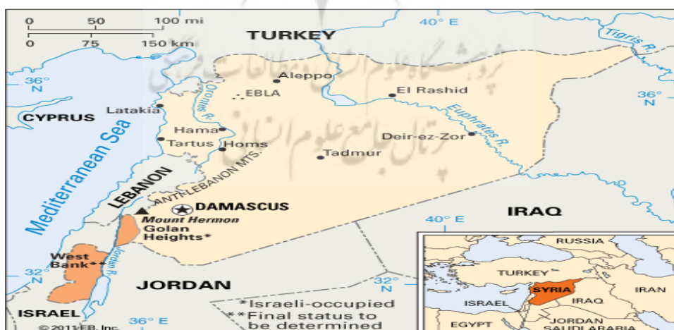
نقشه ۱. موقعیت جغرافیایی سوریه

محوری این کشور در اکثر بحران‌های منطقه‌ای مانند جنگ ایران و عراق، صلح خاورمیانه، حمله عراق به کویت و ...، گواهی بر اهمیت استراتژیک و ژئوپلیتیک این کشور در خاورمیانه است. اهمیت و نقش سوریه در معادلات خاورمیانه تا اندازه‌ای است که هنری کسینجر می‌گوید: «اعراب نمی‌توانند بدون مصر بجنگند و بدون سوریه صلح کنند» (Ahmadi Arkami & Nami, 2019: 21). همچنین سوریه یک بازیگر ژئوپلیتیک محور است که با سه عامل واقع شدن در منطقه استراتژیک خاورمیانه، قرار گرفتن بر کناره شرقی دریای مهم مدیترانه و برخورداری از ۱۸۶ کیلومتر ساحل با کشورهای حاشیه این منطقه ارتباط دارد. نقش آفرینی سوریه در معادلات سیاسی لبنان و قرار گرفتن دمشق به عنوان دولت حامی مقاومت اسلامی، بر اهمیت استراتژیک سوریه افزوده است (Ghasemi Aliabadi & others, 2018: 68-69). از این رو، به دلیل اهمیت و نقش راهبردی این کشور، بسیاری از کارشناسان روابط بین‌الملل، «سوریه را بزرگ‌ترین کشور کوچک جهان» لقب داده‌اند (William Samii, 2008: 42). سوریه کشوری بسیار مهم از لحاظ جغرافیایی و استراتژیک است. از نظر موقعیت جغرافیایی، سرپل سه قاره آفریقا، اروپا و آسیا محسوب می‌شود. ۱۸۵ هزار کیلومتر مساحت و ۱۸۰ کیلومتر مرز آبی با مدیترانه باعث شده تا دسترسی به اروپا و شمال آفریقا برای این کشور به آسانی فراهم گردد. از حیث جغرافیای سیاسی نیز ۷۰ کیلومتر مرز مشترک با رژیم صهیونیستی و ۳۵۰ کیلومتر مرز مشترک با لبنان باعث شده تا این کشور موقعیت متمیزی در این منطقه داشته باشد (Esmailpour Roshan, 2017: 232).