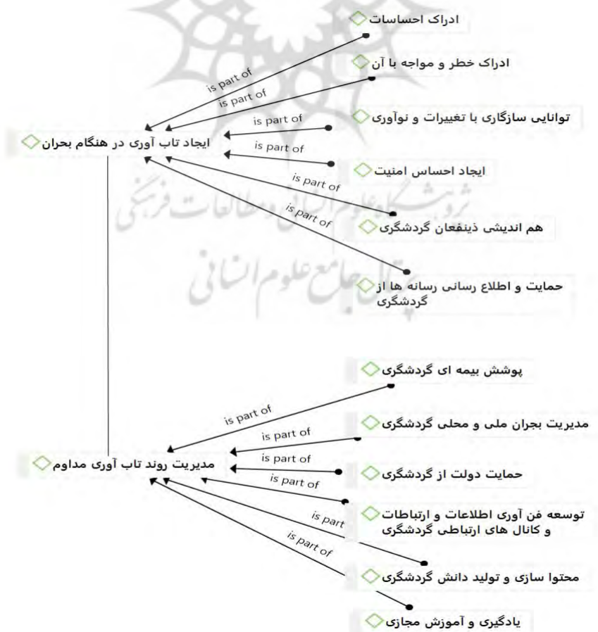
شکل شماره ۳. تصویری از مدل‌سازی سلسله‌مراتب کدها در نرم‌افزار Atlas-TI

در ادامه، با توجه به یافته‌های پژوهش، همچنین فضا و مدل‌سازی نرم‌افزار Atlas-TI، شکل (مدل) گرافیکی ۳ را ارائه شده است که نسبت کلی مفاهیم، مقولات و ابعاد را در این پژوهش نمایش می‌دهد.