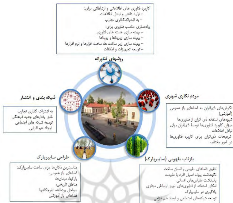
شکل شماره ۴. ابعاد و ارکان پیاده‌سازی سایبر پارک در محیط دانشگاهی بر اساس ادبیات پژوهش

(Klichowski, 2018:34). شکل گرفته است. در ادامه مدل مفهومی پژوهش جهت پیاده‌سازی سایبر پارک در بافت‌های آموزشی و محیط‌های دانشگاهی توسعه یافته است (شکل ۴).