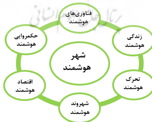
شکل شماره ۱. مفهوم شهر هوشمند (Klichowski, 2018:126)

کلمه سایبر پارک که ترکیبی از دو کلمه سایبر و پارک می‌باشد اولین بار در پروژه‌ای به همین نام مطرح شد. سایبر پارک مکانی است که از ترکیب ساحت دیجیتالی و فیزیکی شکل می‌گیرد و در آن محیط‌های فناور محور به زیستگاه‌های اجتماعی هوشمند ارتقا می‌یابند (Klichowski et al, 2015:3; Smaniotto et al, 2018:165). این مکان بستری است که در آن با استفاده از هم آفرینی فضاها و تعاملات دیجیتالی، طبیعت، سایبر و مردم درهم آمیخته می‌شود (Klichowski et al, 2016; Smaniotto et al, 2018:180). به بیان دیگر، سایبر پارک شهری یک بافت شبکه‌ای اجتماعی است که ذی‌اثران در فضاهای باز عمومی با به‌کارگیری فناوری‌های نوین اطلاعات و ارتباطات و از طریق مشارکت‌ها و برهم‌کنش‌های فناورانه، دانش و تجربیات خود را به اشتراک می‌گذارند (Klichowski et al, 2015:10; Smaniotto et al, 2018:165; Klichowski, 2018:20).