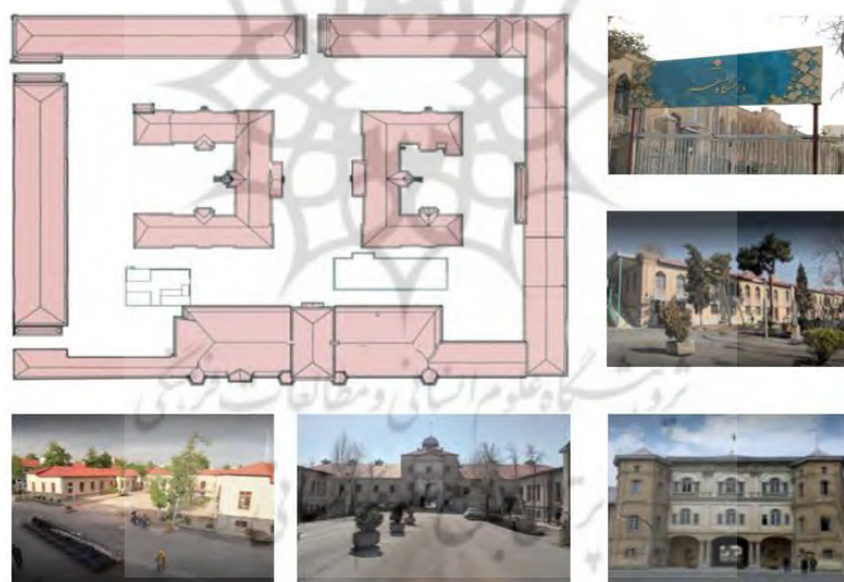
شکل شماره ۶. موقعیت فعلی قرارگیری بناها و فضاهای باز عمومی در مجموعه پردیس باغ ملی دانشگاه هنر

پردیس باغ ملی، چهار دانشکده کامل (هنرهای تجسمی، معماری و شهرسازی، حفاظت و مرمت و علوم نظری و مطالعات عالی هنر) و بخش هنرهای نمایشی از دانشکده سینما و تئاتر را در خود جای داده است و دانشجویانی از رشته‌ها و مقاطع تحصیلی مختلف در آن مشغول به تحصیل هستند. علاوه بر آن بخش‌های اداری و خدماتی اصلی و مرکزی دانشگاه نیز در این مجموعه قرار دارند (شکل ۶).