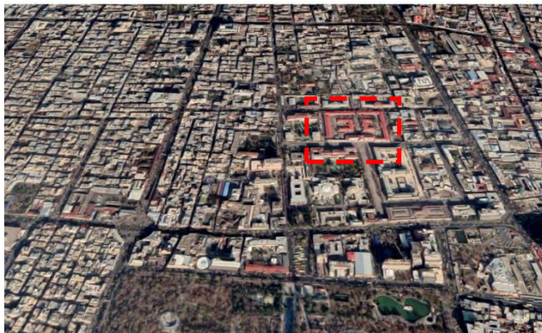
شکل ۵. موقعیت قرارگیری پردیس باغ ملی دانشگاه هنر در منطقه ۱۲ شهرداری تهران

پردیس باغ ملی، چهار دانشکده کامل (هنرهای تجسمی، معماری و شهرسازی، حفاظت و مرمت و علوم نظری و مطالعات عالی هنر) و بخش هنرهای نمایشی از دانشکده سینما و تئاتر را در خود جای داده است و دانشجویانی از رشته‌ها و مقاطع تحصیلی مختلف در آن مشغول به تحصیل هستند. علاوه بر آن بخش‌های اداری و خدماتی اصلی و مرکزی دانشگاه نیز در این مجموعه قرار دارند (شکل ۶).